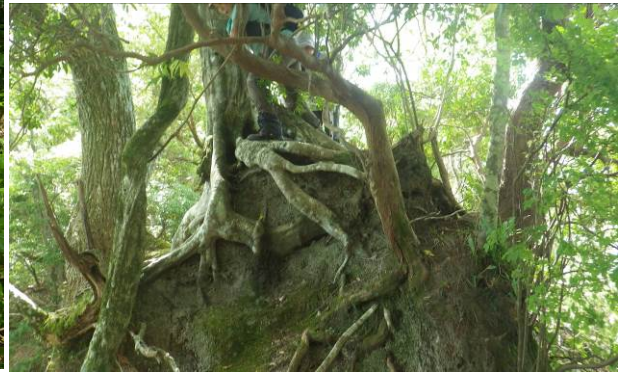
コース真ん中の立木が邪魔をする この部分を下る