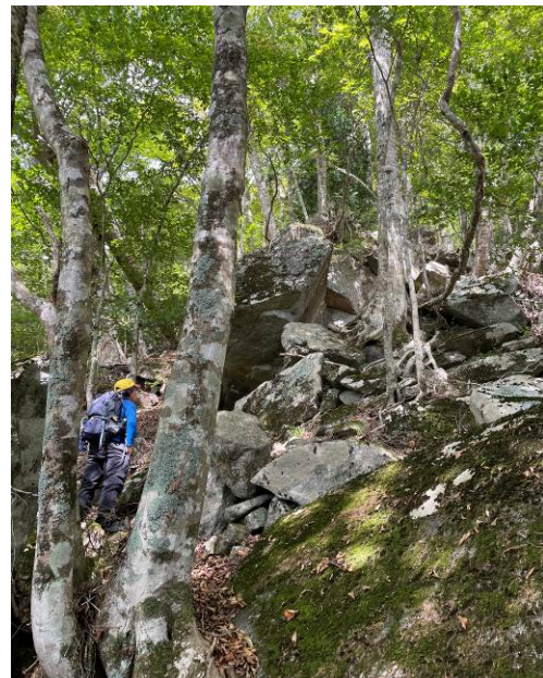
どのルートに登るかルートファイン