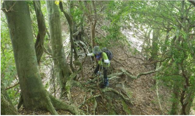
両サイドが切れている細い尾根