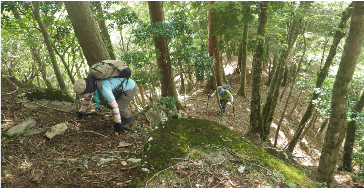
ここもかなりの急な登り（下山に使用するのは、遠慮したい）