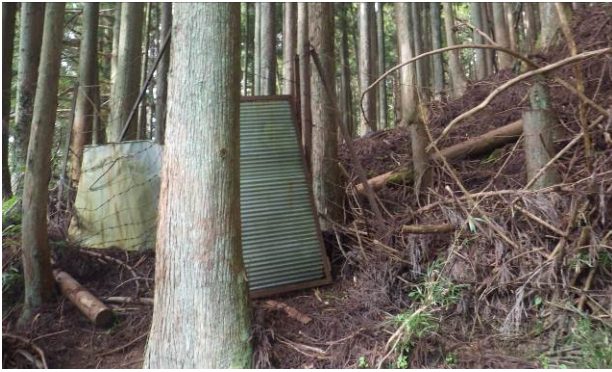
このトタンの扉を開いて入る