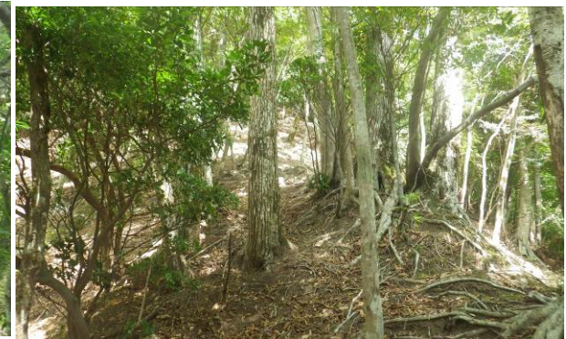
細い尾根の次はまた急登に