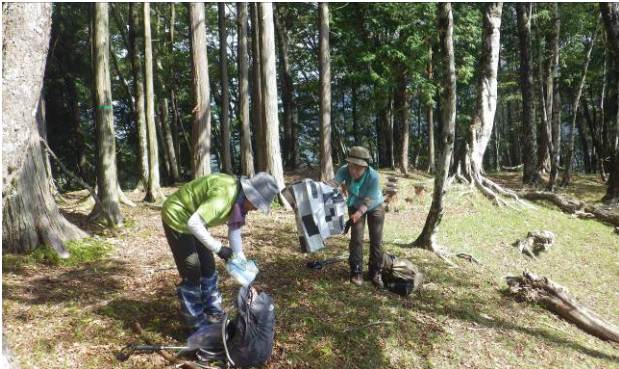
山頂に到着、昼食場所