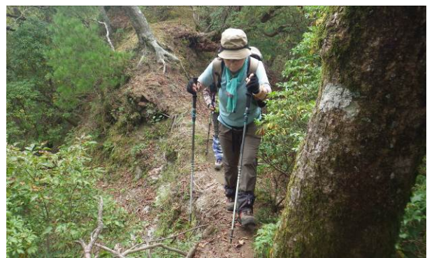
細い尾根を通過（両サイドは切れ落ちています）