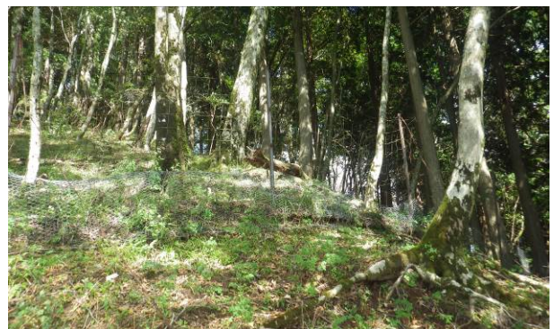
山頂には鹿柵が邪魔で柵沿いを左に