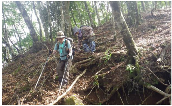
下山コースも急な下りが