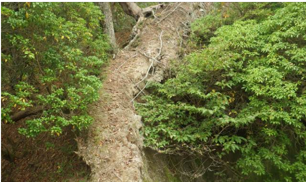
途中距離は短いですが細い尾根