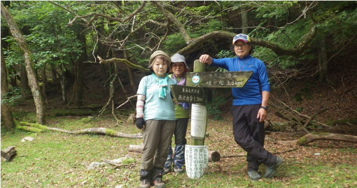
一般ルートで、今日初めての登山者に会い記念撮影の依頼を行った