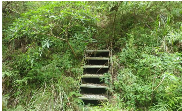
林道を挟んでこの階段より登る