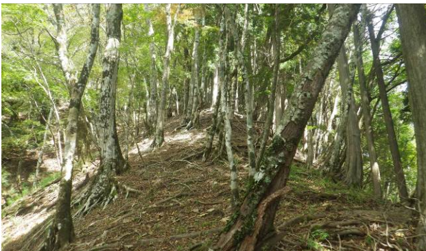
頂上への最後の登り