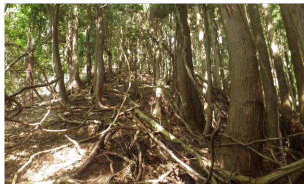
この部分を直登する