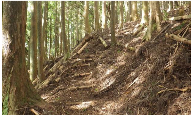
作業用に整備されている