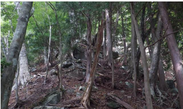
岩稜帯が出てきた