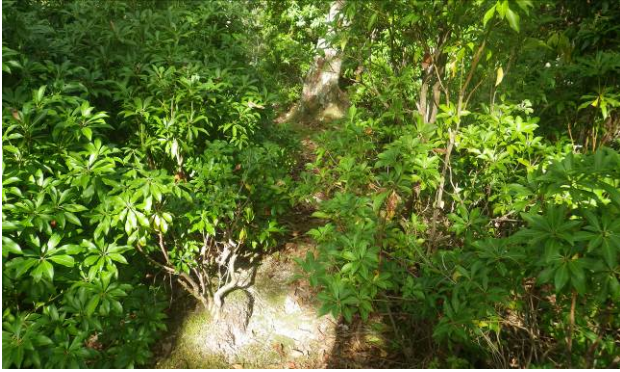
コースが木の葉で見にくい