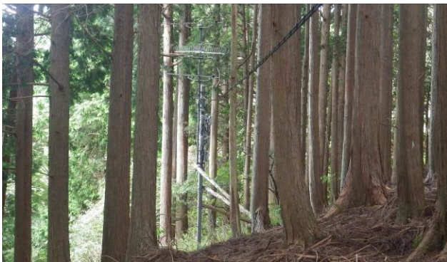
この場所にテレビアンテナが 部落からはかなり距離がある