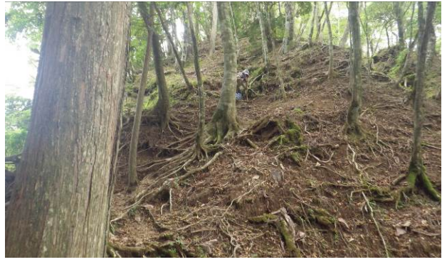
このコースも一般ルートでは無い