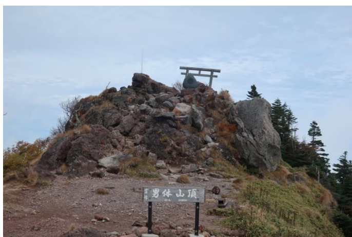
こっちが山頂のようだ