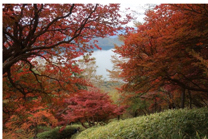
中禅寺湖が見えた