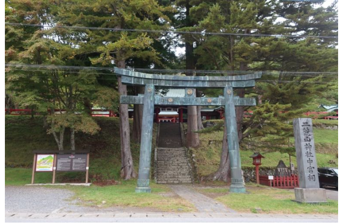
二荒山神社中宮祠入口