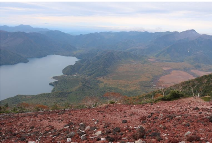
中禅寺湖と草紅葉が見事な戦場ヶ原