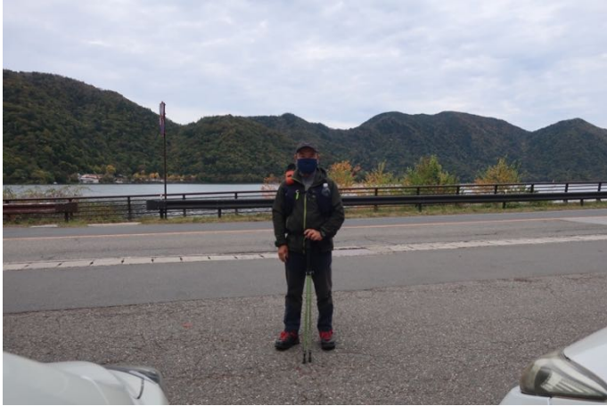
中禅寺湖畔から出発