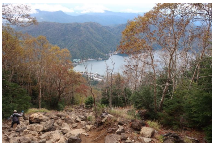
標高 2000m 位の地点 だいぶ上がった