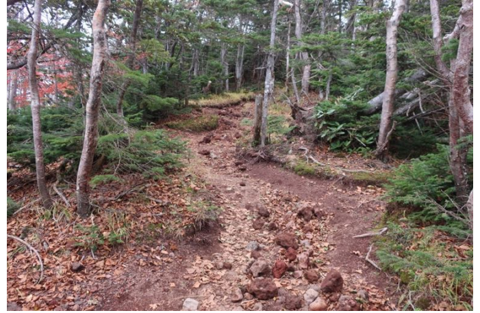
急登の岩場続きであったが、標高 2250m を 越える辺りから勾配が緩み、かなり楽になった