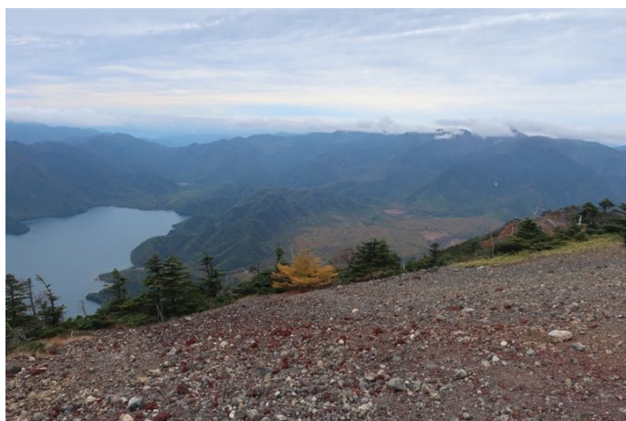
正面に武尊山が見えるはずが雲の中