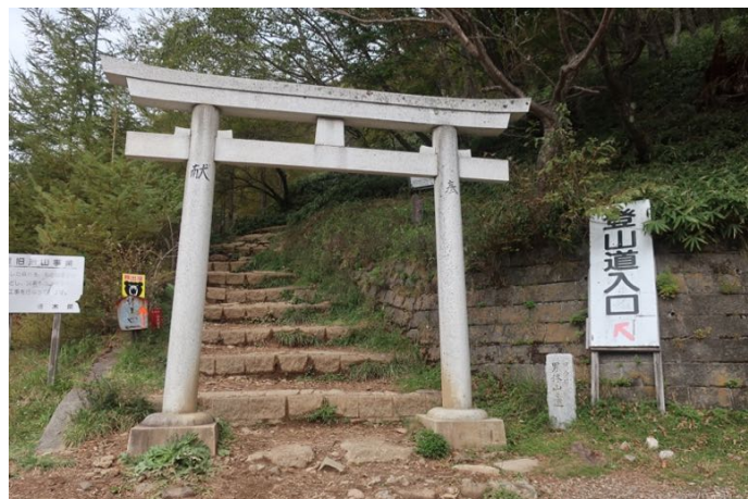
四合目からまた登山道に入る