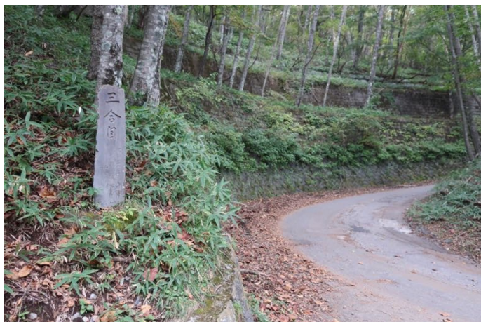
三合目からは長い林道(車道)に出る 元の登山道が崩れて通れなくなっているようだ