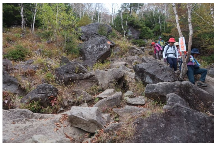
七合目避難小屋から上は岩場 段差が大きく、渋滞気味