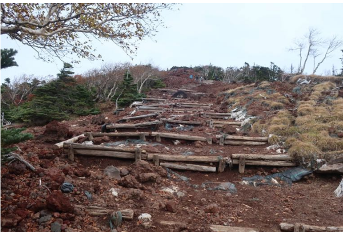
山頂まであと少し