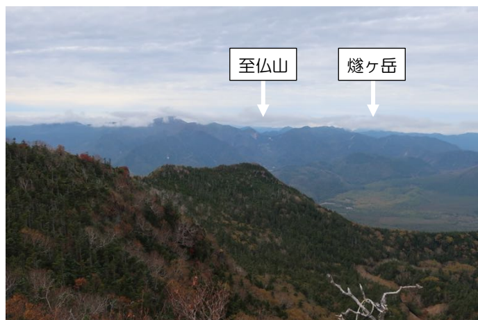
燧ヶ岳と至仏山がかろうじて見える