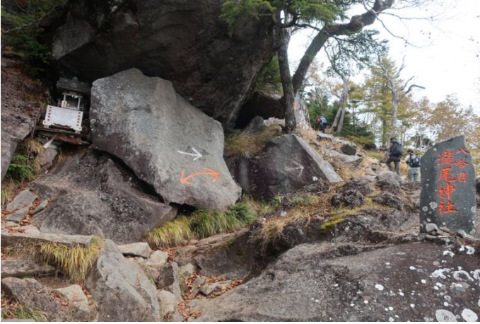
八合目避難小屋前 滝尾神社がある 岩場は続く