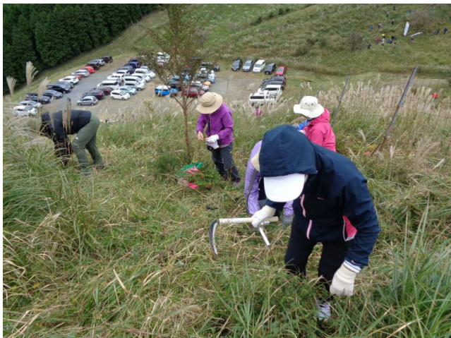
広大なエリアでは 200 名でも疎らに見える

各自草刈り鎌、クワを受け取り指定されたエリアへ、まずはヤブを刈り取り、穴を掘り植栽を植えて行く