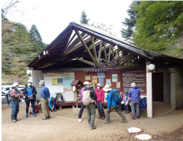
定時バスと合流し菩提峠へ向かう