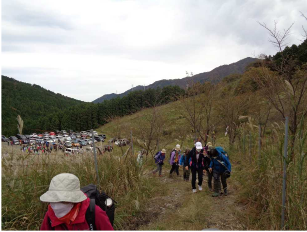
生憎の曇り空だがロケーションは抜群だった