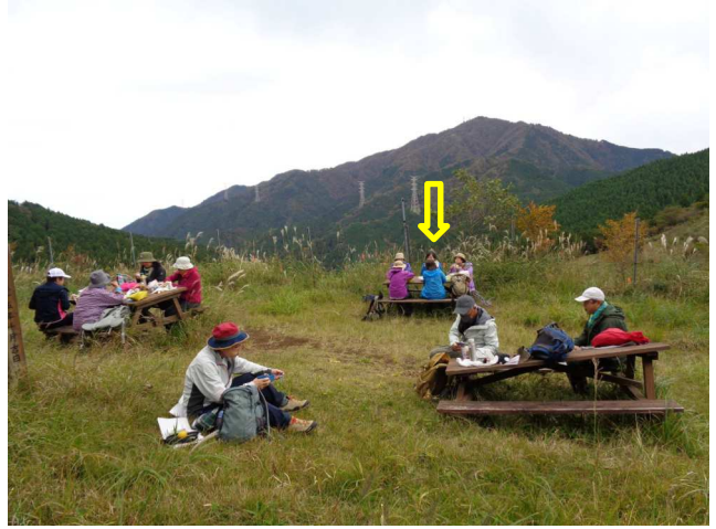
岳ノ台展望台にて