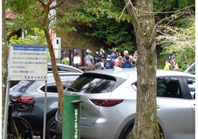
30分ほどで菩提峠の植栽会場に到着