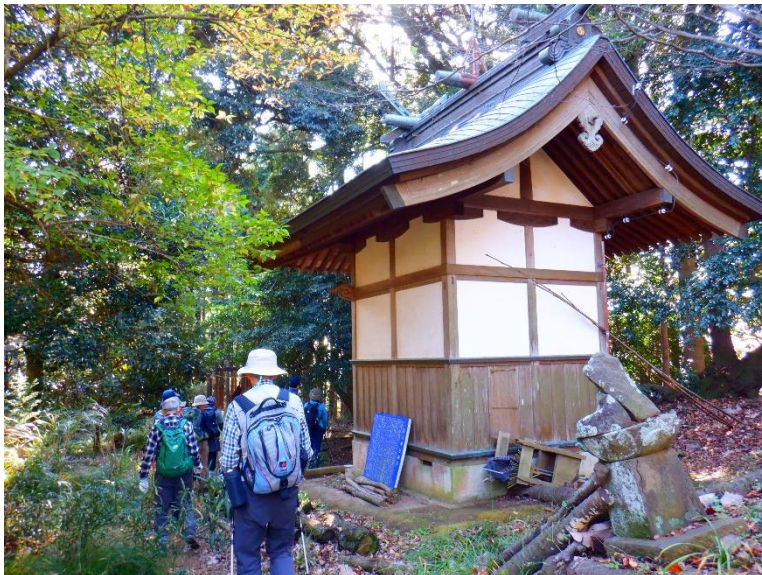
白龍が見守る白山池