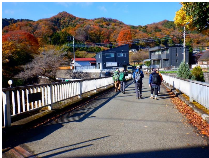
トレランの案内板有り。

本厚木駅から宮ヶ瀬行のバスに乗り尼寺（にんじ）で下車。ネット検索で登山口に向かう。歩いている登山者は私達だけ。