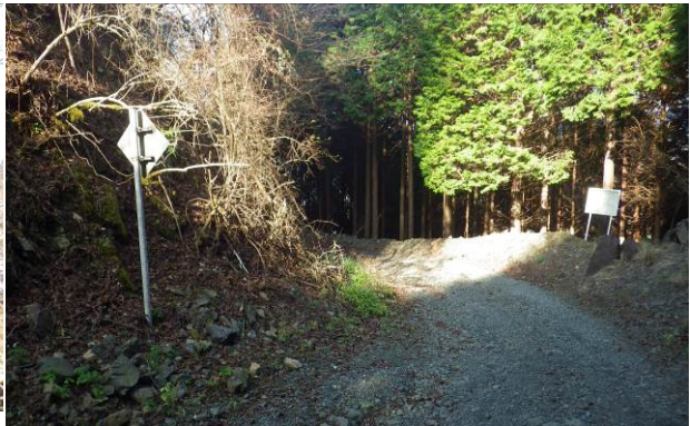
林道この方向に行けば世附峠に出る