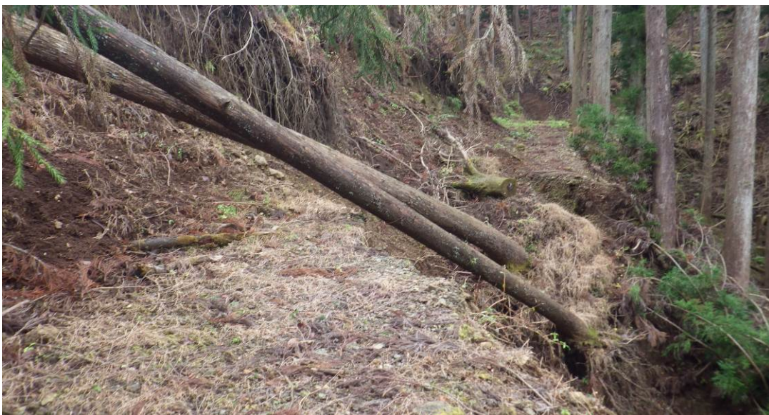
通過後状態 (山側に上がりトラバースが安全)