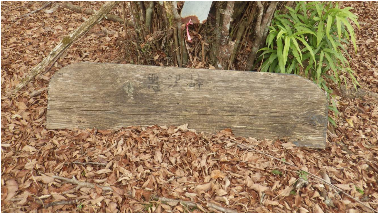
木のしたに悪沢峠の看板が