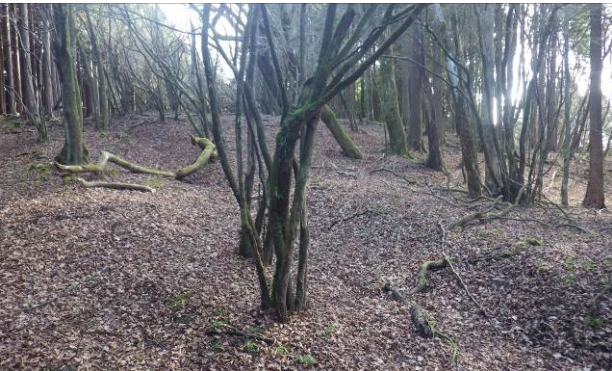
不老山南陵への登山道正面奥が山頂