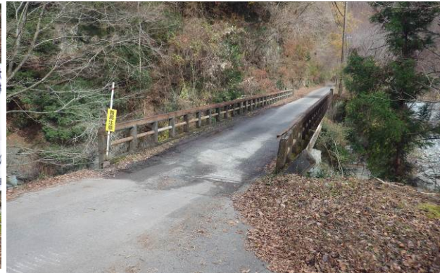
浅瀬ゲート方面の反対側に橋があり 行先は不明