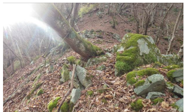
岩の先がかなりの急登