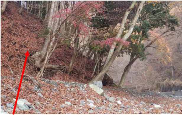
ここから川沿に進む