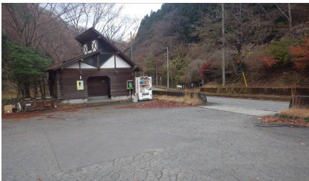
浅瀬ゲート前の駐車場 トイレもある

以前より気になっていた、芦沢橋ルートに行く計画で、登りのルートで北尾根が有ることが分かり上りに北尾根、下りに芦沢橋ルートで行った、北尾根の取り付き点は、浅瀬ゲートの対岸にある、広い河原で川が2本あり、渡渉は靴を脱いで、渡った、水深はくるぶし程度でした、渡渉後の場所から尾根筋までは、川沿いに約100m移動した所で、尾根に沿って登り始めた、最初はかなりの急騰で、途中から人工林になる、緩やかな斜面、急な斜面の繰り返しで、神奈川県水道資源林の界杭を、見ながら登って行く、途中林道にぶつかり、林道を横切り正面の尾根を登る、ここからもかなり急な登りで途中より尾根が左に変わる、そこからは約10分で不老山南陵への登山道にでる、この時期なので山頂には、誰もいない、ここから世附峠、悪沢峠までは、一般登山道になる、世附峠を過ぎ山椒バラの丘の部分は、枯れ草が覆い、登山道が不明瞭になる、悪沢峠には、古い標識が地面に置いてあるが、通常は気が付かない、ここが芦沢橋ルートの入口になる、このルートは最初作業用の林道がありこれを下ればよいと思い下り始めたが、途中より自分の考えていたルートを外れるので、林道を無視し、コンパスで方向を決めて下山した、途中林道にぶつかるが、直進し、人工林の中を下った、橋の近くまでおり、そこからは林道を下る、すぐに橋にでた、橋を渡った先が東海自然歩道で、10km行くと切通経由で山中湖へも行けるここから浅瀬ゲート経由で駐車場に向かう、舗装道路の為足が痛くなる、このコースは約9kmの為午前中に下山したので、駐車場で昼食を取り、車で帰宅。