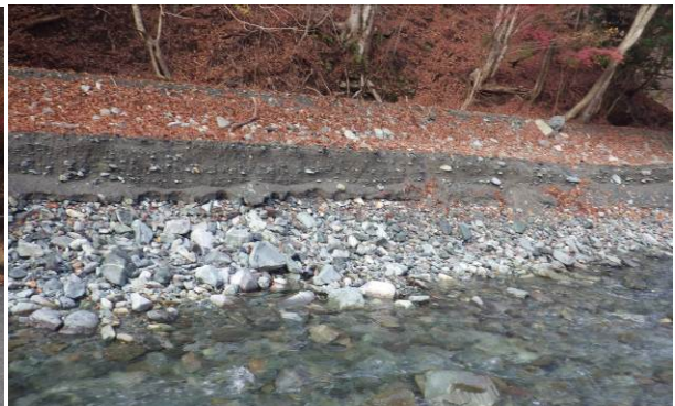
対岸が北尾根の取付点