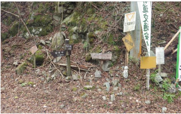
古い標識に 夕滝の表示