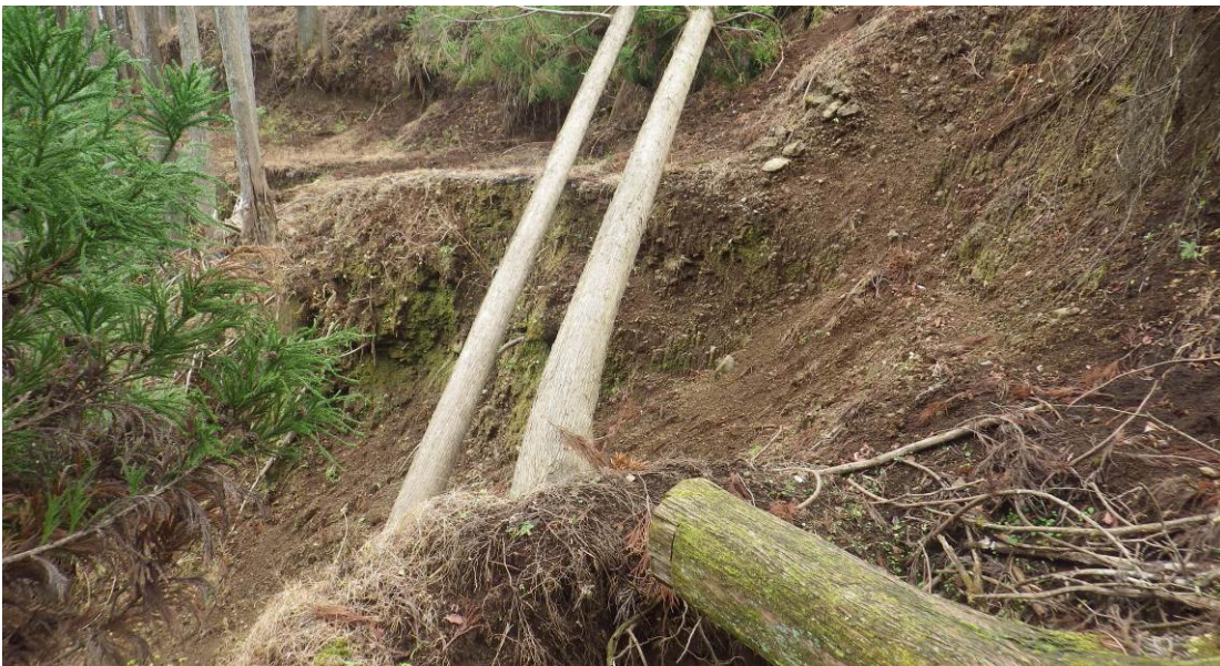
林道の崩落箇所 左側は崖の状態 木の下側を通過 滑りやすいので 落ちない様に進