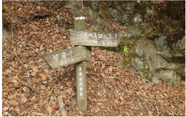
橋の先が東海自然歩道