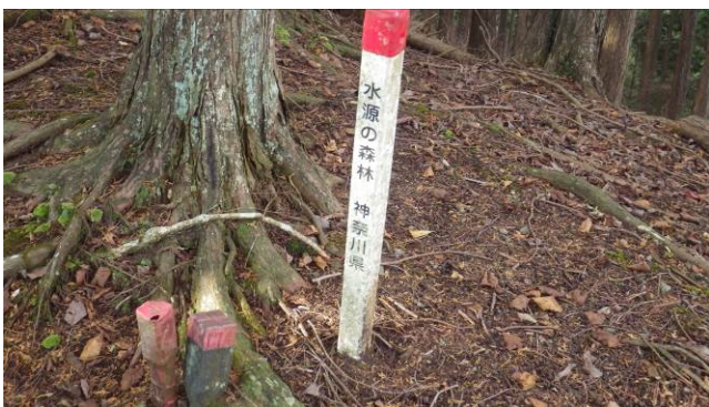
この尾根は神奈川県水源の森林の境