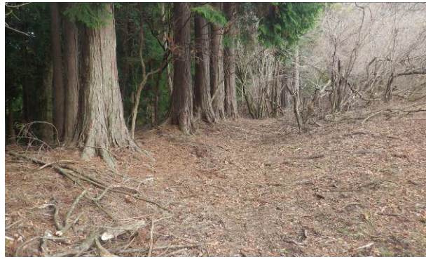
かなりきれいな登山道