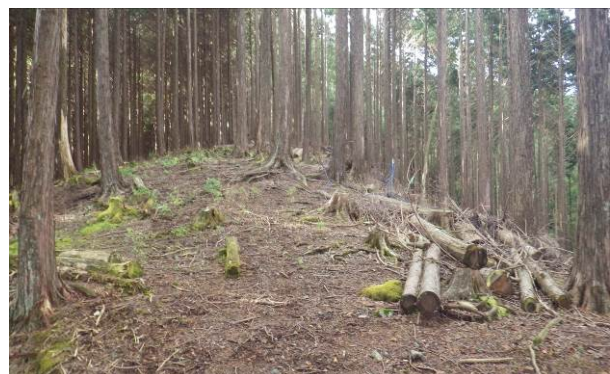
一部間伐が行われていて明るい