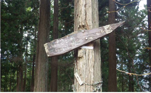
蘆沢橋ルート の標識 現在は使用していない