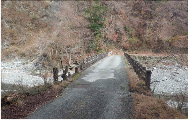
芦沢橋 車も通過できる