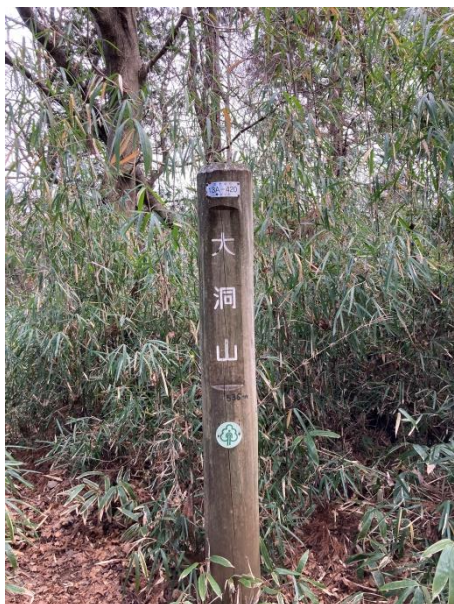
最初の山は標高 536 米の大洞山