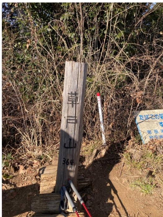
草戸山の下山口にて