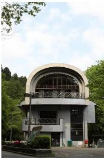
大地沢青少年センター

青少年センターBS までの途中にある大地沢青少年センターは町田市（東京都）が運営する立派な施設でした