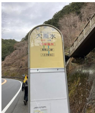
後方の陸橋を登り右方面へ

春暖を感じながら、なだらかな南高尾山稜歩きを目論みましたが、午前中は雲があり気温も低めでした。午後は日もさしてきてぽかぽかとのんびりハイキングで、日頃の運動不足解消になりました。