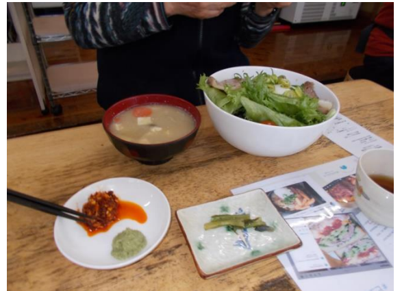
二番人気のポークソテー (ボリューム満点) ビーフシチューは完売でした