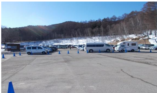
富士見パノラマリゾートの駐車場はスキー客で満杯。午後には手前の方も車で埋まった状態です。

快晴のスノートレッキング日和でした。雪山の絶景と雪に覆われたハケ岳をはじめとする山々やハケ岳ブルーと呼ばれる澄み切った青空、冬にしか味わえない大自然を満喫しました。