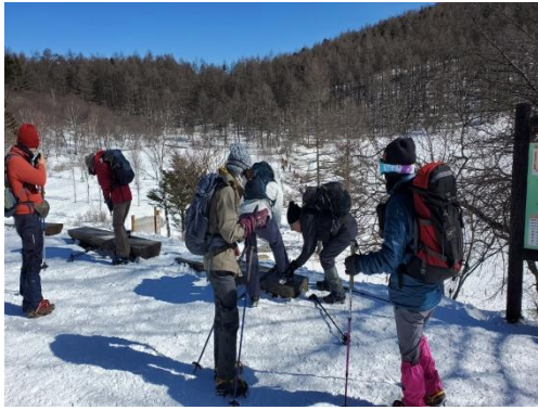
スパッとアイゼン準備