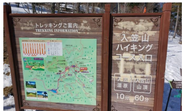
お疲れ様、下山口です