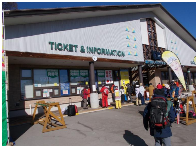
チケット売り場にてゴンドラ券を購入