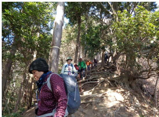
本日最大の木の根っこむき出しの急降下は慎重に一步づつ