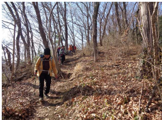
素朴なこれぞ山道を降りて行く