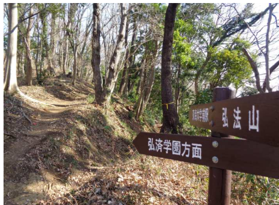
弘済学園(鉄道弘済会知的障害、自閉症児対象の療養支援施設)