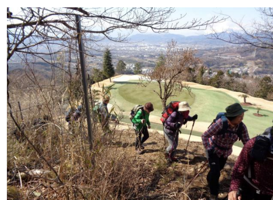
本格的な登山道を一步ずつ