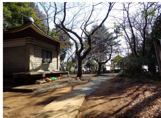
弘法山へ立ち寄り