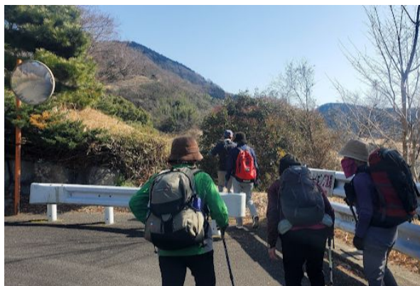
クラブハウスを避けて