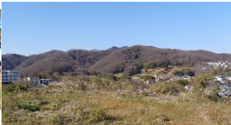
歩いてきた高取山～念仏山を振り返る