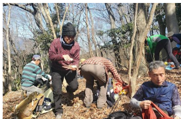
高取山山頂手前で暖かい日差しを浴びてお弁当タイム