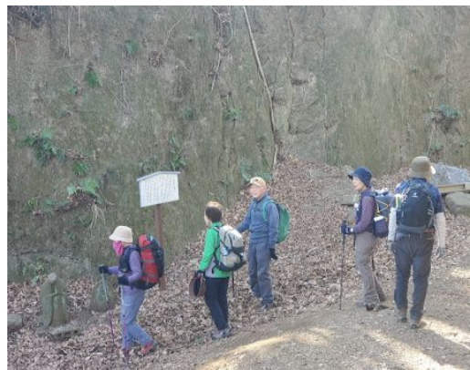
矢倉沢往還道善波峠