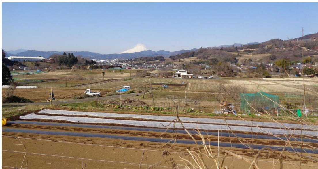
東京 CC ゴルフ場クラブハウスを目指して高度を上げて行く