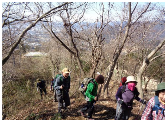
本格的な登山道を一步ずつ