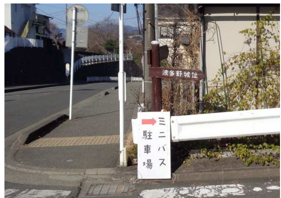
波多野城址は金目川沿いの周囲が畑地の丘陵地にある