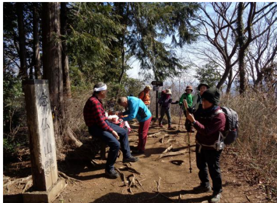
念仏山で一息ついて