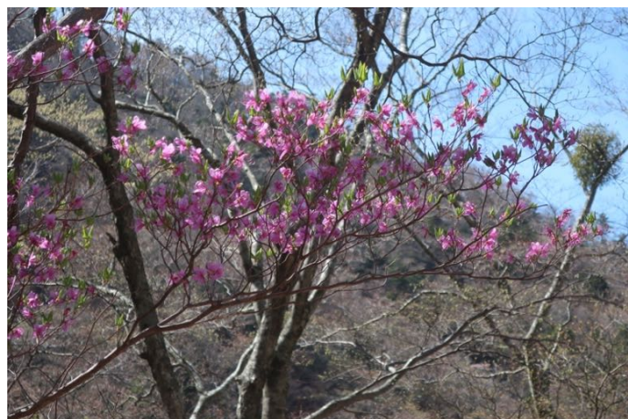
ほぼ降り切る直前で ミツバツツジが疲れた心を癒してくれた