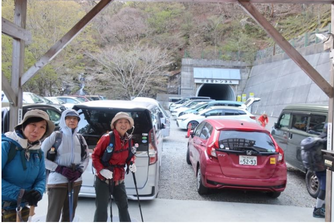
行者還トンネル西口駐車場を出発 第1駐車場は満車で第2駐車場の1番だった