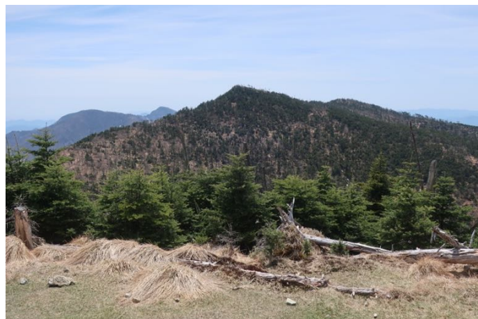
さっき行ってきた八経ヶ岳に別れを告げて 下山開始