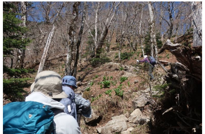
弥山への急登に入る