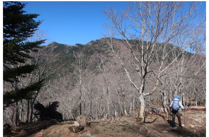
弥山（中央）と八経ヶ岳（左奥）が見えた