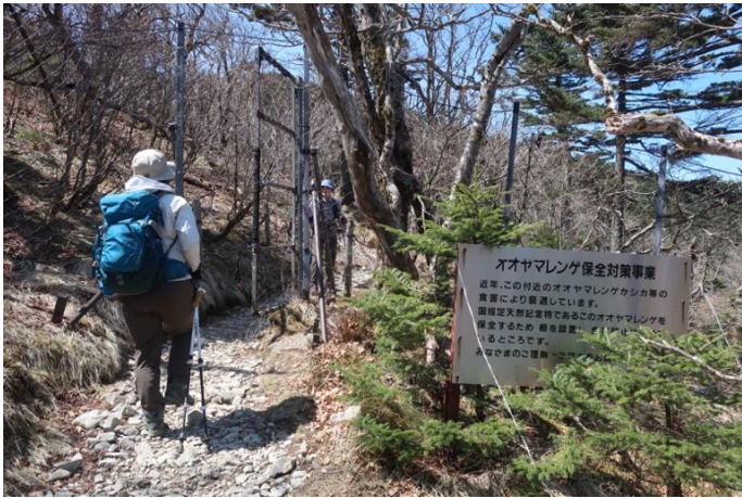
オオヤマレンゲ（天然記念物）保全の鹿柵 開花時期は7月初旬だそうだ