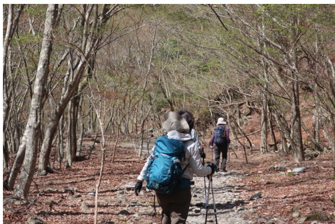
ようやく川沿いの平らな道に降り立つ