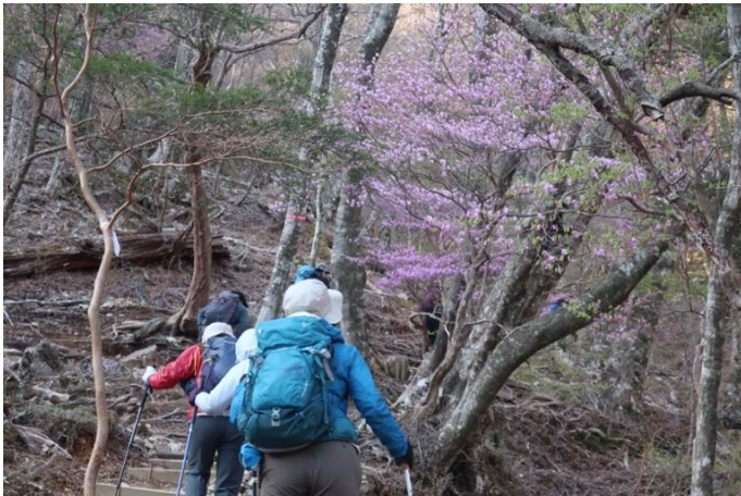
川沿いの道をしばらく行くと急登の開始 綺麗なミツバツツジの花が迎えてくれた