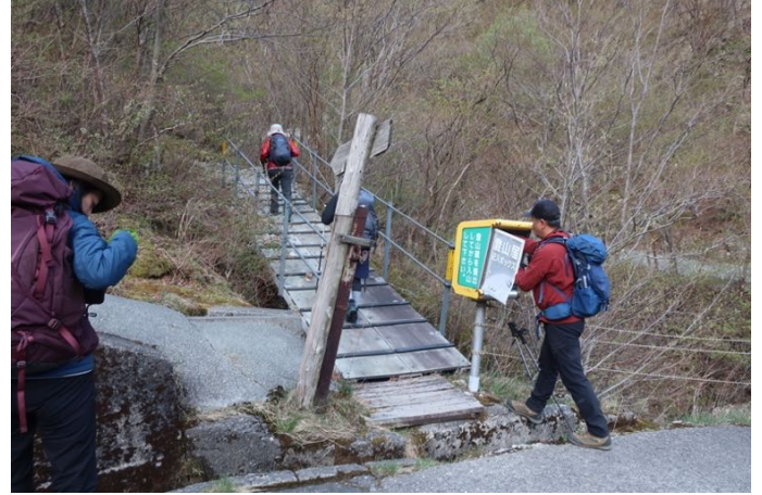
登山口から入山 登山届はCOMPASで事前提出済み