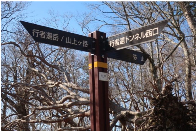
行者還岳や女人禁制の山上ヶ岳とは反対の弥山方面へ行く