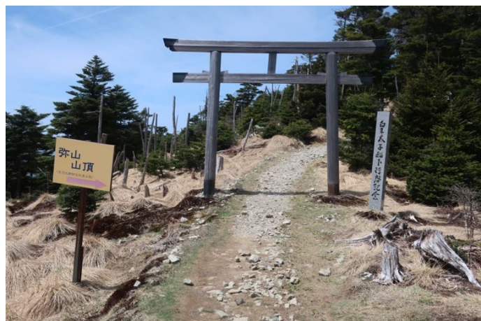
弥山へ戻って、昼食休憩を取り弥山山頂へ 皇太子殿下行啓記念の碑がある