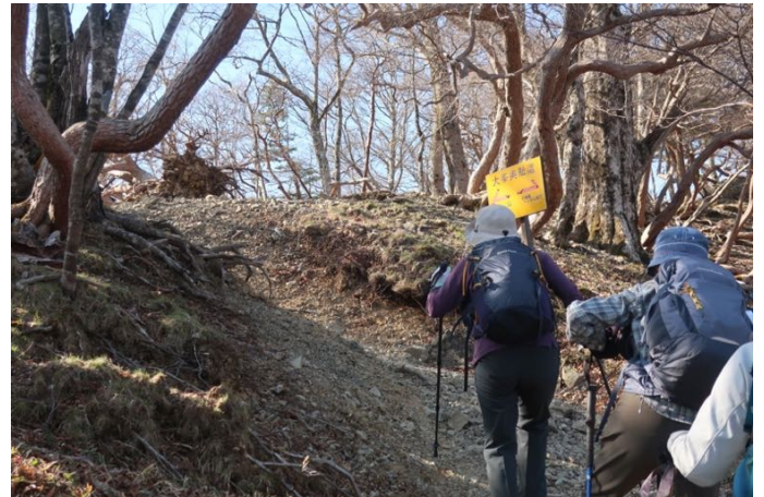
尾根まであと一息！ 尾根道は「大峰奥駈道」の縦走路