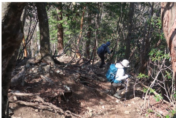
下山は順調に降るも、 「まだ降るの?」「こんなに登ったっけ?」 という声上がるくらい、ひたすら降る