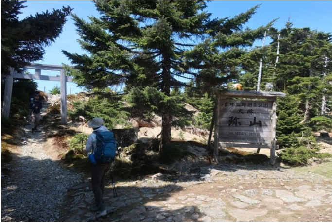
弥山 山頂はこの奥（後で行く）