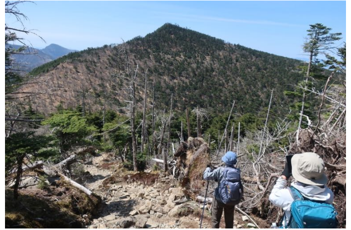
目指す八経ヶ岳 標高差で70m 降って、110m 登り返す