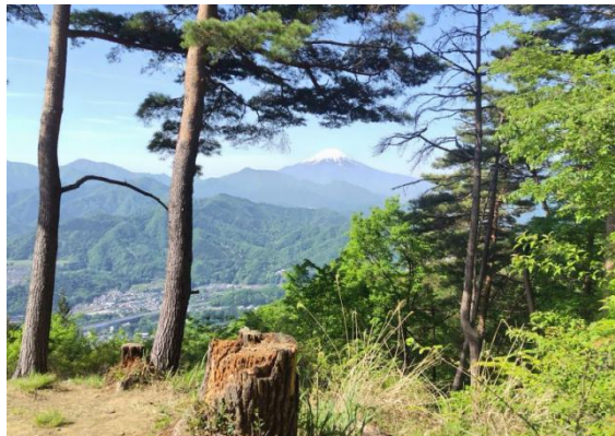
見晴らし台からのロケーション