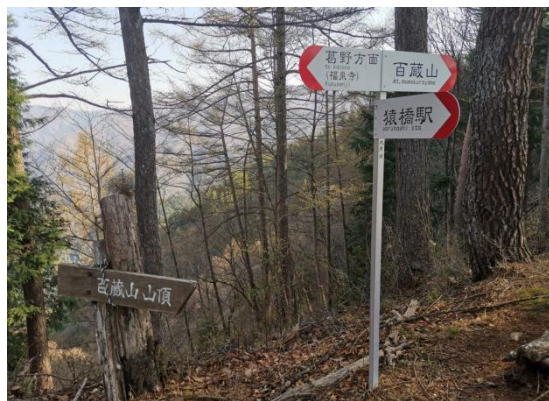
猿橋駅分岐から数分で大同山

樹木が茂っていないので明るい尾根道だが ロープが結構ある急登で、登ってくるハイカーは苦勞していた