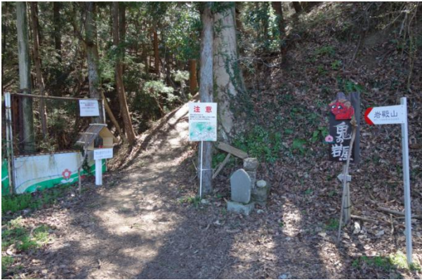
鬼の岩屋に立ち寄る

葛野川を渡り舗装路を岩殿山へ向かって行くと、岩殿コースの先まで行ってしまい引き返して 30 分ロス タイム発生。 畑倉登山口に 12:35 着