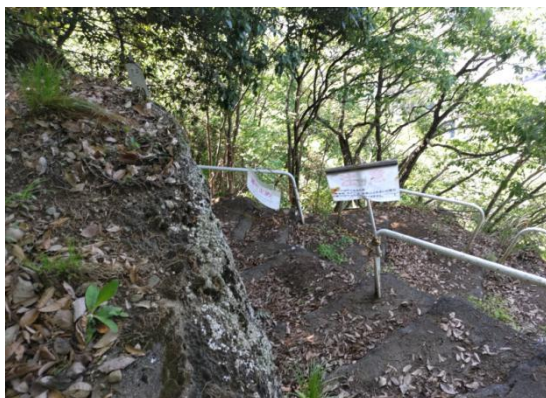
強瀬コースは 通行止め