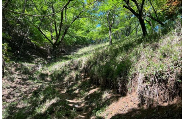
岩殿山頂にもハイカーは少なかった