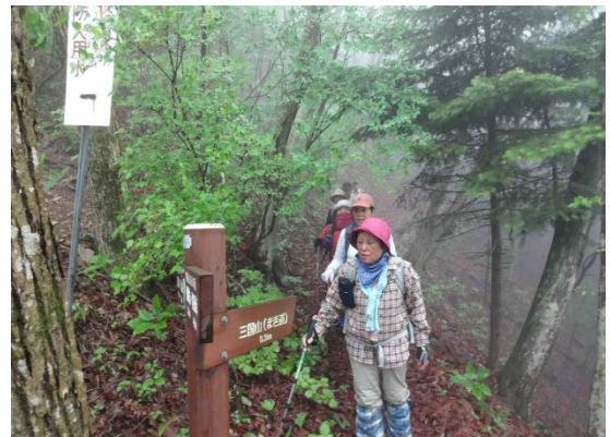
生藤山へ岩場の急登を登って行くが、時間的な制約で双耳峰の東峰(丸山)で生藤山を登頂したことにする