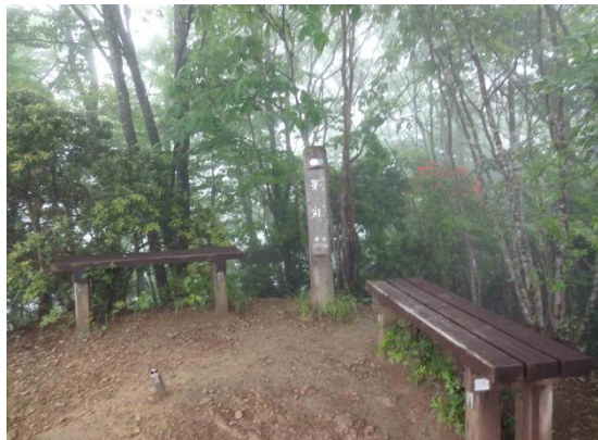
生藤山巻き道とはピークは通らず巻いて行くルートを表示