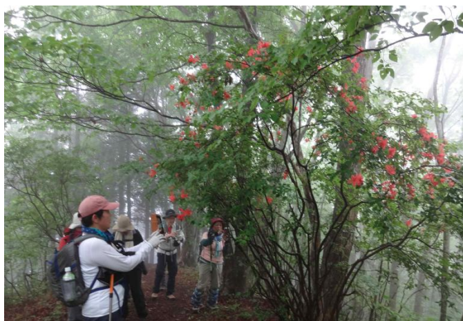
いよいよアップダウンを繰り返しながら南へ縦走開始