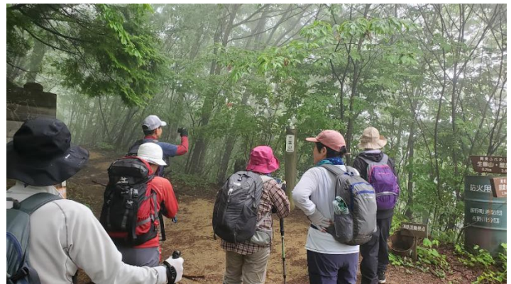
生藤山へ登るところうっかり安易に巻き道を行ってしまい