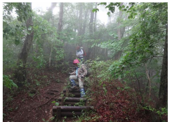
最後のピーク連行山 1016m