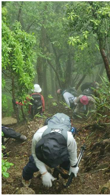
がむしゃらに登ったが降りにはそうはいかない、慎重に