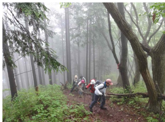
標高差 500m を 90 分で登りきり熊倉山山頂へ 966m