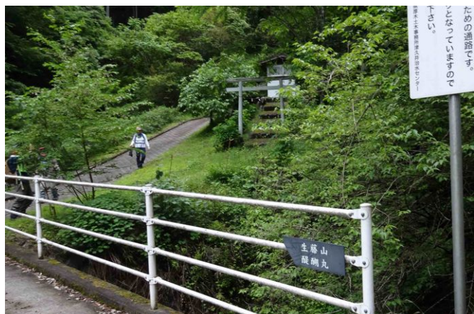
和田バス停に無事到着