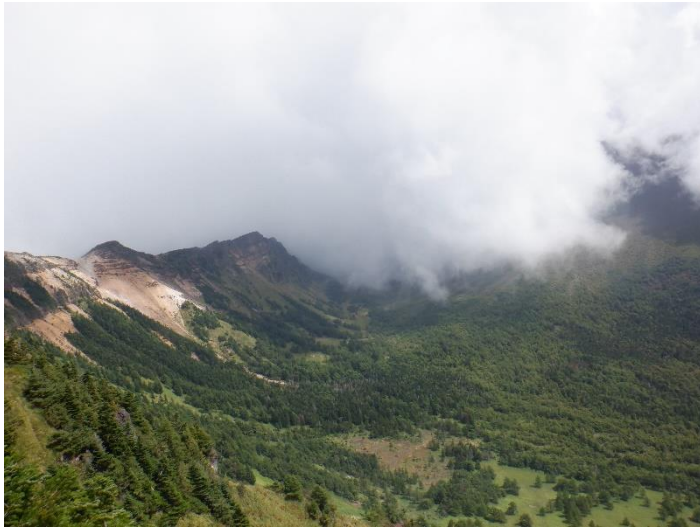
蛇骨岳山頂からの雲の切れた浅間山