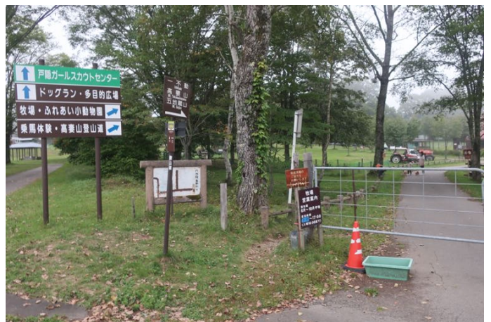
戸隠牧場の登山口入り口に無事到着 バス停まではあと10分 17:13 発バスで長野駅へ帰りました