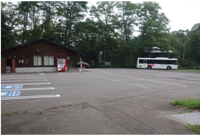
戸隠キャンプ場バス停から登山開始 気温 26℃、湿度が異様に高い

素晴らしい展望で知られる戸隠連峰最高峰の高妻山であるが、あいにくこの日は雲の中。猛烈な湿度の中、汗だくで登ってきた。長野駅前に前日泊し、朝一番のアルピコ交通バスで戸隠キャンプ場へ。