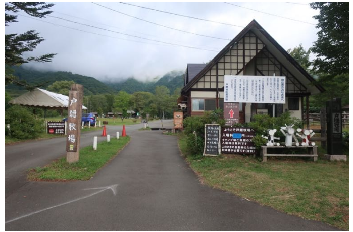
グランピングなど楽しそうなキャンプ場 を通り抜け、戸隠牧場に入る 牛や馬が沢山いる