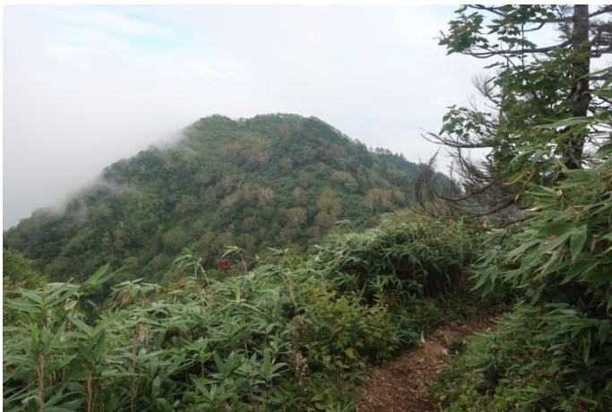
八観音を過ぎると、ようやく少し雲が晴れて 隣の五地藏山が見えた