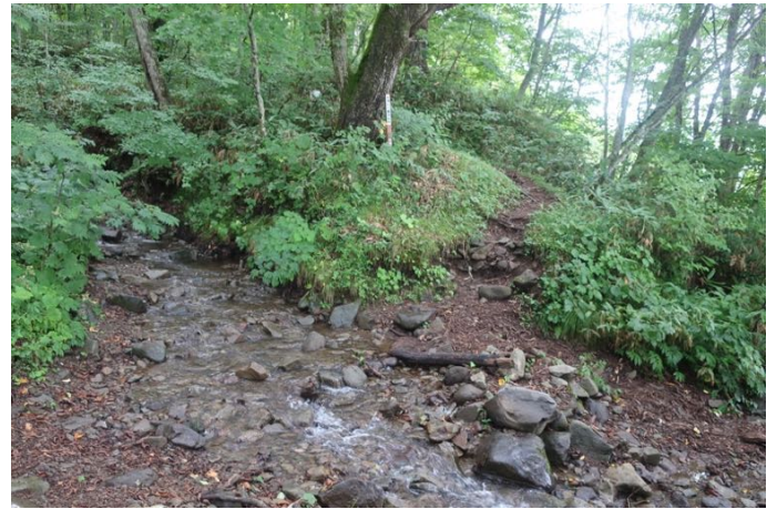
すぐに2つ目の渡渉箇所がある