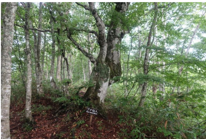
ブナ仙人 この辺りから登山道も急になってく るとにかく蒸して暑い 汗だく