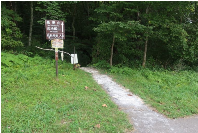
のどかな牧場を通り抜け、 いよいよ山道に入る