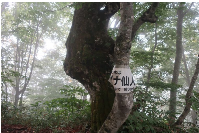
ようやくブナ仙人に到着 牧場まで30分と書いてある 当初計画より1本早い、17時台のバスに乗れそう