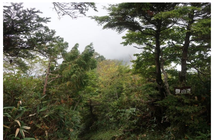
この先に山頂方面の山々が見えるはずなのだが… 心眼で見るしかない