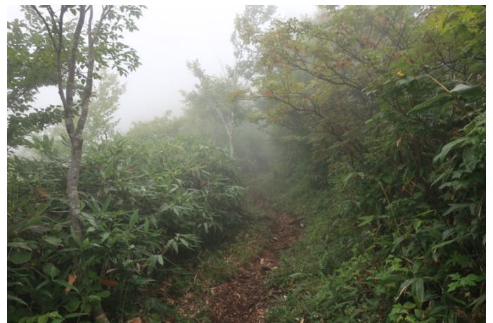
山全体が雲の中で展望も何もない 急登だが特にすごい危険箇所は無し 鎖場2箇所、ロープ2箇所有り