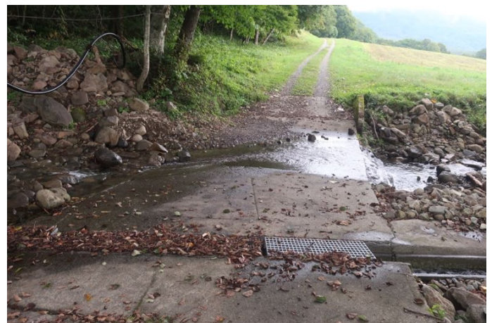
渡渉が2箇所ある 帰りに登山靴をここで洗える