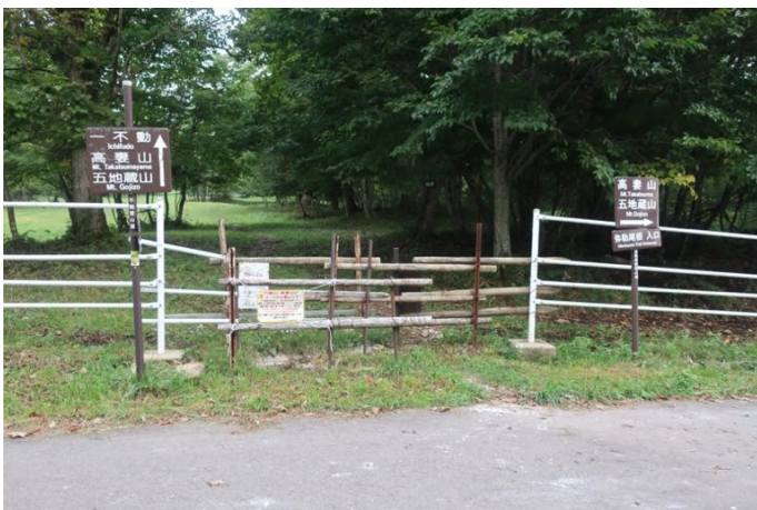
一般的な登り道、大洞沢コースの入り口 今日は時間短縮のためここを通り過ぎ、 登り・下りとも弥勒尾根新道を使用する