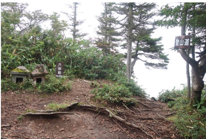
ようやく五地藏山の六弥勒に到着 大洞沢コースからの尾根道と合流 標高約 2,000m で気温は 16℃に下がったが とにかく湿度が高くて汗がでる