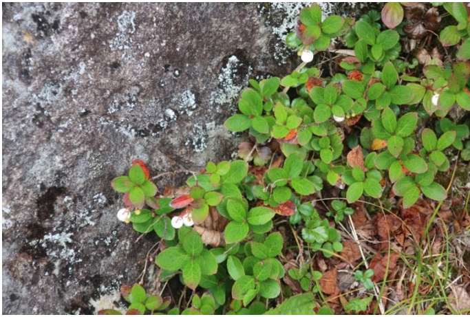
下りは少し余裕もできてお花の写真も撮る シラタマノキ