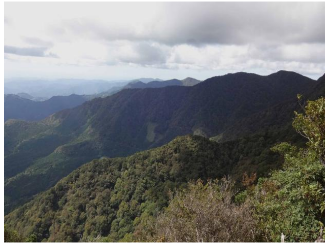
最高峰の万三郎岳が見えている