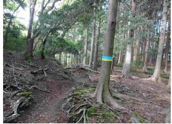
歩き始めてトリカブトの群落、リンドウが見られた