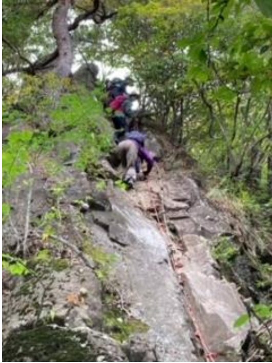
下山してすぐに岩場をロープでの下り（スリル満点です）