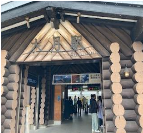
閑散とした大月駅

降りみ降らずみの陰鬱な空模様のなか、標高976Mの低山ながら急登の岩場と崖直下のロープワークをヒヤヒヤしながら楽しむことができました。