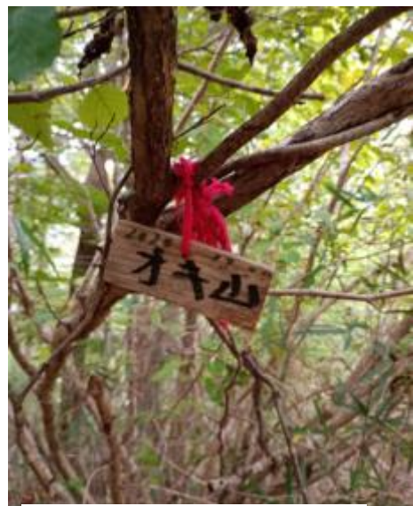
むすび山の次がオキ山です