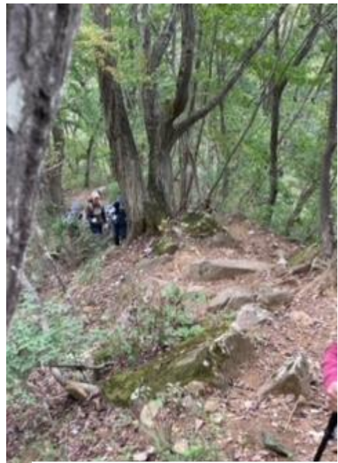
辟易するほどの岩場の登り