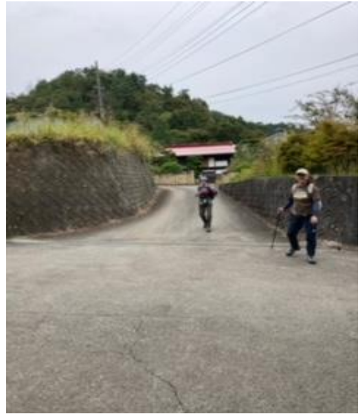
富士急禾生駅 お疲れ様でした