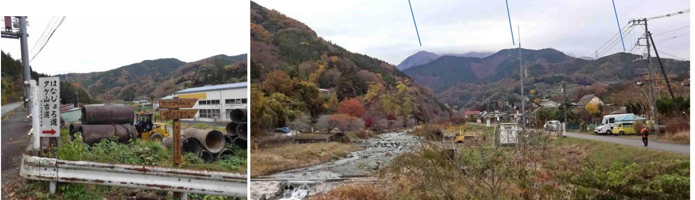
虫沢集落を抜けて 正面にタケ山

虫沢古道を守る会によって最近ひらかれたタケ山ルート 日影山 高松山からの尾根 タケ山