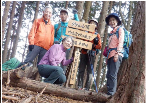
タケ山ピークは杉林の中