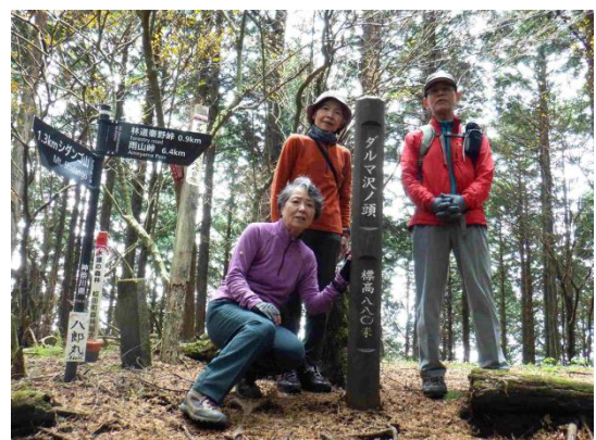
展望のないダルマ沢ノ頭