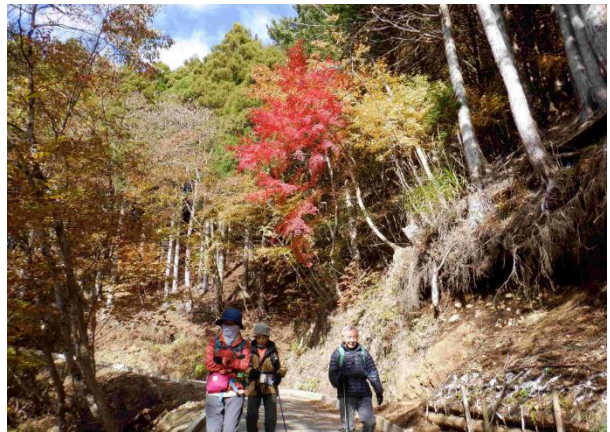
見落とししそうな平坦地にあるタコチバ山標識を見つけて