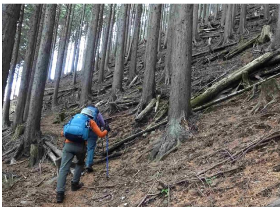
230mの急登をこなして