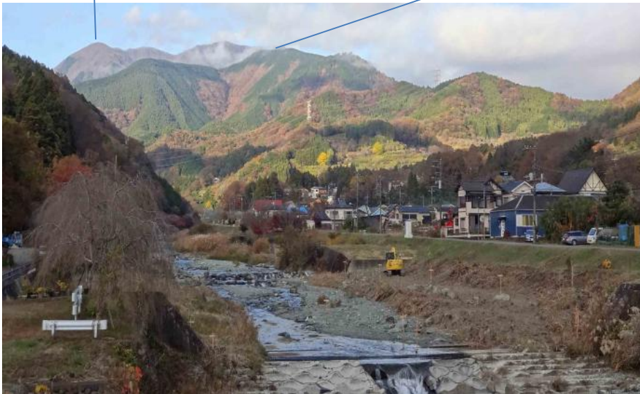
無事に田代向バス停着