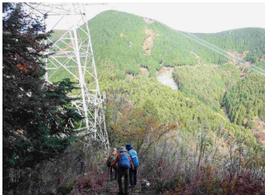
林道へ向かって降りて行き、正面ピークのダルマ沢ノ頭へ