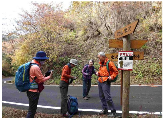
ここでシダング山直行チームと別れる