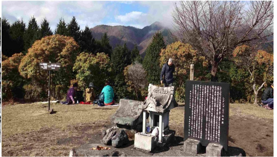
閑散としていたシダンゴ山山頂