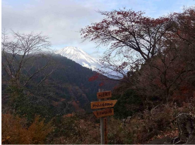
神々しく富士山が見えていた