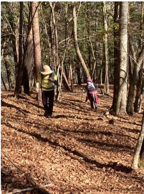
枯れ葉でふかふか