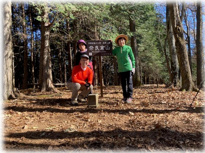
奈良倉山での記念撮影