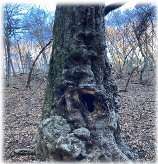
これがトチの巨木