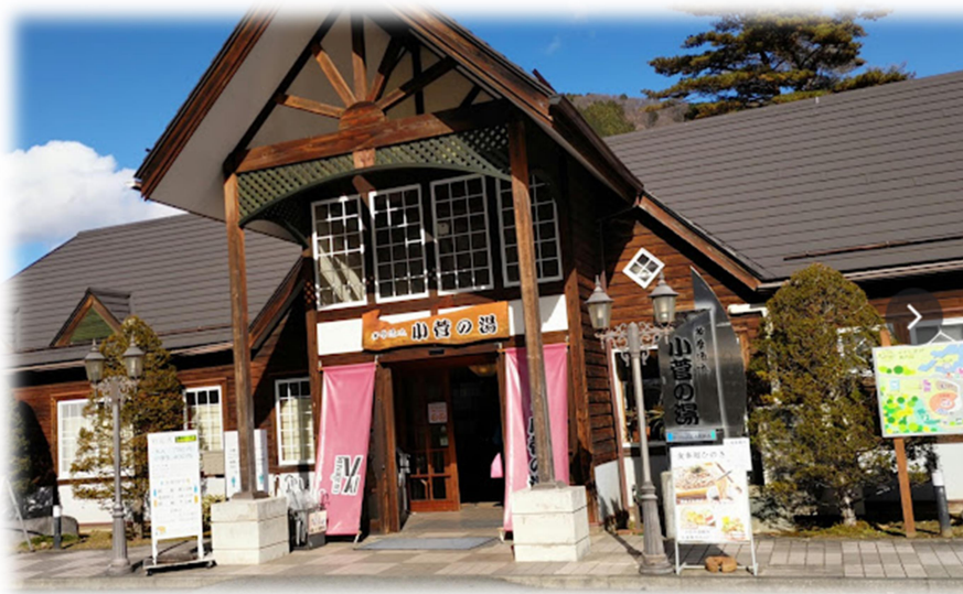
お疲れ様でした、アルカリ性温泉で有名な小菅の湯