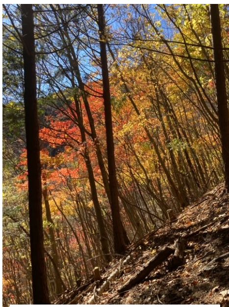
肉眼だと紅葉はもっと綺麗