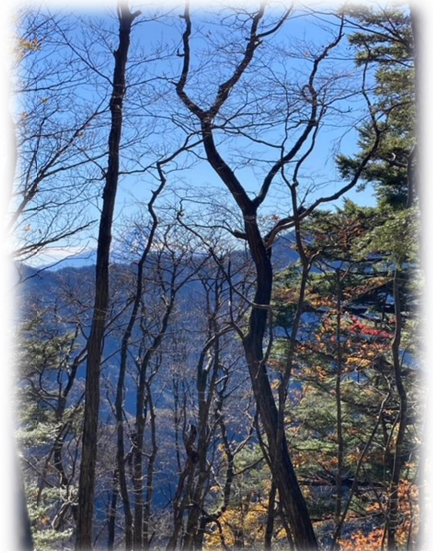
紅葉の木々の間から富士山