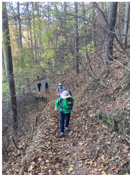
歩き出しはフラットです