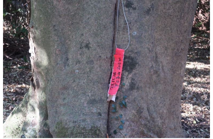
下二子山山頂にあった札 ネット情報では標高 206m となっているのですが・・・