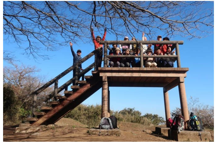
山頂展望台で記念写真 標高 207.8m