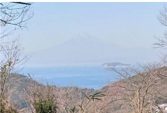
ようやく阿部倉山山頂に着きました 山頂付近のサクラテラスからは 江ノ島の浮かぶ相模湾と富士山が見えました