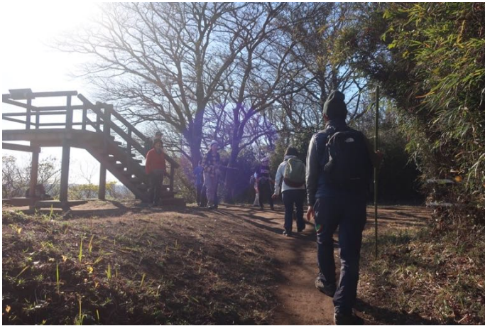
二子山山頂に到着しました 展望台があります