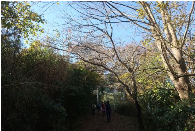
KDDの電波塔が見えました もうすぐ山頂です