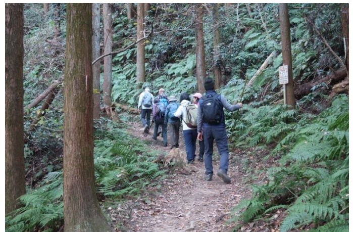
だいぶ登ってきました