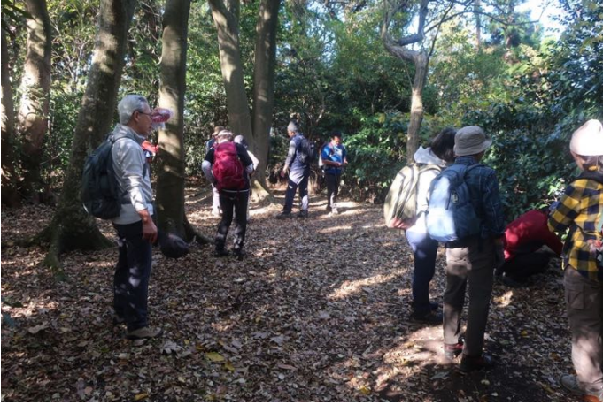
下ノ山（下二子山）山頂に到着しました 二子山（上二子山）と双耳峰です