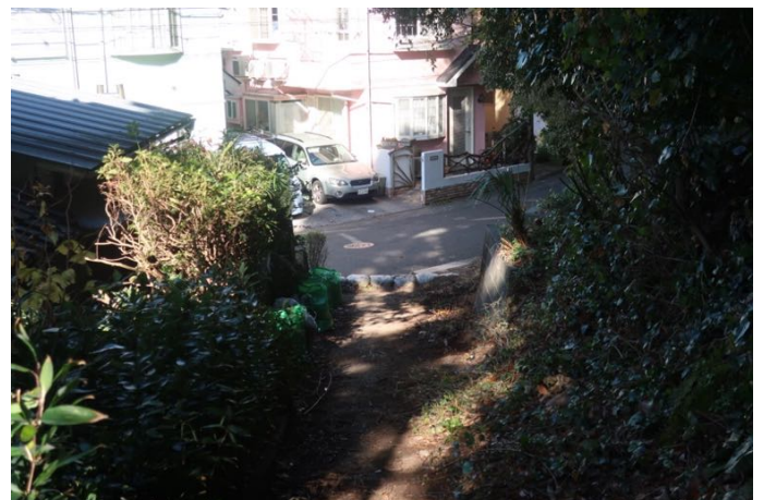
阿部倉山登山口に予定通り順調に下山しました