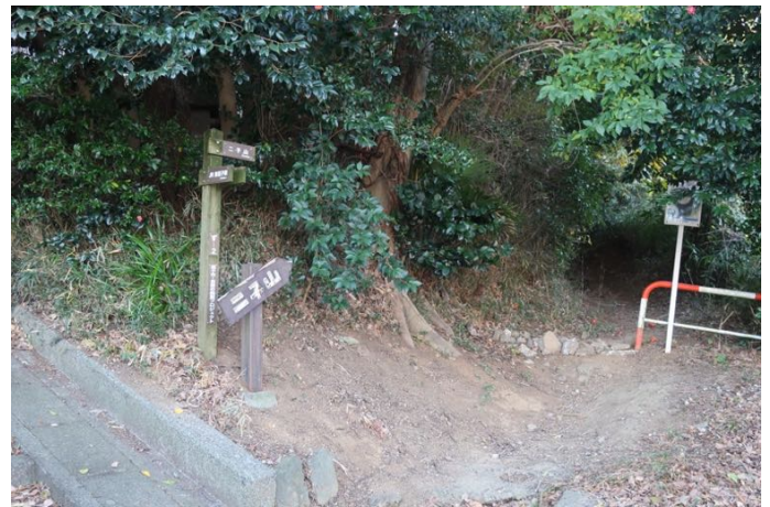
二子山登山口です