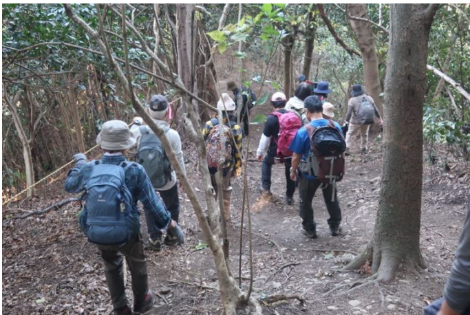
阿部倉山へ向けて出発します いきなり急坂を下ります