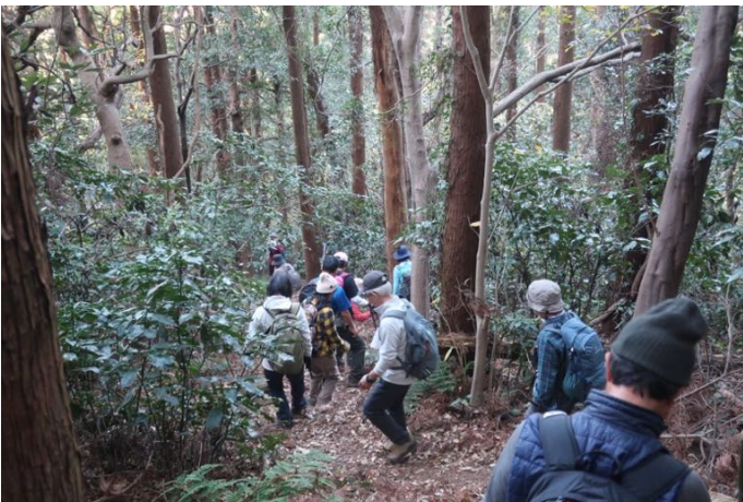
阿部倉山へ向けて縦走 また下ります