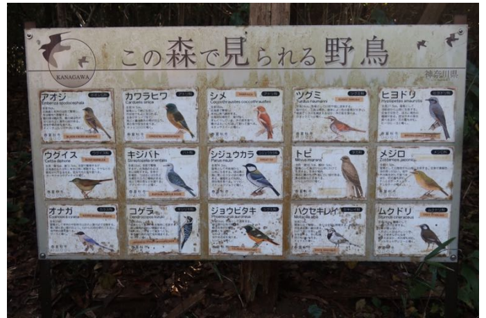
野鳥の説明パネルがありました たくさんの鳥が来ているのですね