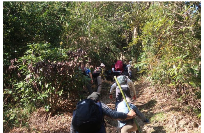
登り返しも結構きついです