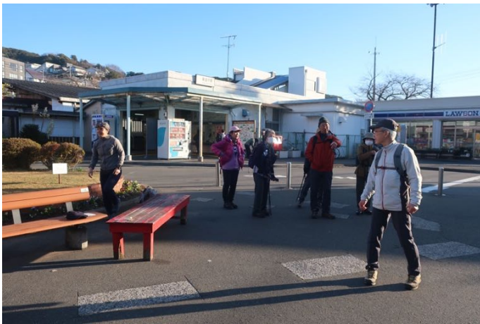
JR 東逗子駅に集合しました

横浜わらび山の会の 2023 年忘年山行は、昨年と同じ二子山～阿部倉山のミニ縦走コースです。JR 東逗子駅前に 8 時に集合して出発しました。本日は快晴、気温は 16℃と、12 月としてはかなり暖かい小春日和です。