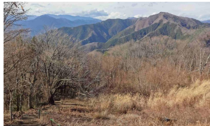
緩やかに一ノ尾尾根を下ってゆく