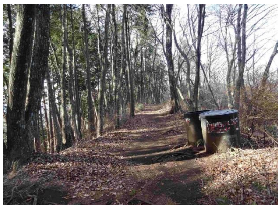
明るく歩きやすい縦走路