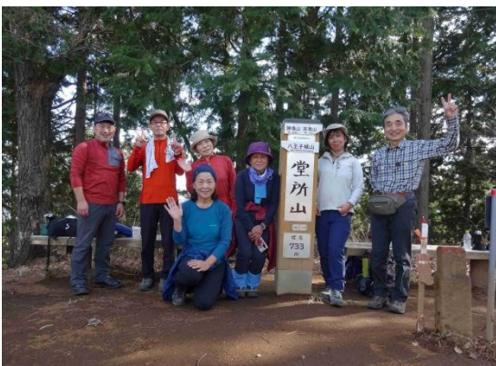
堂所山でランチタイム