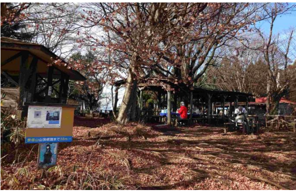
広い山頂の景信山につく