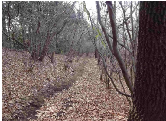
手入れが行き届いており歩きやすい