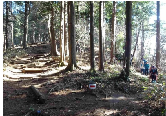
体力温存のため、できるだけピークを避けて巻き道を行く