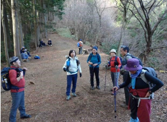
高尾から陣馬山の縦走路に出る