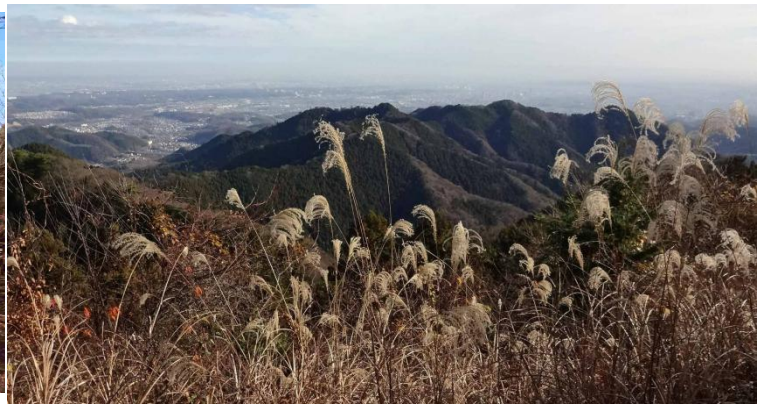
都心方向に高尾山が