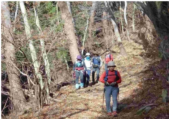
一ノ尾尾根は陣馬山へのメイン登山道であるのが分かった