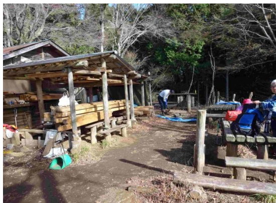
明王峠で一休み、茶屋はリフォーム中、相模湖駅への最短ルート分岐