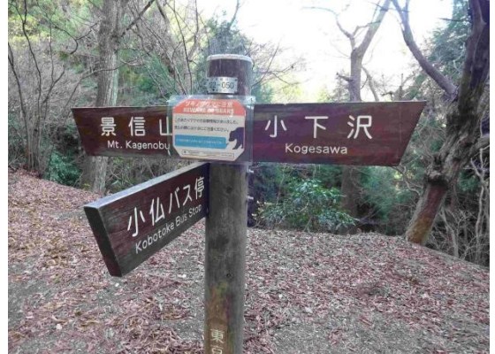
クマ出没の標識があった