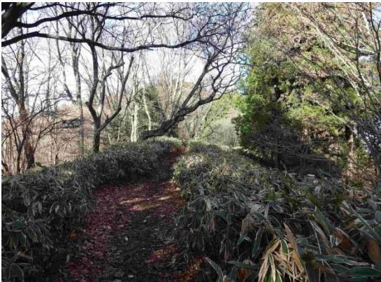
三頭山からつづくまさに笹尾根だ