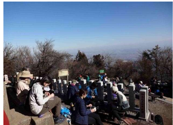
山頂は多くのハイカーで賑わっていた