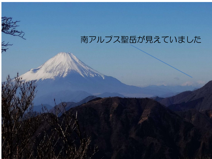
南アルプス聖岳が見えていました