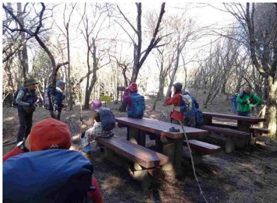
予定時刻にベンチに着いたが①チームは先へ