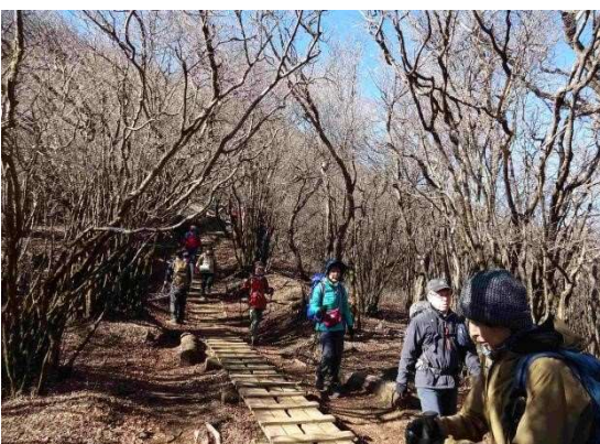
ゆっくり休んで見晴らし台へ