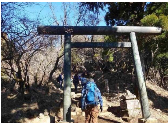
鳥居から大山山頂お鉢めぐりコースで