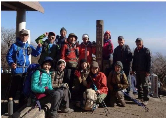
おかしい 1名写っていない