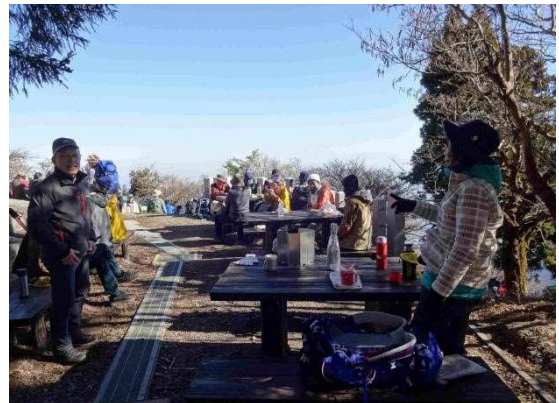
お待ち同様①チームと合流しました