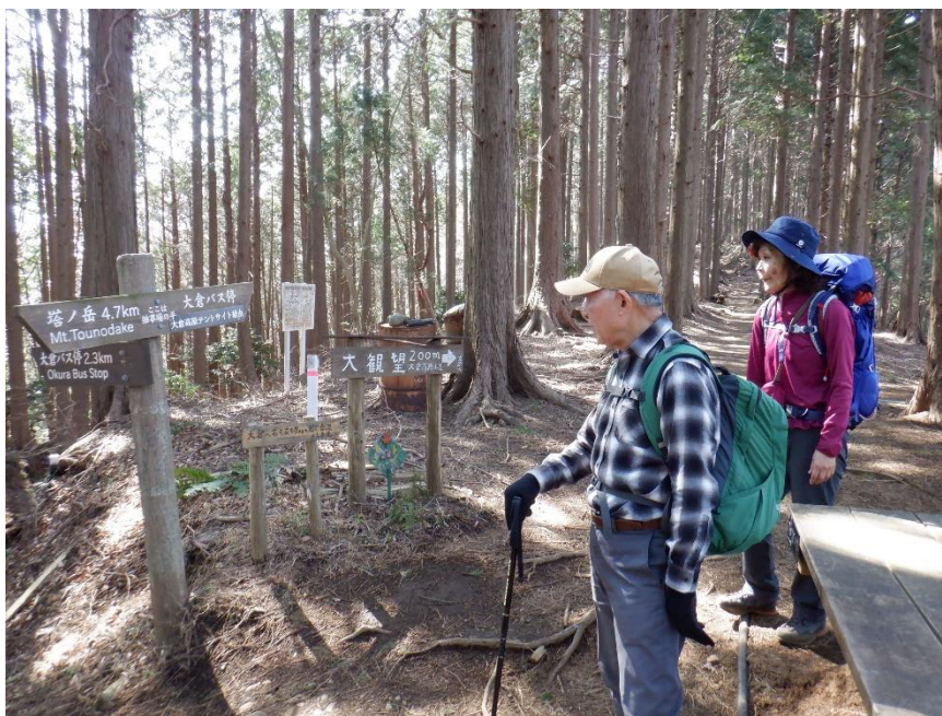
大倉から2.3キロ歩いてやっと大観望ルートとの合流点