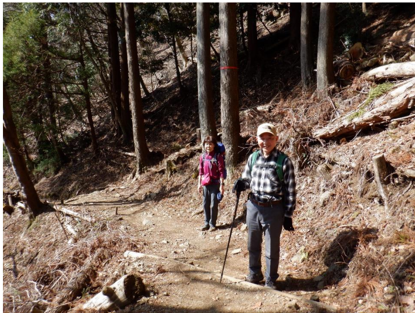
まだまだ、元気です