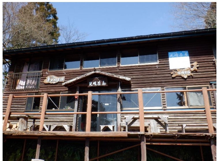
見晴茶屋でも一休み