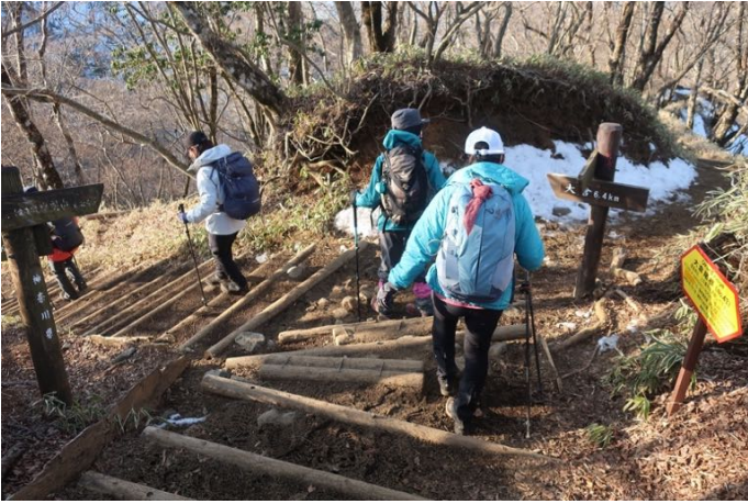
金冷し 大倉尾根の雪はほとんど解けて 登山路は乾いていました