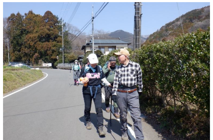
大倉に到着しました (直売の果物を買っている人も・・・) 長い集中山行、無事終わることが出来ました 以上