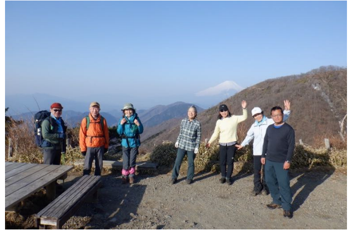
花立山荘前で富士山をバックにパチリ