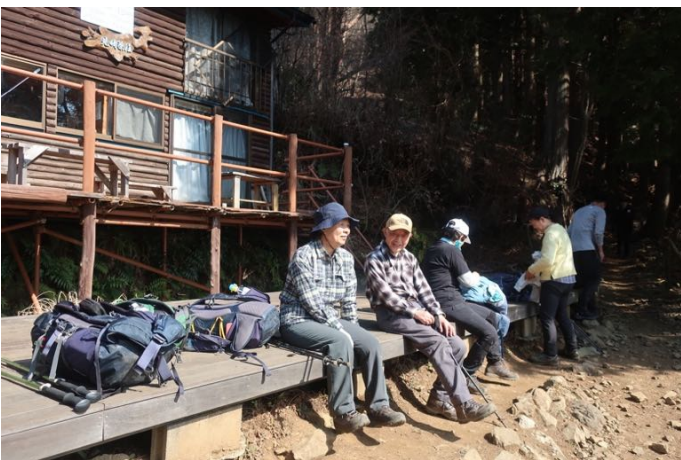
見晴茶屋に到着し、ホッと一息 やっと急坂が終わりました