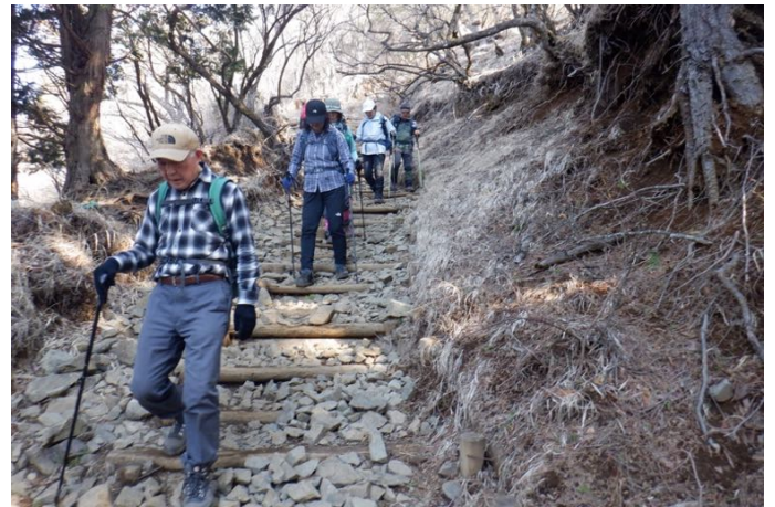
ひたすら階段を下ります 膝に堪えますね