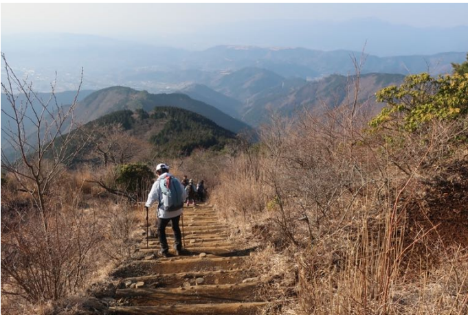
花立から下る豪快な展望