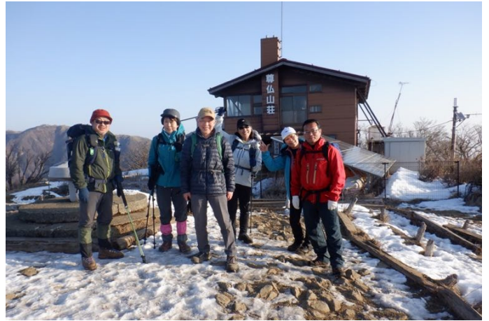
大倉尾根下山チーム、出発