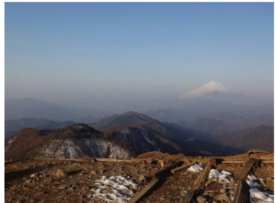
朝日を浴びた富士山