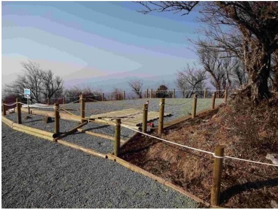
新大日（札掛への長尾尾根コース分岐）