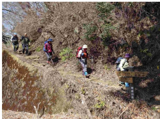
表丹沢林道へ一旦降り立つが、まだ尾根歩きがつづく