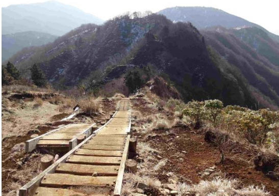
いよいよ表尾根の核心部へ