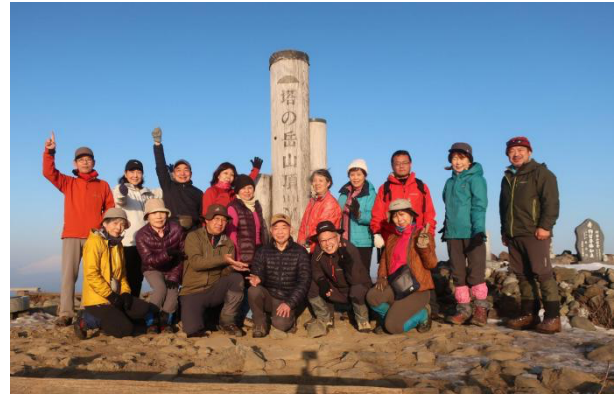
翌日の下山路は 3 コースに分かれて大倉へ