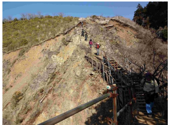
山は生きている証拠・崩落が止まらない