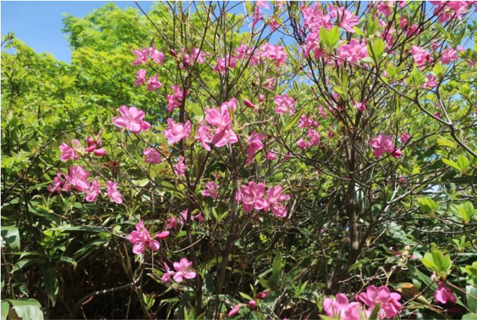
ムラサキヤシオが満開