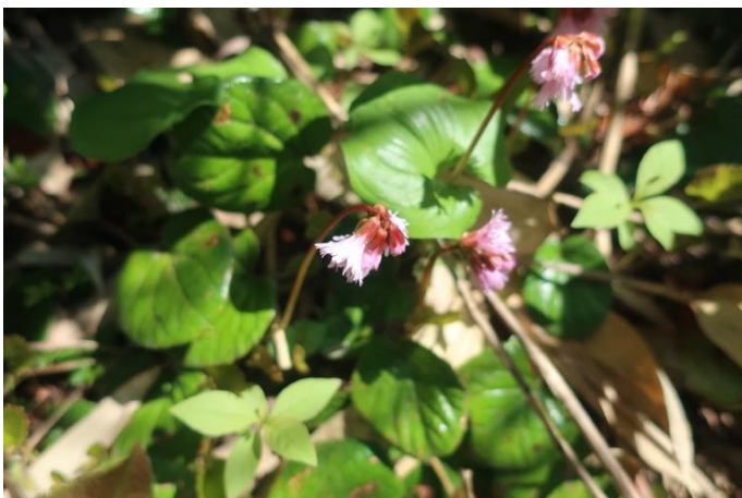
イワカガミがあちこちに咲いている