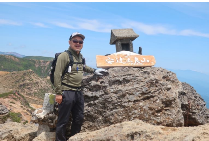
山頂に登りました