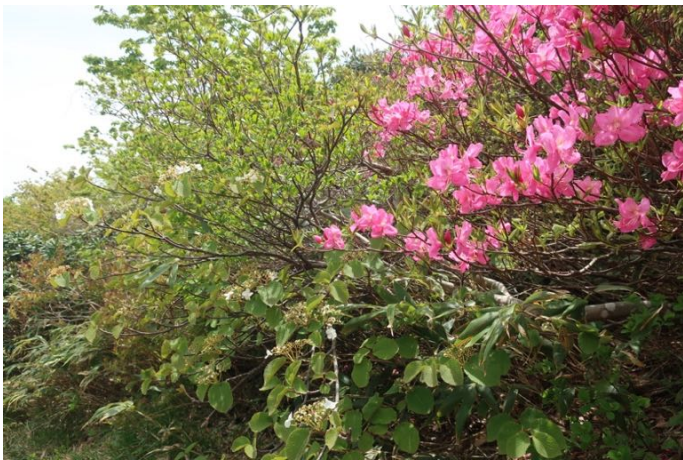
ゆっくり昼食を取って下りにかかります ムラサキヤシオやガクアジサイが満開の道です