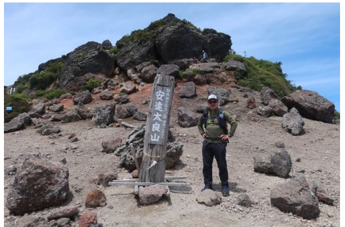
山頂直下に着きました 頂上部は乳首と呼ばれています