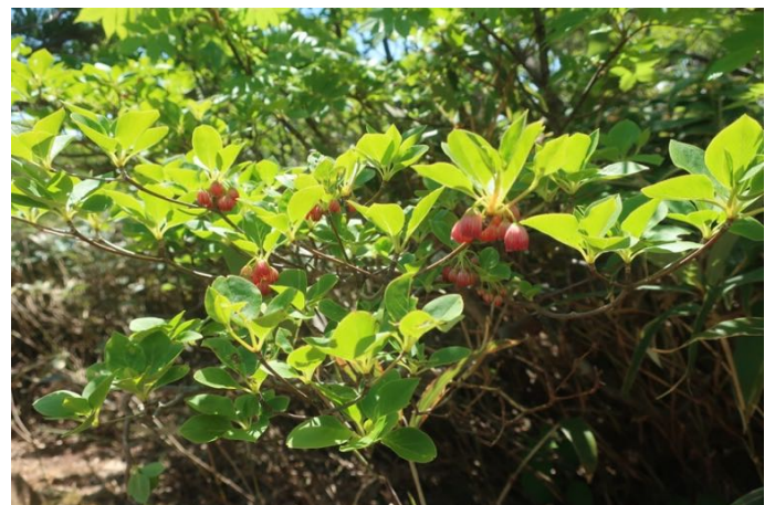
ベニサラサドウダン