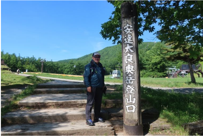
安達太良山ロープウェイ山麓駅前