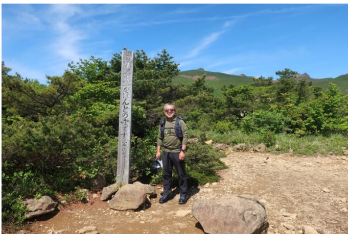
高村光太郎「智恵子抄」の一節の「ほんとの空」の碑 後ろに安達太良山の山頂が見える