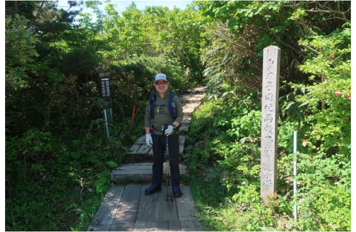
山頂駅前の登山道入口