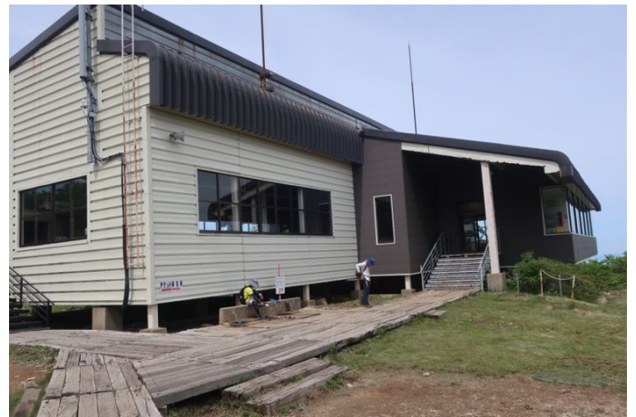
ロープウェイ山頂駅に着きました