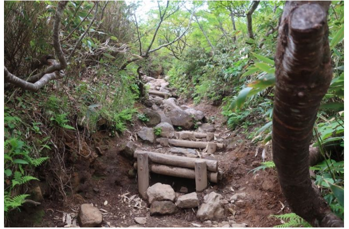
ここから急登で山頂を目指します