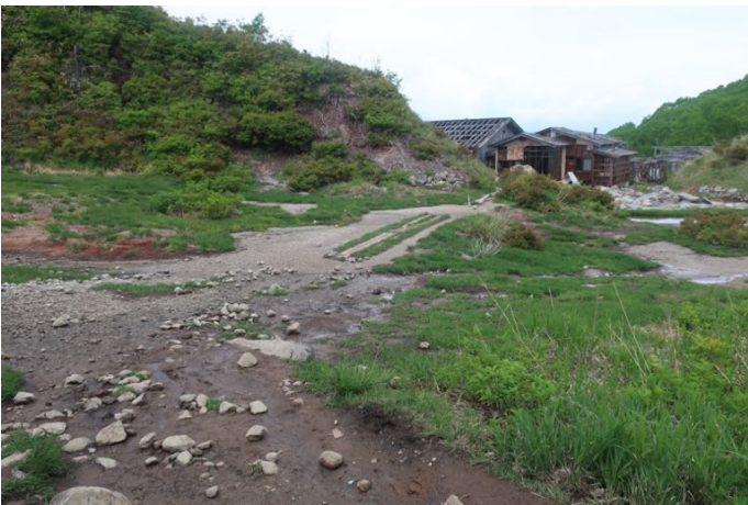
中の湯跡に戻って来ました