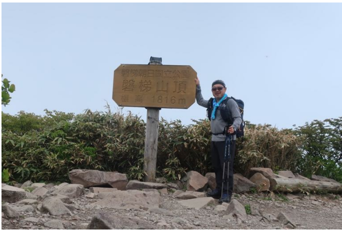
少し下がった所に山頂碑がありました