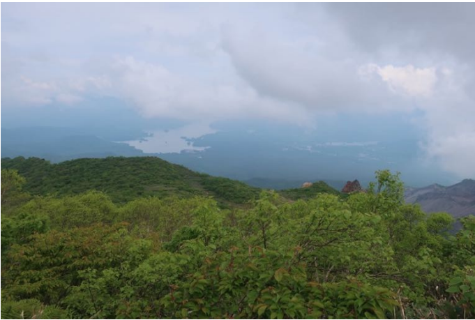
北に桧原湖が見えました