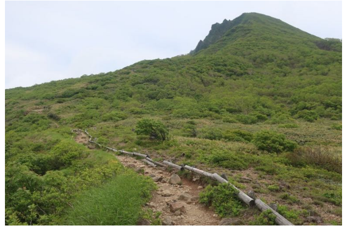
お花畑から山頂を振り返る