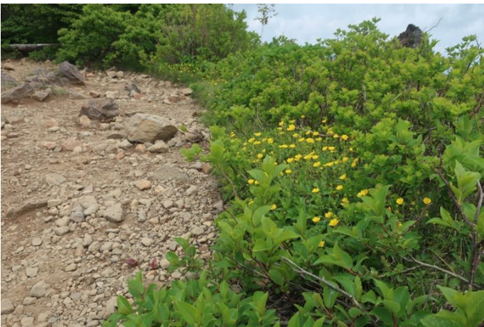
天狗岩の麓のお花畑 ミヤマキンバイの群生です