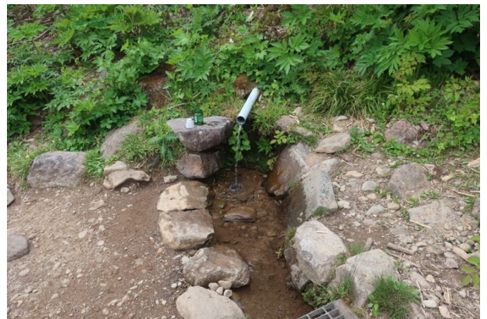
少し硫黄臭があるけど美味しい水です