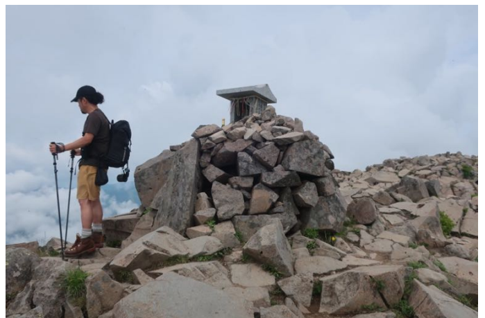
山頂に着きました 山頂にあるのは小さな祠だけです