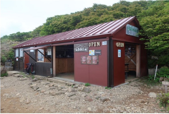
弘法清水小屋が開いています 売店と携帯トイレブースです