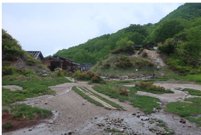
中の湯跡 建物は廃屋になっています