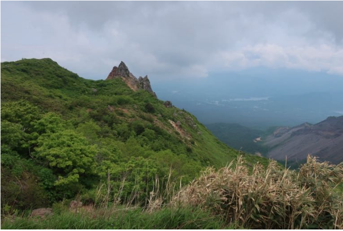
下りは天狗岩とお花畑方面を通ります