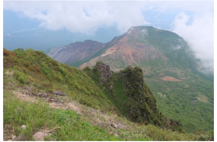
裏磐梯方面の景色