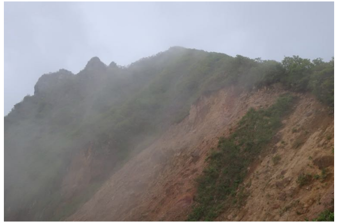
裏磐梯噴火跡の縁を通ります