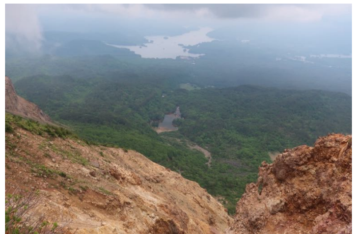
裏磐梯の爆裂口を見下ろしました 絶壁で怖いです 遠方に桧原湖が見えます