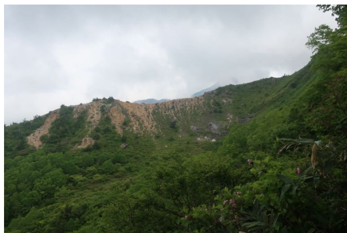
裏磐梯の噴火口跡が見えてきました 山頂はこの向こうです