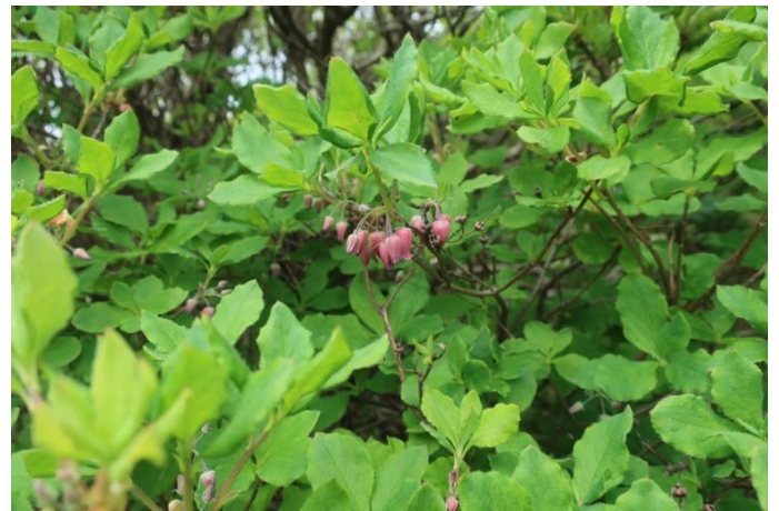
ウラジロヨウラク