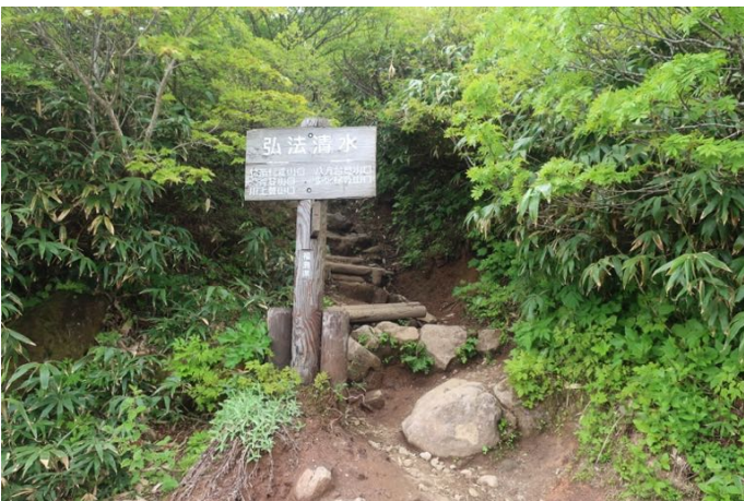
弘法清水に着きました