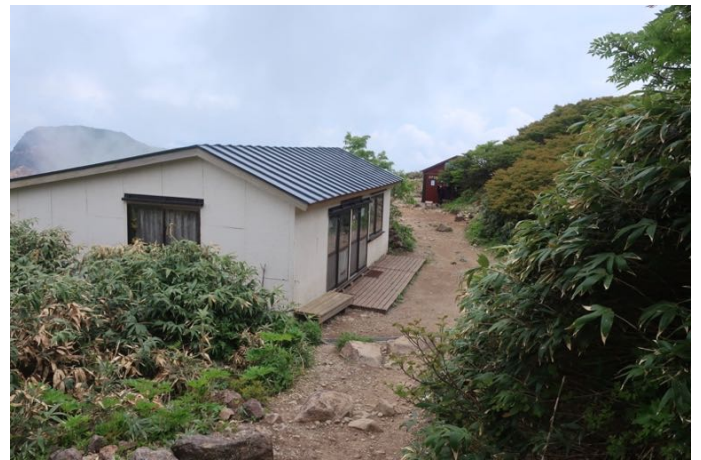
弘法清水に戻って来ました