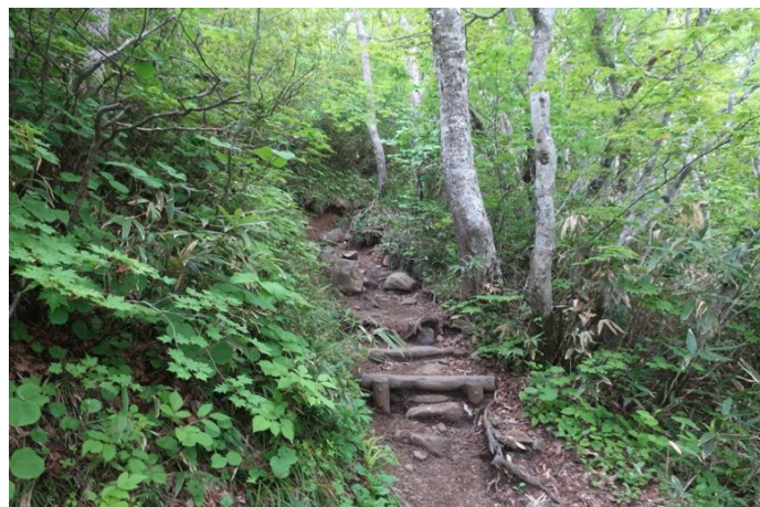
こんな道を登っていきます