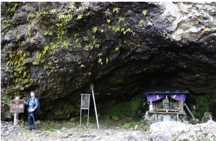
笹ノ窟と鷲ノ窟(右)