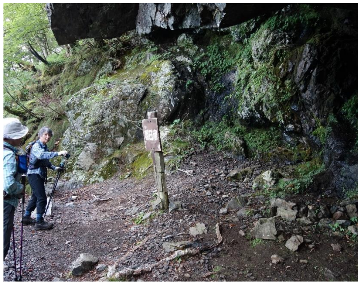
シタン(指弾)ノ窟(左)と朝日ノ窟