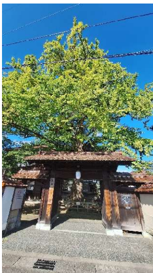
深田久弥 山の文化館