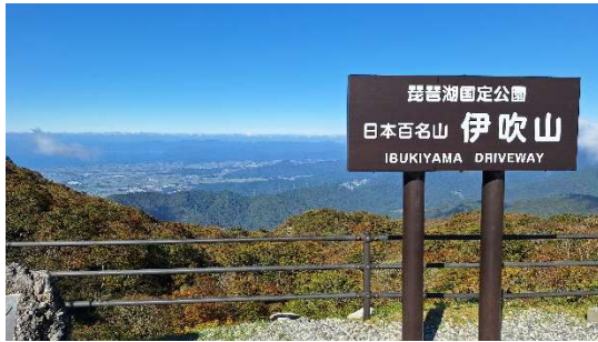
伊吹山ドライブウェイ駐車場