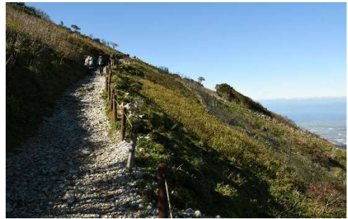
右側に鹿害による野原