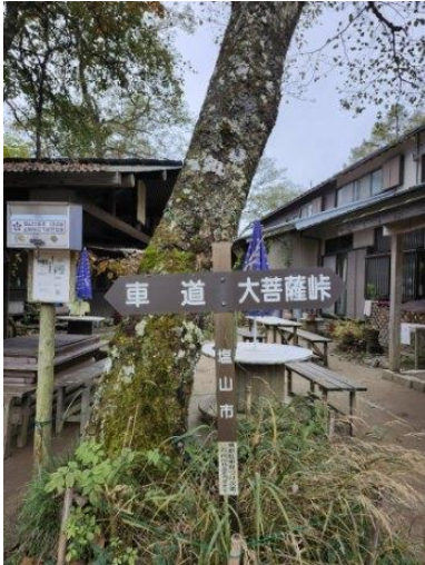
PM2 : 30 福ちゃん荘は閉店