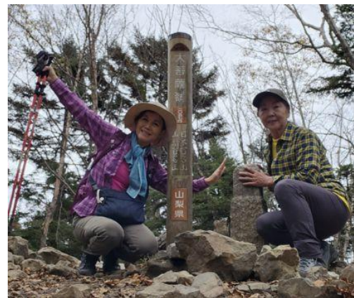
大菩薩嶺三角点 眺望無