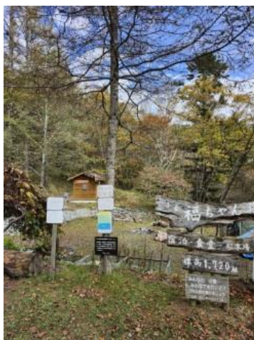
福ちゃん荘前トイレ