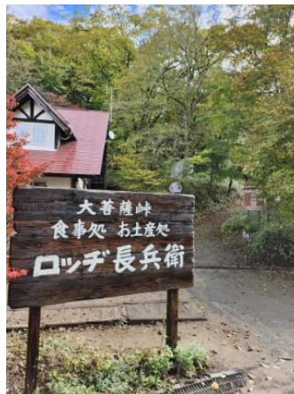
ロッジ長兵衛登山口