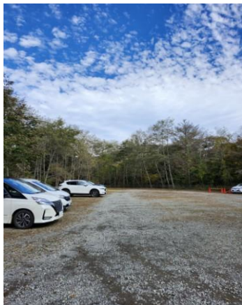
上白川峠第3駐車場

上日川峠駐車場—ロッジ長兵衛—福ちゃん荘—雷岩—大菩薩嶺—賽の河原—大菩薩峠—上白川峠登山口