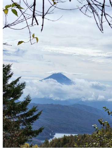
唐松尾根から富士山