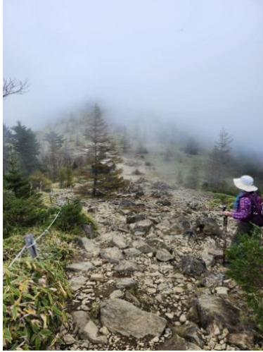
石ころだらけの稜線