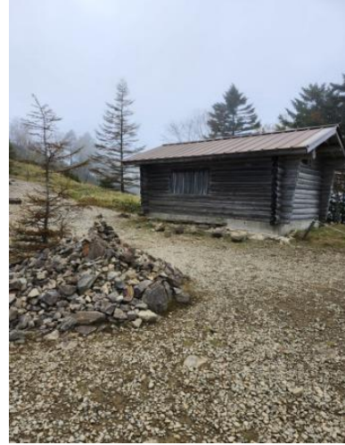
賽の河原避難小屋