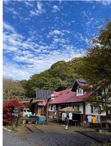
ロッジ長兵衛に戻りました