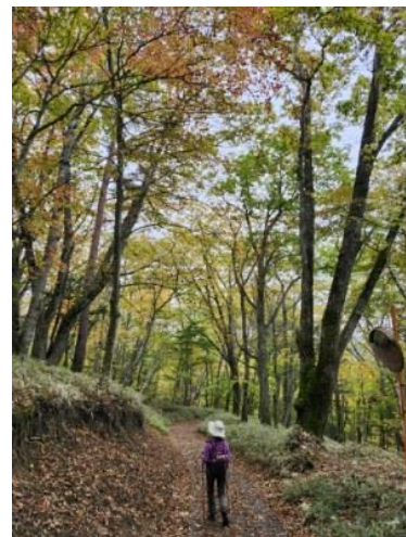
紅葉がきれいでした