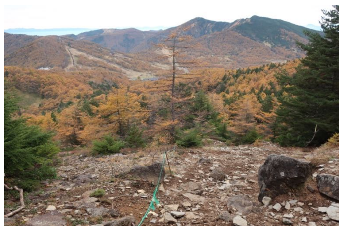
下りは樹林帯の中コースへ 駐車場が見えてきた 無事、下山