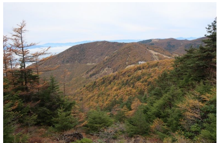
振り向くと車坂峠方面はきれいな紅葉