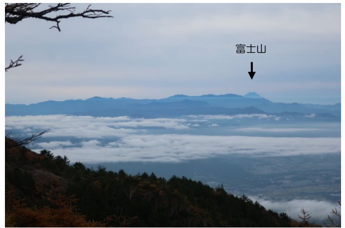
車坂山に上がると富士山が！