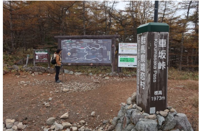
道路を挟んで向かい側に 車坂峠登山口がある