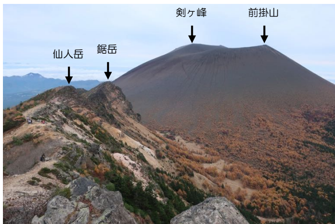
足元が地獄覗きのような岩場から 浅間山本体を見る