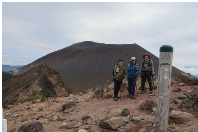
仙人岳に到着 標高 2,120m 本日はここまでにして引き返す