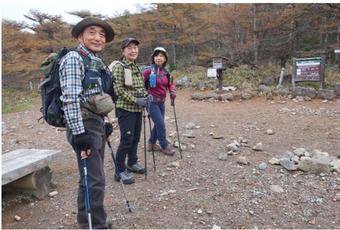
元気に、さあ出発！ 表コースに行く