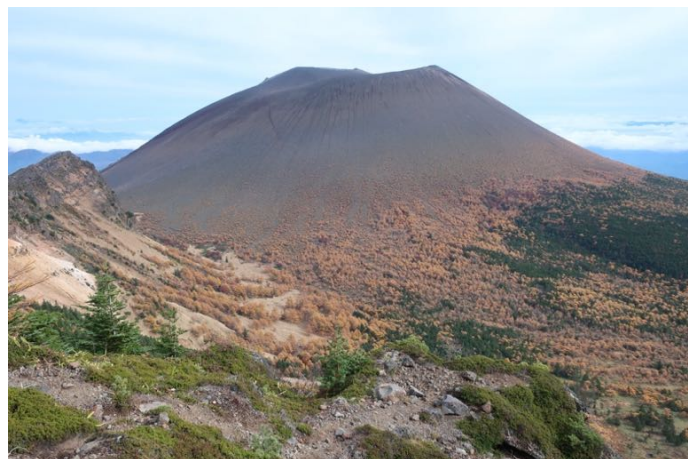
蛇骨岳辺りから見た浅間山