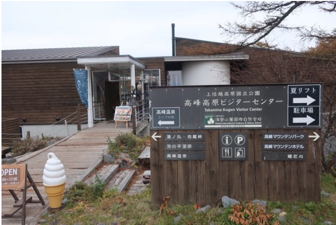
高峰高原ビジターセンター 下の大きな駐車場にレンタカーを停めた