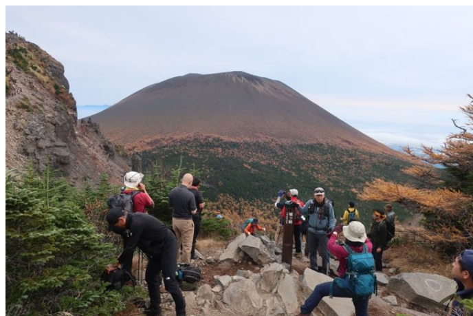
外輪山の稜線、槍ヶ岳に到着 浅間山の本体がドーンと登場