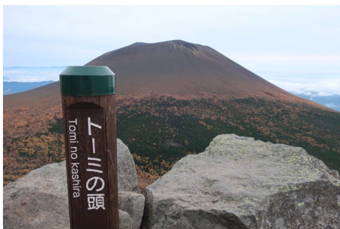
外輪山を北向きに周回 最初のピークのトミノの頭