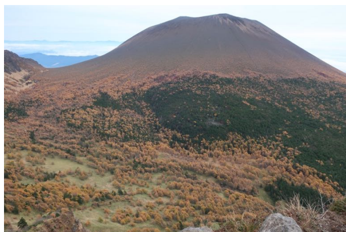
素晴らしい展望 カラマツの紅葉がきれい！