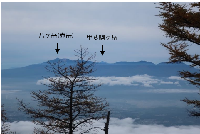
ハケ岳(赤岳など)や甲斐駒も！