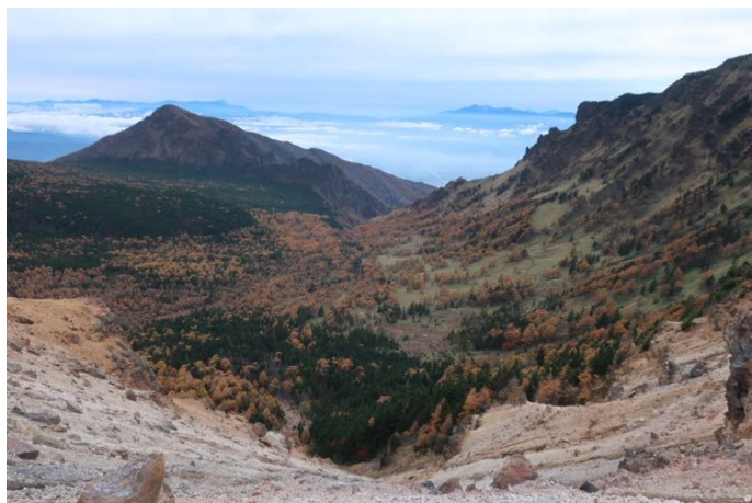
火山館方面（南方）の谷 素晴らしい笹原とカラマツの紅葉の風景