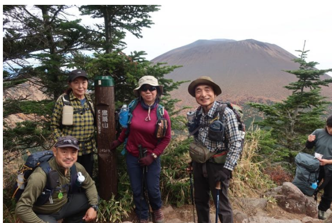
外輪山最高峰の黒斑山に到着 標高 2,404m