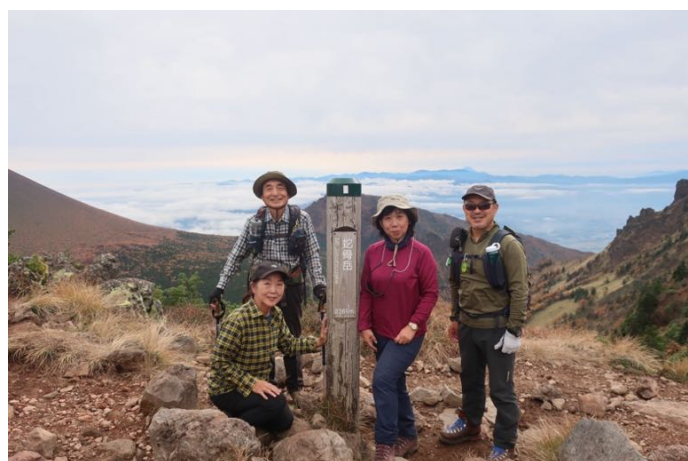
更に進んで、蛇骨岳に到着 標高 2,366m