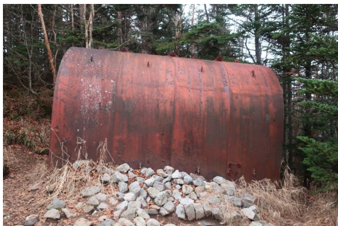
避難小屋 噴火対策のシェルターになっている