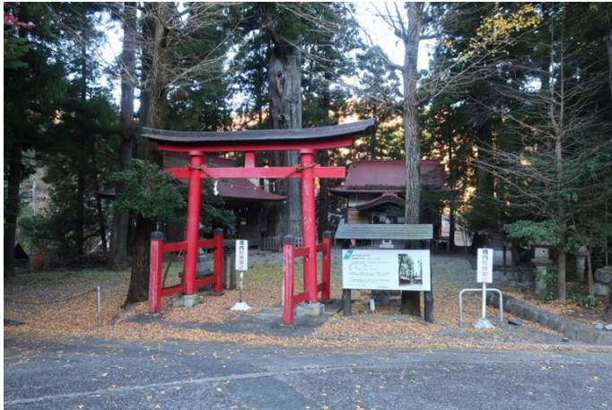
始発バスで東野バス停に着き、出発 道沿いの諏訪神社の横に入ると公衆トイレがあった