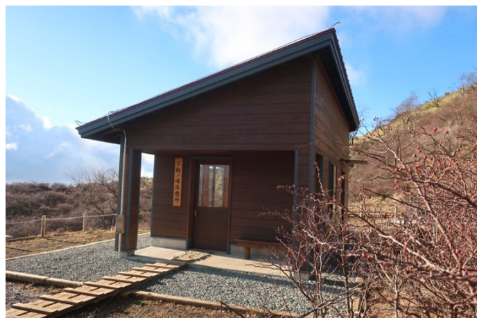
不動ノ峰休憩所で中休止