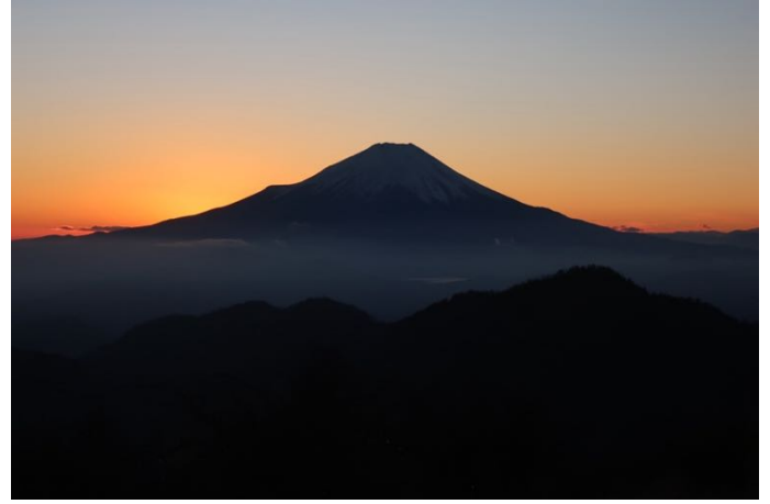
夕日の沈んだ富士山 美しい容姿