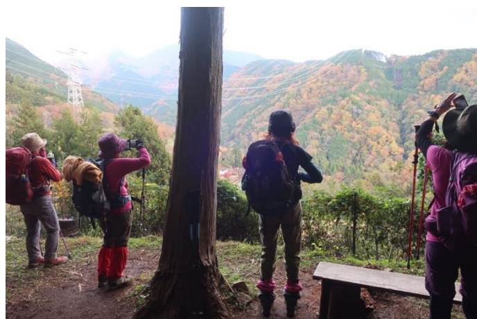
丹沢ブース横の広場で里の紅葉鑑賞 このあと、大倉バス停に順調に下山した