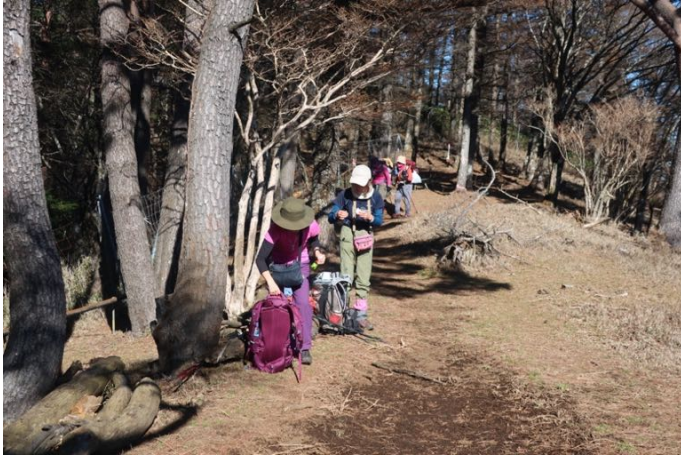
ようやく急登が終わり、八丁坂ノ頭の手前で 日当たりの良い平場に出た ここで昼食