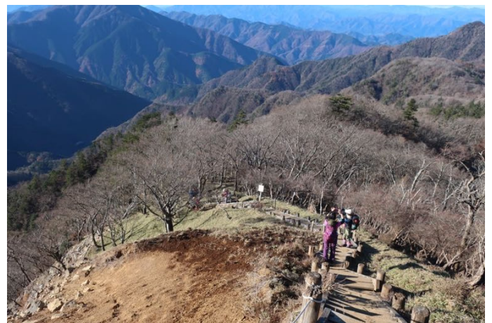
だいぶ登ってきた すばらしい展望