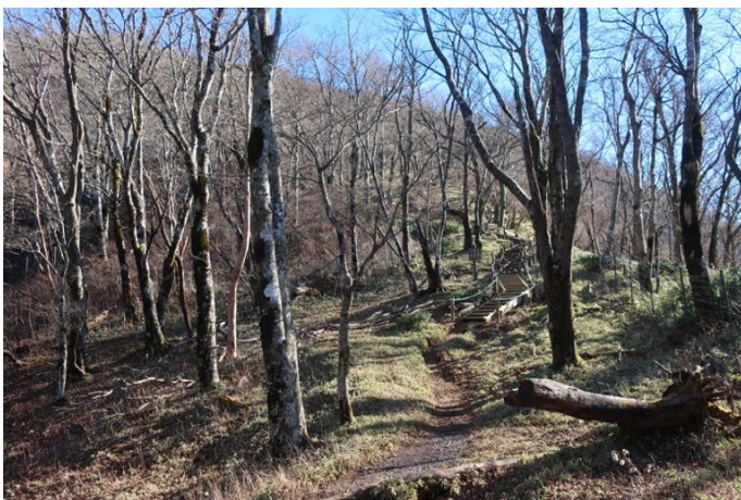
地蔵平を過ぎて、最後の急登区間に入る 階段が整備されていて登りやすい