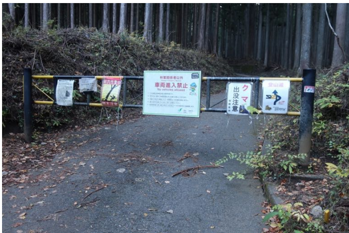
舗装道路を暫く行くとゲートがある