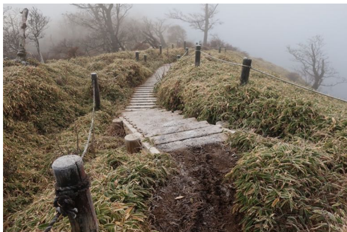
気温は 14℃ 木の階段には霜が付いている