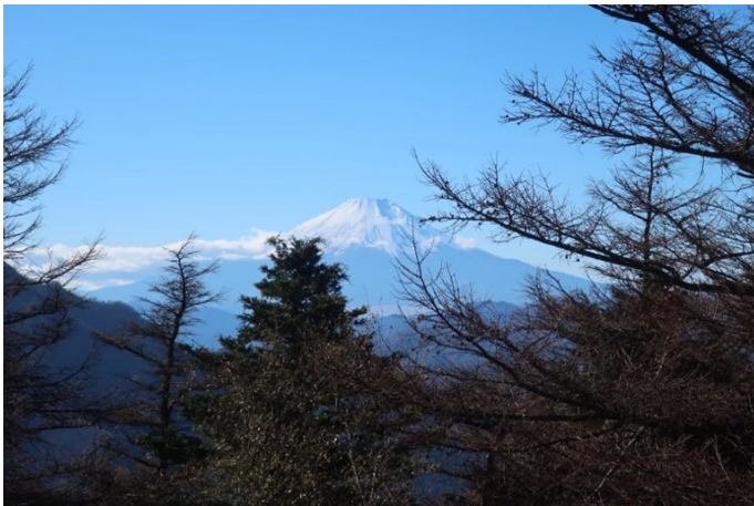
姫次に着いた ここは展望が良い