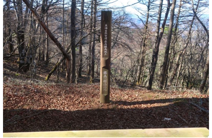
尾根道の東海自然歩道を行く 最高地点（標高 1,433m）の標識