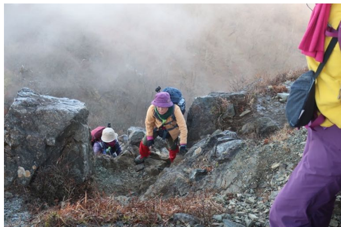
鬼ヶ岩の岩場・鎖場を 三点支持で慎重に登る