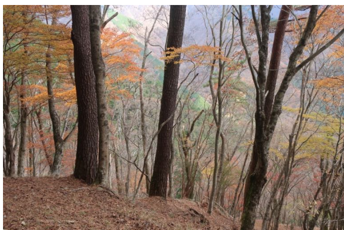
大倉尾根を、紅葉を楽しみながら下山