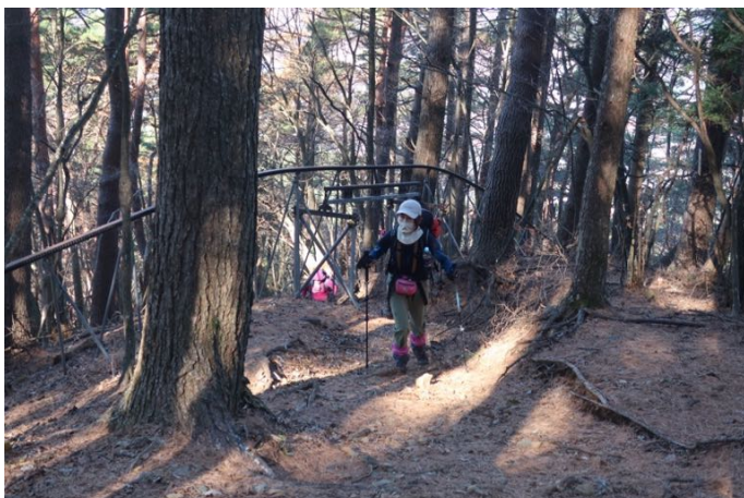
途中で作業用のモノレールに沿って登って行く