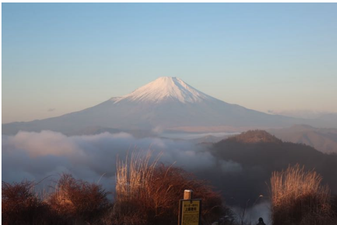
朝焼けの富士山 右手前の山は檜洞丸