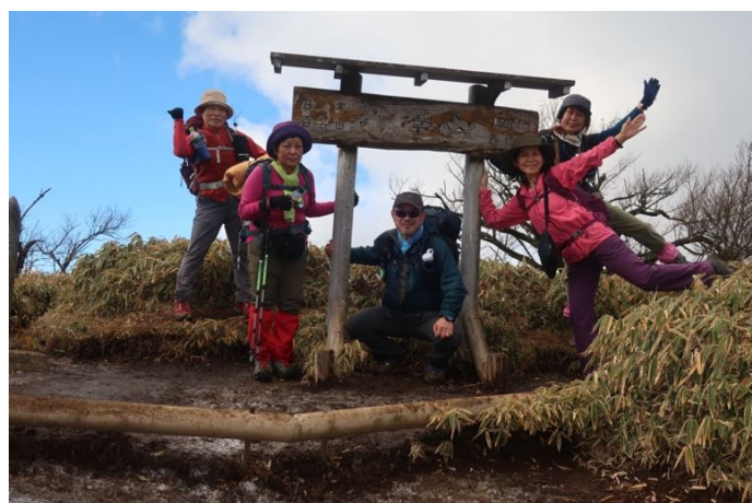
山頂碑で記念写真 標高 1,567m