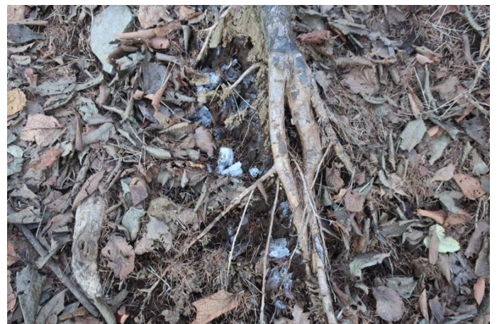
標高が 1,000m を超えると霜柱が出てきた