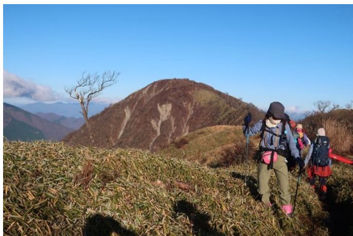
振り返ると蛭ヶ岳 山頂に昨夜泊まった山荘が見える