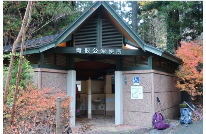
きれいな公衆トイレ