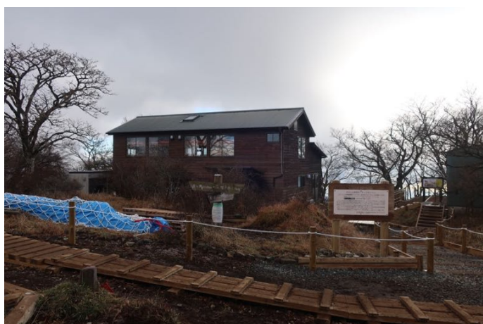
丹沢山山頂に到着 正面はみやま山荘、右側は公衆便所