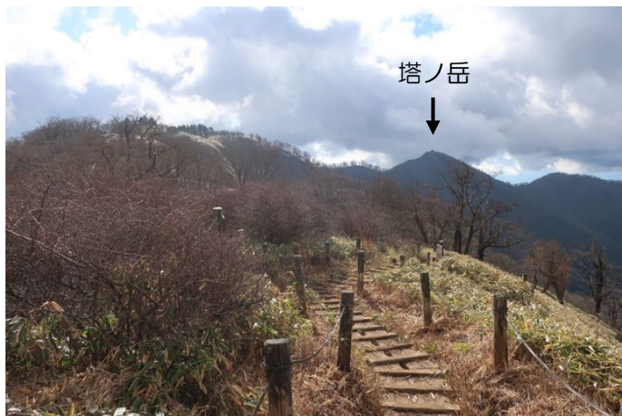
次は、塔ノ岳を目指す 楽しい稜線歩き