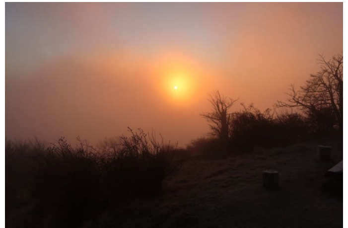
山荘前から見た日の出