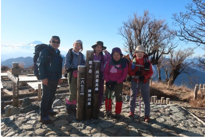
蛭ヶ岳山頂（標高 1,673m）に到着！ 本日は、蛭ヶ岳山荘に宿泊