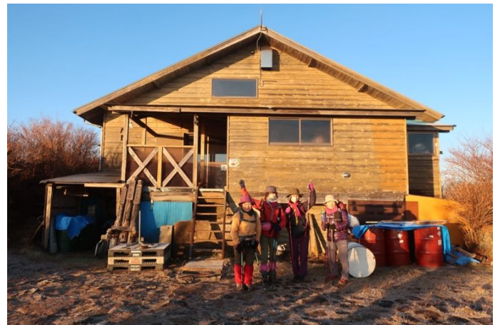
蛭ヶ岳山荘を元気に出発！