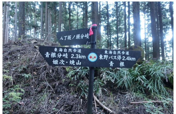
更に林道を行くと分岐点に着く 本日は、八丁坂ノ頭方面へ