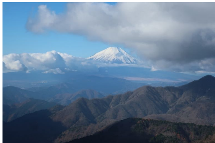
冠雪した富士山も ずっと見えている