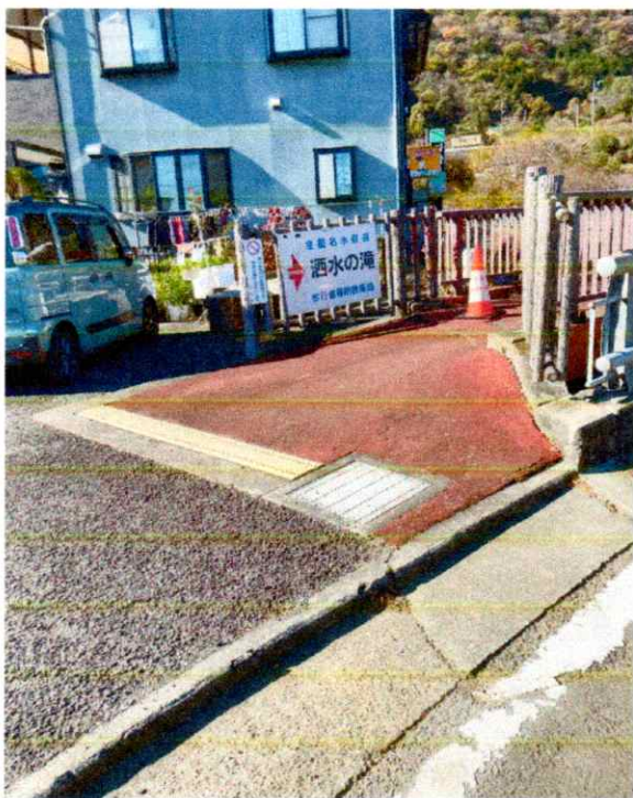
滝入口の専用遊歩道