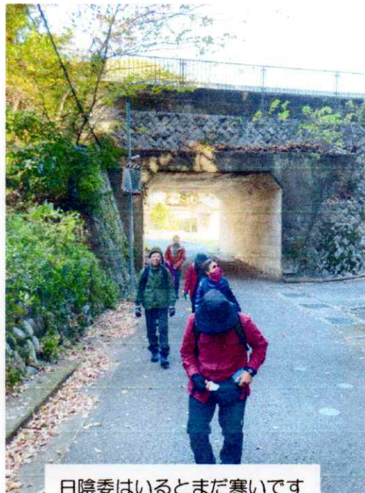
日陰委はいるとまだ寒いです