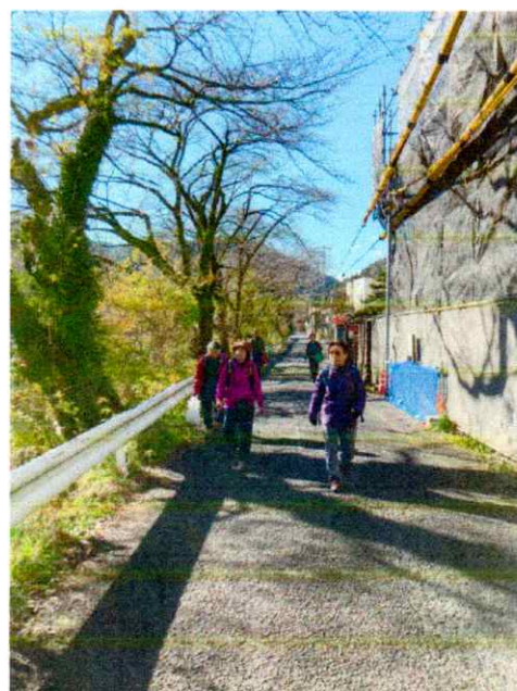
この後忘年会で、集合時間に間に合いました