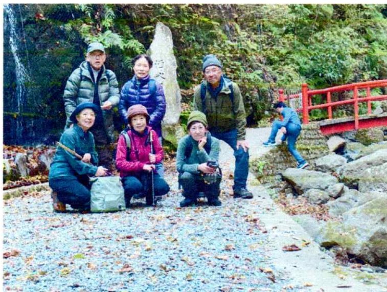
記念撮影です（あれ他の人影が）