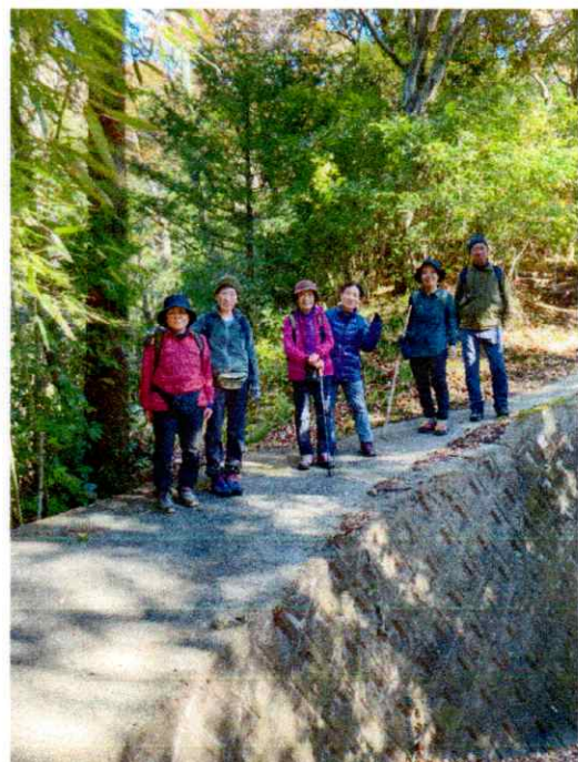
城址公園を下った分岐辺り