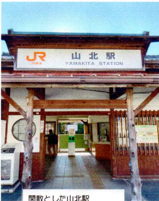
閑散とした山北駅