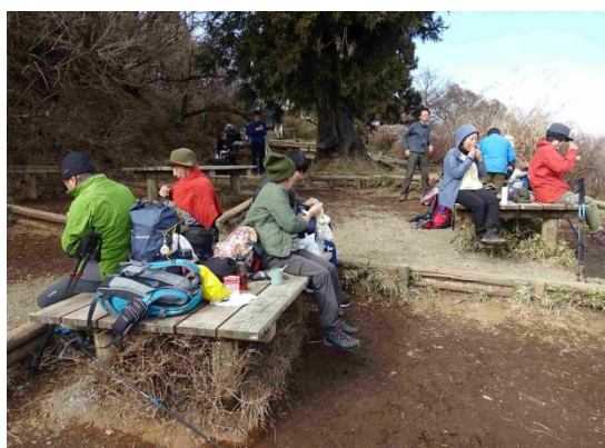
今日はゆとりの山歩きにて 45 分間のランチタイム