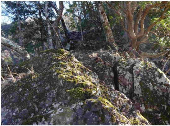
ルート中唯一の岩場を通過して