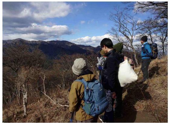
中央奥に富士山、三ノ塔が眼下に、表尾根が一望の大パノラマが広がっていた