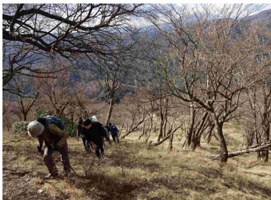
大山山頂ヘラストスパート