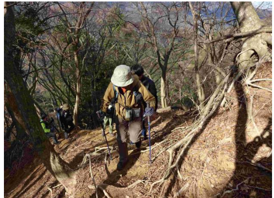
植林帯からアセビ、そして広葉樹林となり明るく開けた草原は獣たちの休息地