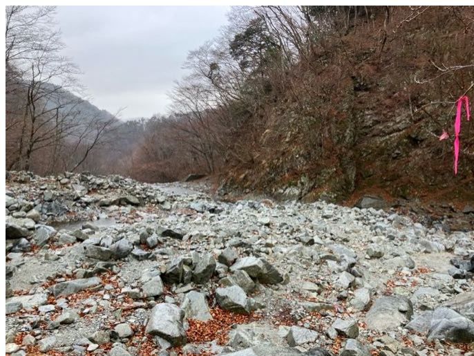
ようやくゴウラ沢出合まで降りた 少し前から急に気温が上がり (8℃) 雨になった