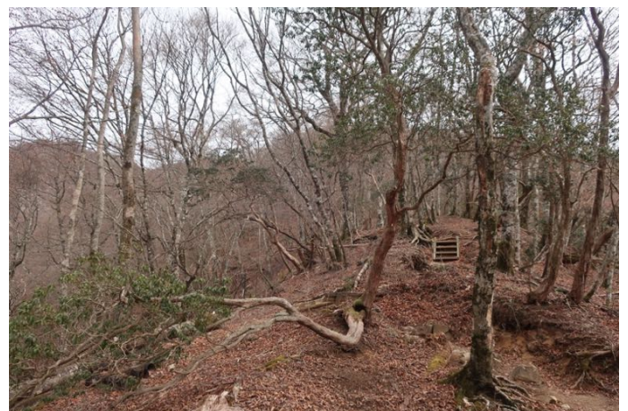
稜線までもう一息 曇って来た