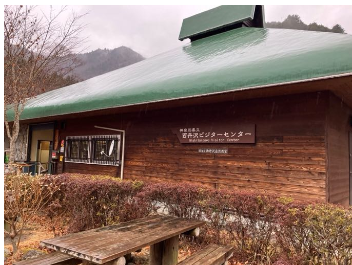
西丹沢ビジターセンターに無事下山 バスの時間に余裕を持って到着できた