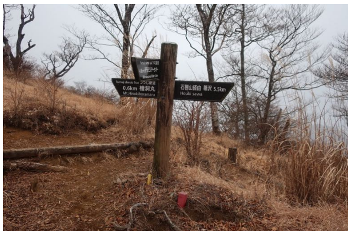
石棚尾根の稜線に到着 小雪がちらつき始めた