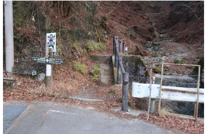
ツツジ新道登山口から 山道に入る