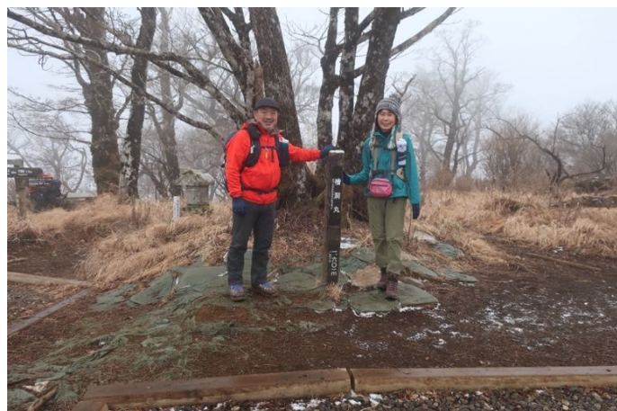
山頂に到着 小雪に加え風が強くなって寒い (-2℃) 昼食を取って下山開始