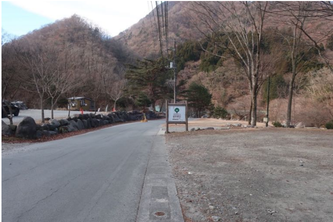
西丹沢ビジターセンターから出発 青空が広がっている 気温は-2℃