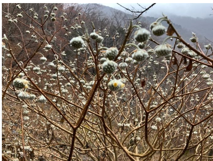
途中の水平道のミツマタ群生地 3月の満開が楽しみ (もう咲いた蕾もちらほら)