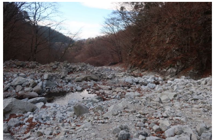
沢の水量も少なく、渡渉に問題無し