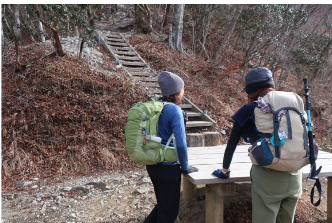
急坂を登り、ようやく展望園地に到着 ここからまだまだ急登は続く