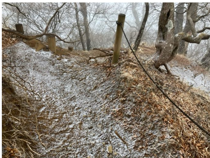
稜線からツツジ新道に分岐した辺りでは 薄っすらと雪が積もり始めた