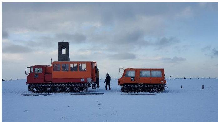
王ヶ頭ホテルの雪上車 南極みたい