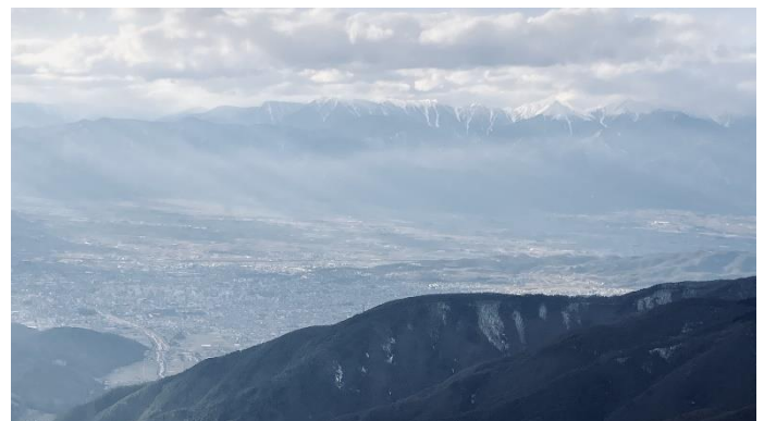
王ヶ鼻より松本市街の向こうに北アルプスを望む