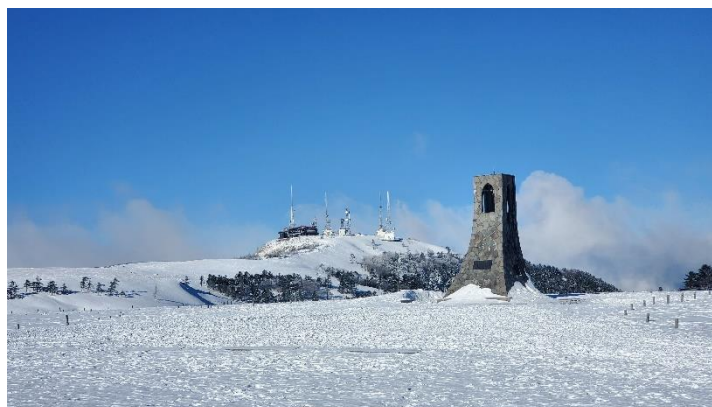
真っ青な空と雪原

【二日目】ビックリするような晴天。茶臼山に行きました。雪原から雲が登ってくる様子に「天空のラピュタ」を思い起こしました。