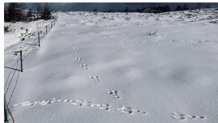
うさぎはどっちに進んでいる？