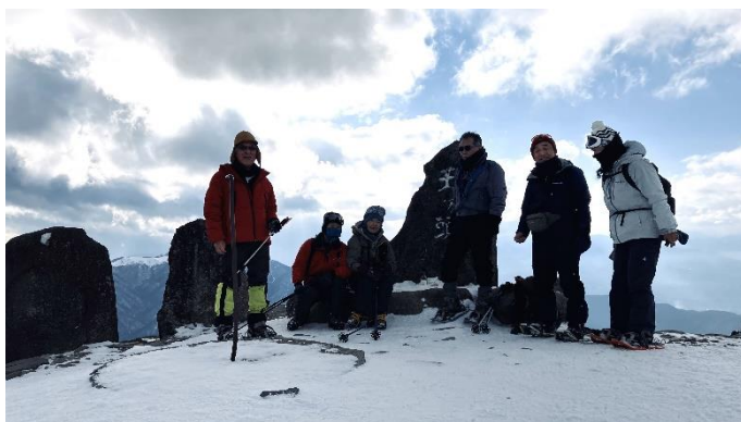
王ヶ頭で記念撮影 逆光だ！