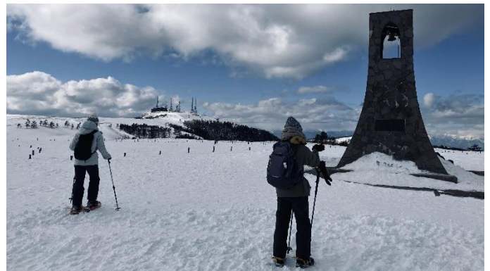
美しい塔から王ヶ頭ホテル望む