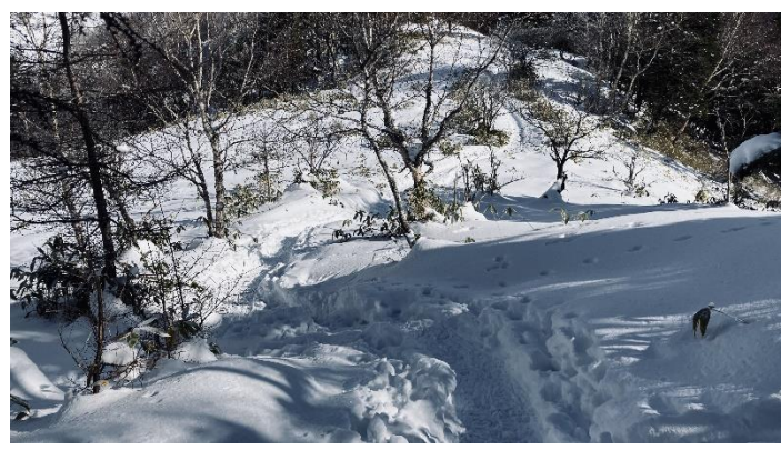
茶臼山への最後の登りを振り返る