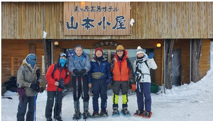
宿の前で記念撮影

【1日目】王ヶ頭、王ヶ鼻へ行きました。雲が少しありましたが、遠くに富士山も見えました。