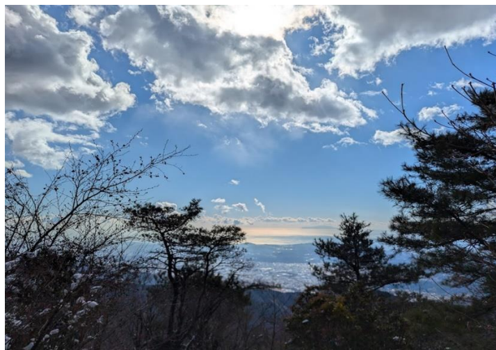
辛い大倉尾根だが振り返るとこの景色！

大倉尾根の道はこれが辛い❄️ これを登りきると花立山荘 気温は0度からマイナス2度くらい