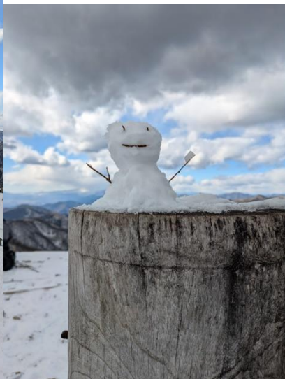
雪ダルマを作ったよ