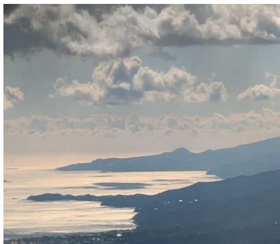
まるで青の墨絵のよう