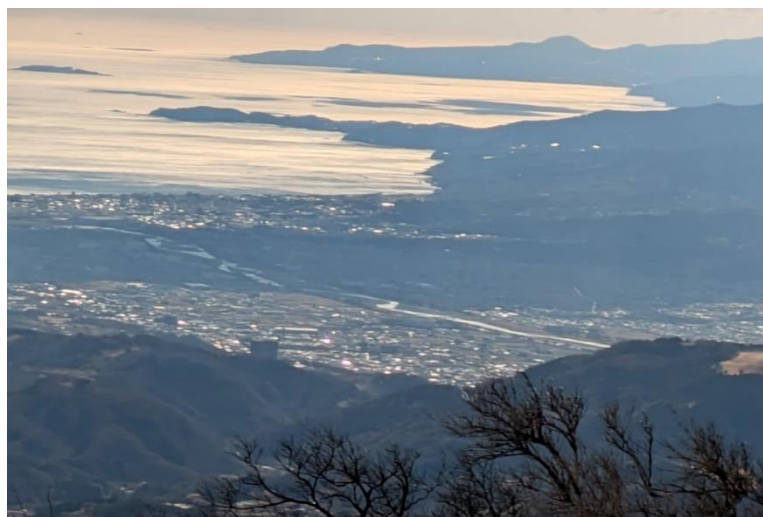
さあ下山！ 眼下の景色はまた良いな