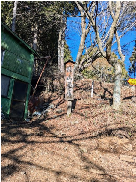
駒止茶屋までは雪はなし

2日前の日曜日に雪が降った。せっかくの冬だもの雪山を味わいたい。参加者を募集したが一人での山行となった。登る前は塔ノ岳の雪山は大変！と実は気が重かったが、ソロだからこそできる自由でのんびりとした山行となった。