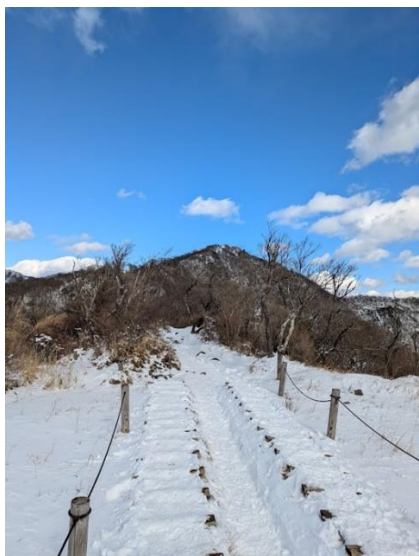
花立山荘からは雪の世界 キュッキュッという雪を踏む音