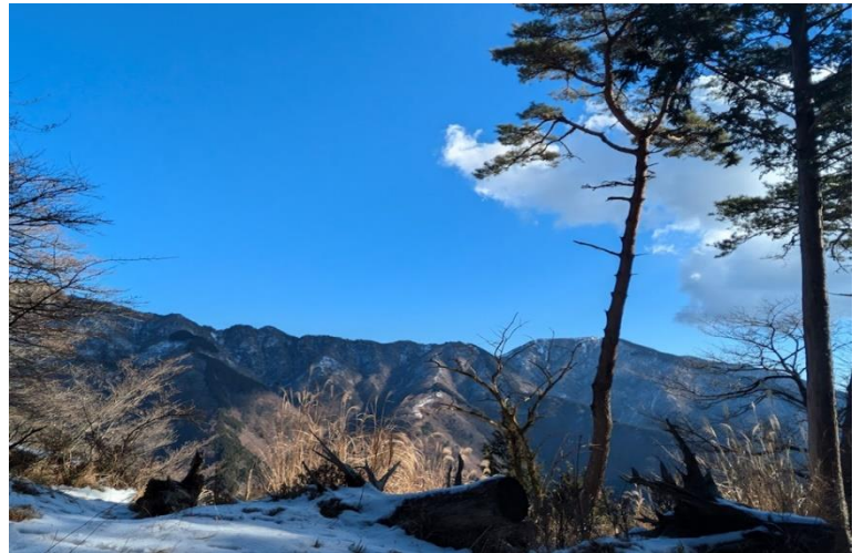
のんびりと丹沢山の景色を楽しむ