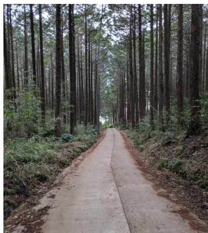
この道も好きな道