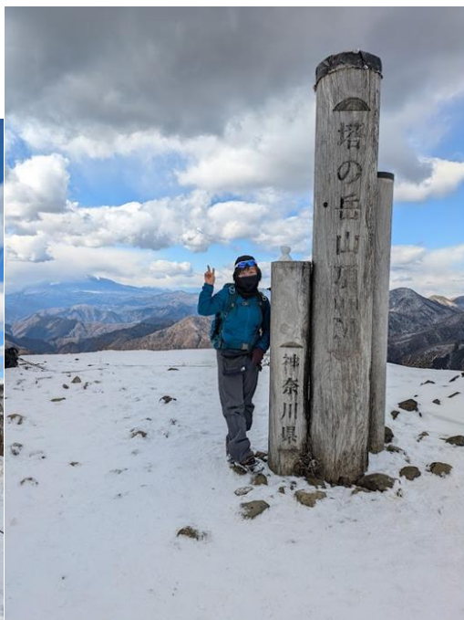
無事頂上！気温はマイナス4度位 背景には富士山（頭が見えないが👁️）