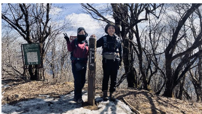
大室山には少し雪が残っていました