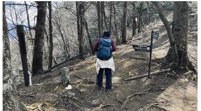
白石峠 後は下りるだけ