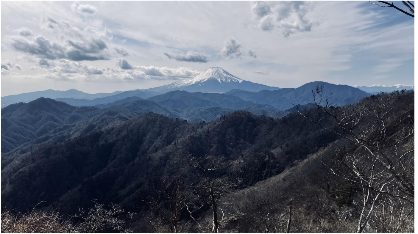
大室山から加入道山へ 富士がくっきり、右手には南アルプス