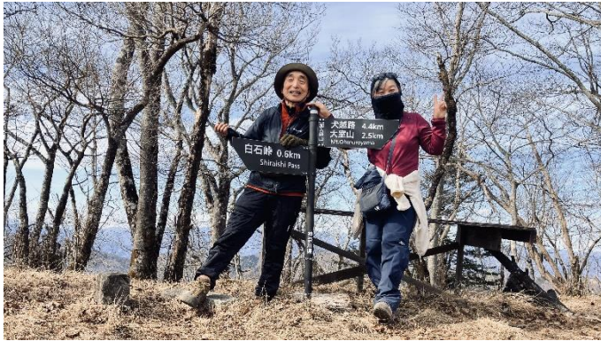
加入道山 ポーズをとったわけではないのですが