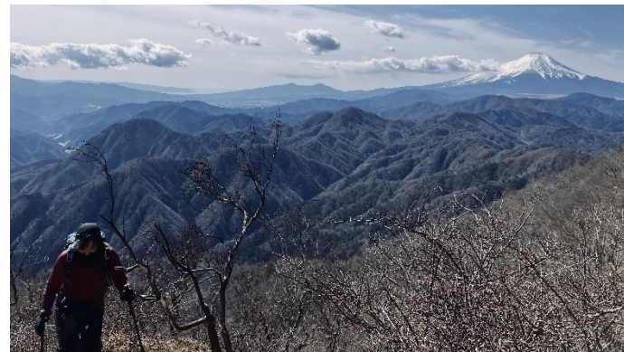
大杉丸から前の肩への尾根道は展望が素晴らしい