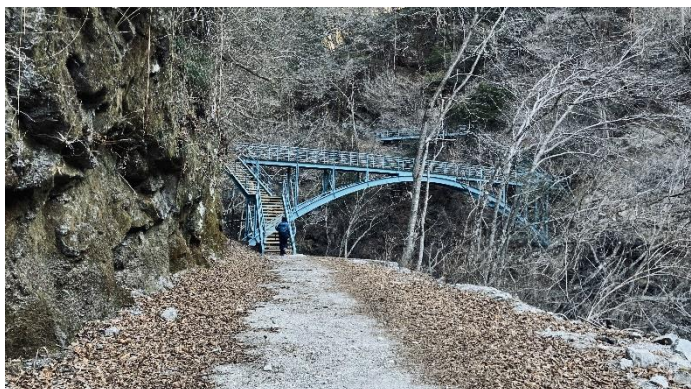
用木沢を少し行くと特徴的なダム越えの階段