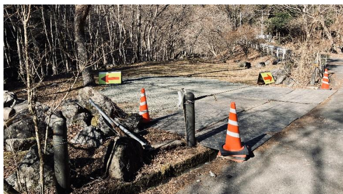
用木沢出会の駐車場は閉鎖