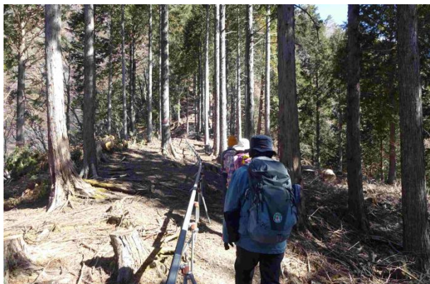
モノレールの電车道通り