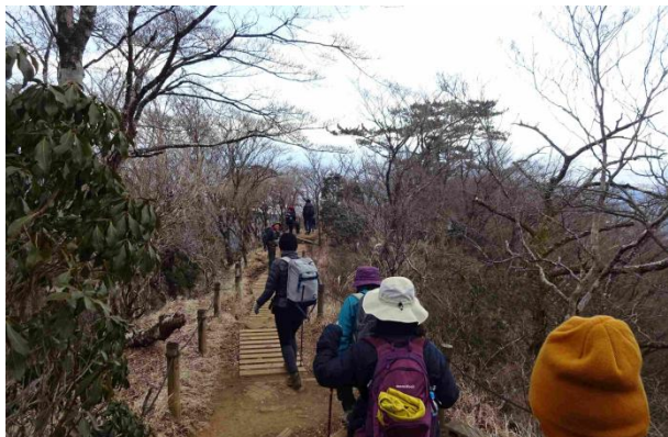
正面の栗ノ木洞を見ながら