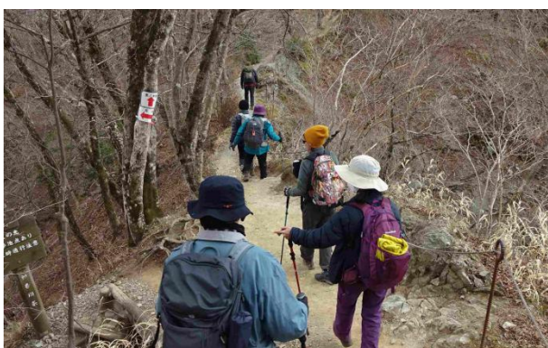
手入れが行き届いた作業道をジグザグに降りてゆく