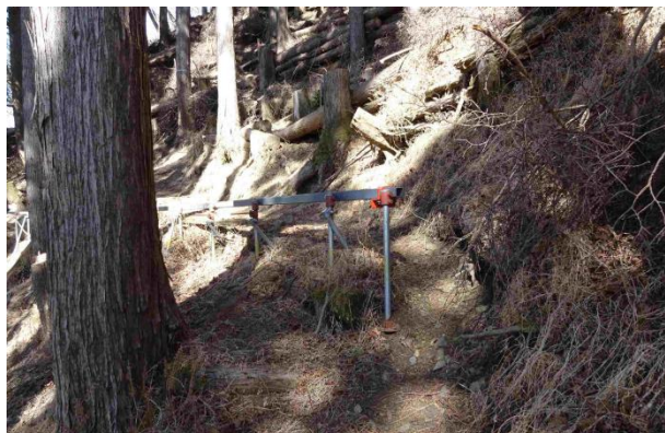
モノレール終点が高度 1000m の一般登山道合流点