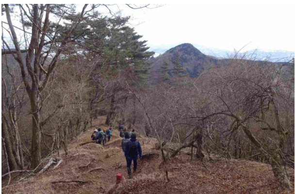
ここから後沢経路に入ります