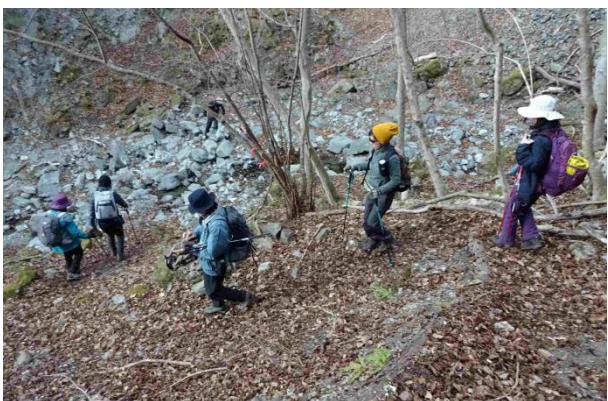
そして沢に降り立って