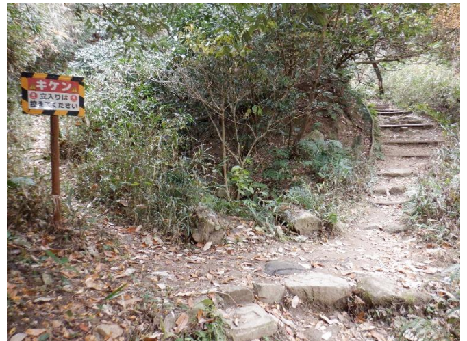
旧道と新道の分岐。旧道の竹林コースは、崩壊しているのので「立ち入りを控えて下さい」となっていた。