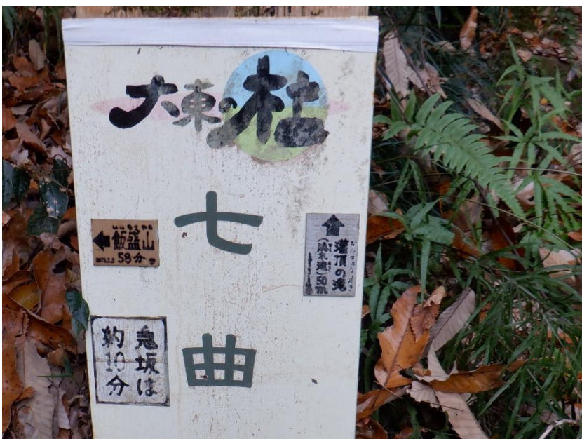
隠れ滝には寄らず七曲経由で山頂を目指す