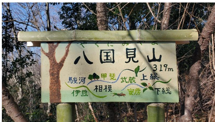
❖8つの国が見渡せるから「八国見山」