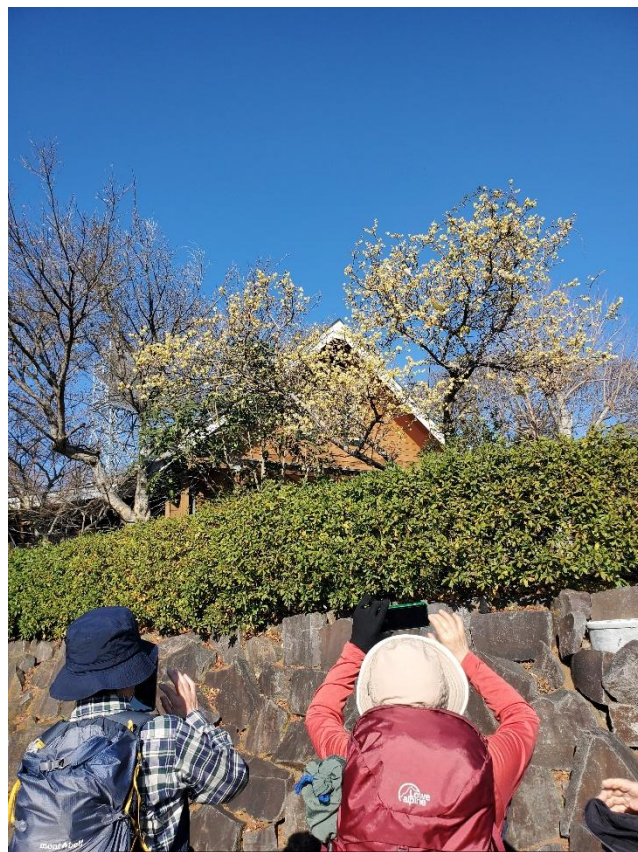
途中で見事な蟠梅を見つけた