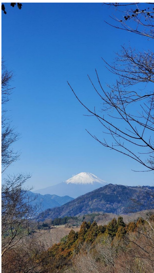
❖冬の富士山はいつ見ても感動する