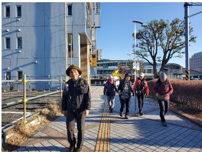
秦野駅からしばらくは歩道歩き

3月下旬ころの天候との予報通り暖かで穏やかな山行だった。「渋沢丘陵散策」というタイトル通りアップダウンの少ない山歩きではあったが、総距離は13.5Kmと歩きごたえがあった。丘陵の途中で随所に見える大山を含む丹沢山系と富士山の美しさを堪能した。