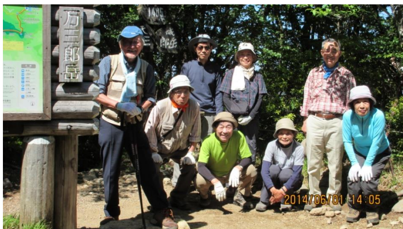
万三郎岳で集合写真