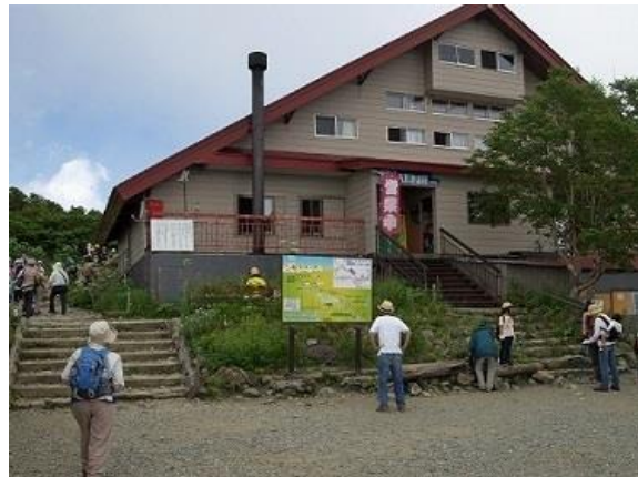
八方池山荘を出発