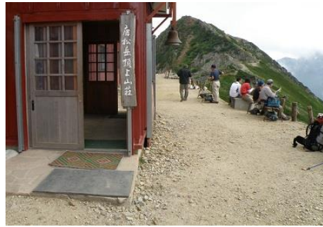
やっと唐松山荘に到着 山荘前にリュックをデポし唐松岳へ