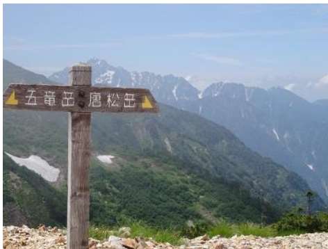
牛首を抜け稜線へ ここから剣・立山連峰を右に見ながらの 稜線歩きが続きます。