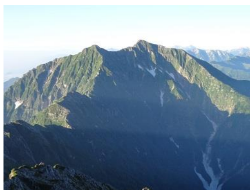
正面には鹿島槍ヶ岳