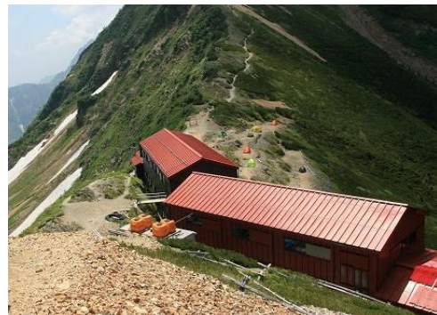
無事五竜岳山荘に到着

*13 時前には山荘に着き五竜岳往復 2 時間の時間的余裕はありましたが 五竜岳頂上がガスに覆われてきたので、明日朝に登ることにしました。