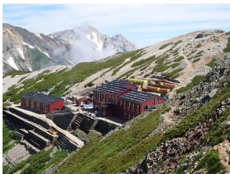
山荘に戻り行動食を食べてサア 五竜岳に向けて難所の牛首へ 登りはじめて振り返る山荘