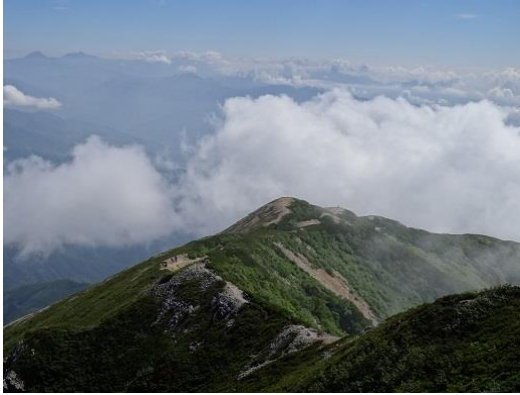
丸山ケルンからだいぶ登ってきました