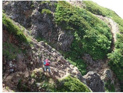
男女の若者に追いつきました