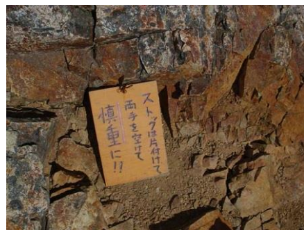
ストックはしまい慎重に・・・ 三点確保・・・口ずさみながら