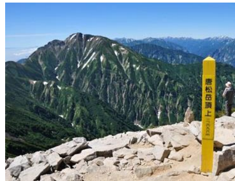
唐松岳頂上は絶景なのに なぜか百名山ではない・・・？