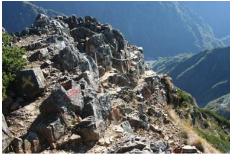
鎖場が続きます・・・