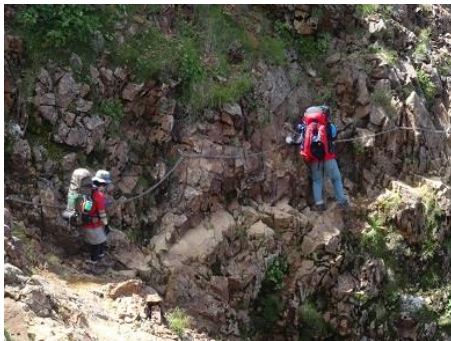
女性のペースがあまりに遅く渋滞 途中で先に行かせてもらいました