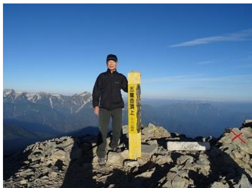
五竜岳頂上 後ろに立山・剣岳