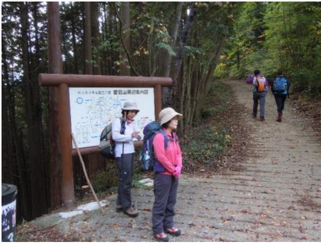
登計峠で登山道に戻り一休み