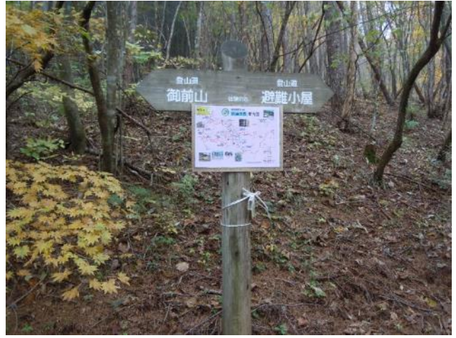
境橋からの道が合流