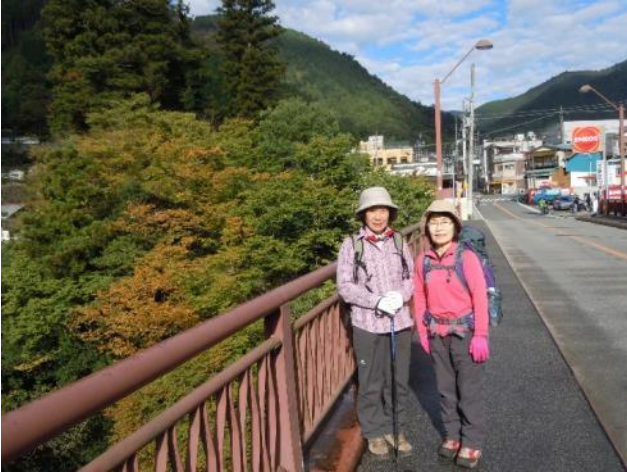
奥多摩駅から昭和橋を渡り登山口に向かう