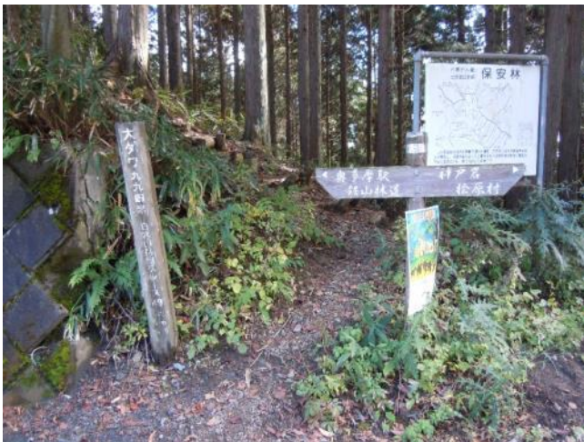
大ダワ(大きくたわんだ鞍部)への入口