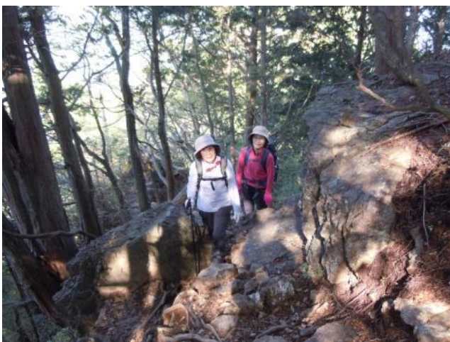
次から次へと現れる鋸齒を登り下り