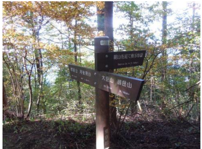
大岳山からの登山道に合流