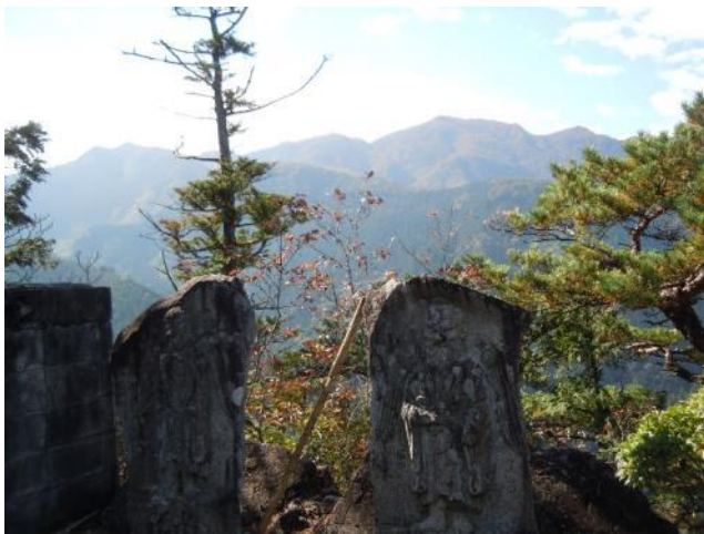
右手にはこれから目指す御前山