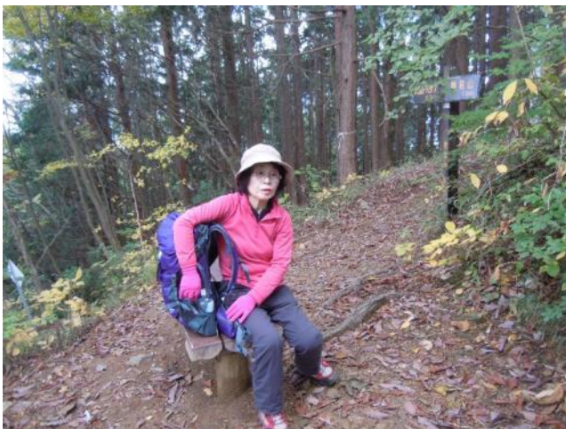
狭い鞍口山の山頂