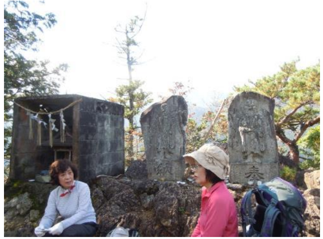
鋸尾根の2つ目の鋸齒の上には天聖神社と石像