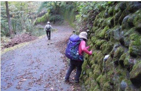
登山道は倒木で通行止め / 滑りやすい林道を下る