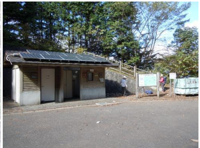
大ダワには林道が通じ、駐車場、トイレがある。