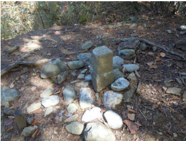
8つ目の鋸齒の上に三角点 / 鋸齒はここで終り