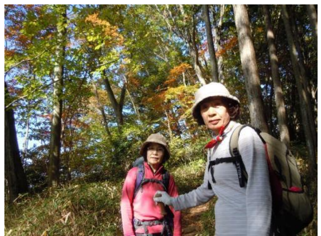
紅葉を見ながら一休み