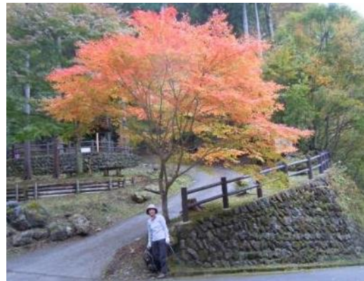
トキノキ広場からも林道を歩く