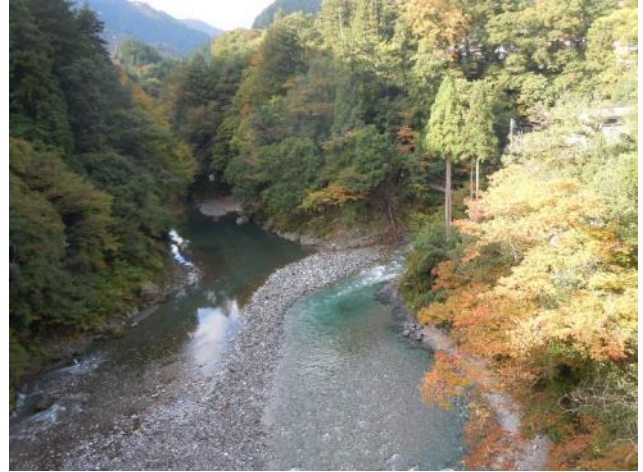
渓谷は紅葉が始まっている