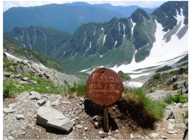
ほぼ中間地点の最低コル