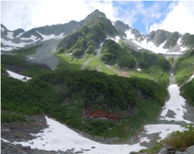
北穂南陵と涸沢小屋