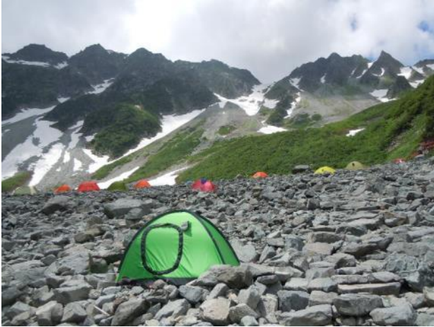
涸沢キャンプ場から奥穂、涸沢岳