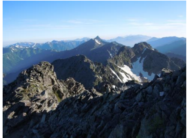
山頂から涸沢岳、槍、前穂