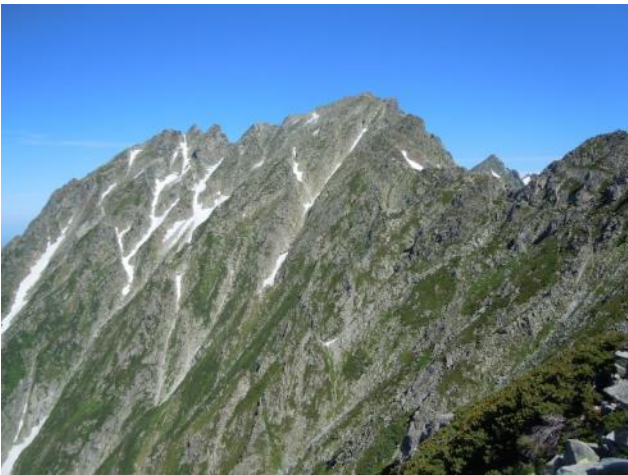
紀美子平から吊尾根を振り返る