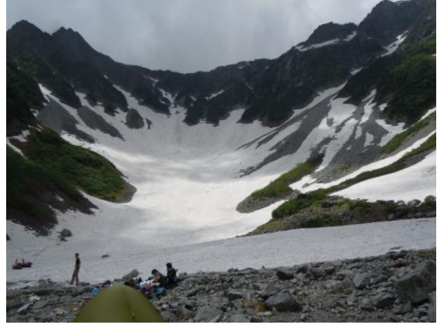
奥穂・前穂の吊尾根と涸沢雪渓