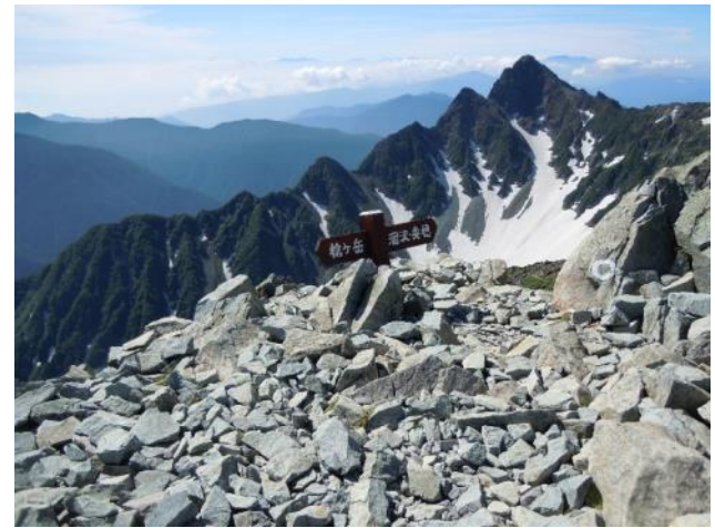
前穂、北尾根の峰々 / 縦走路へ