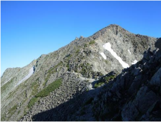
南稜ノ頭から奥穂を振り返る