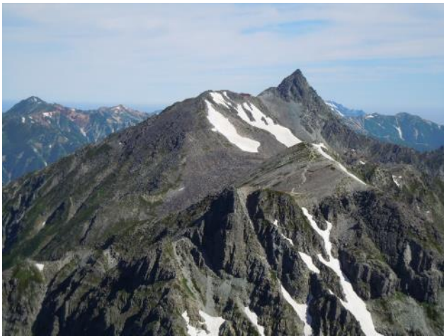
北穂山頂から槍、南岳