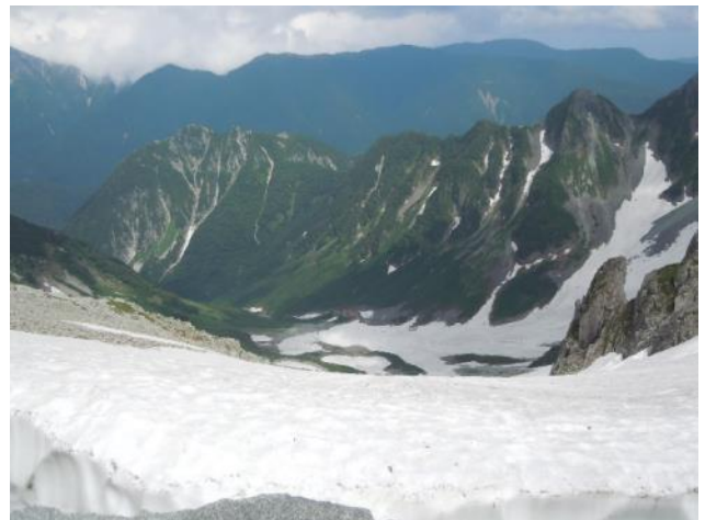
涸沢と北尾根、屏風ノ頭