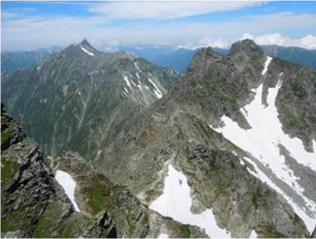
涸沢岳山頂から槍、前穂