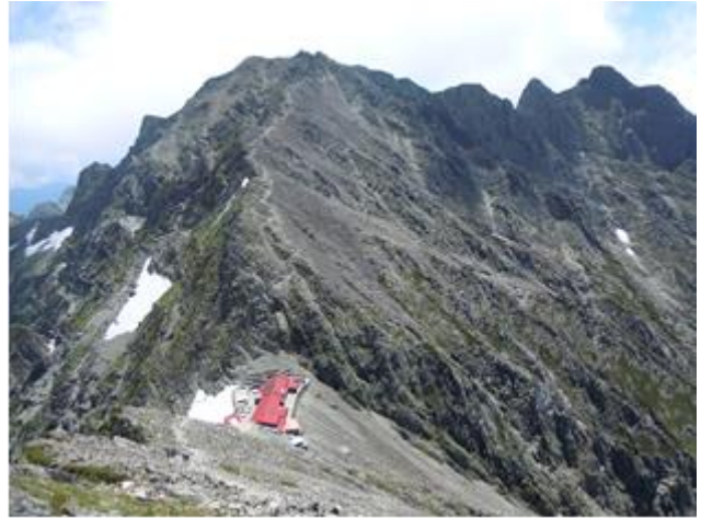
奥穂、ジャンダルム、穂高岳山荘