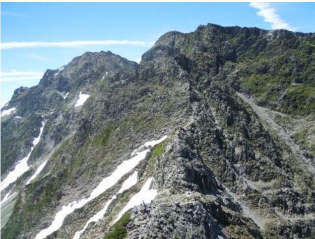
正面に涸沢岳、左に奥穂