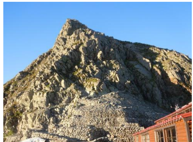
山荘横の岩場から登る