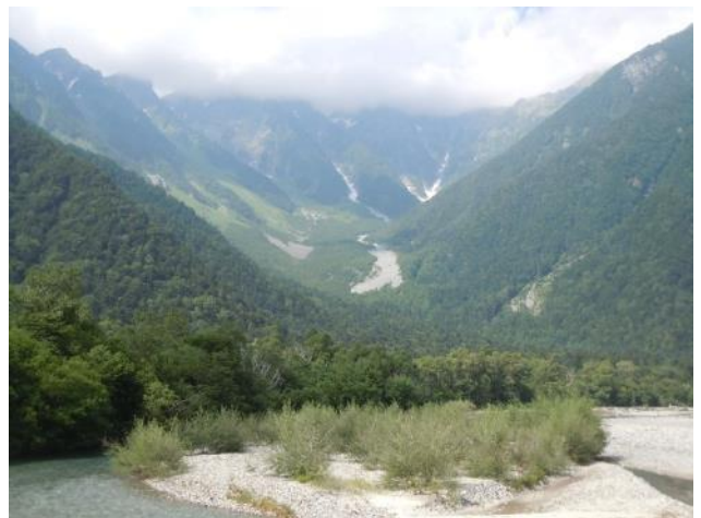
上高地から穂高連峰 / 上部は雲の中