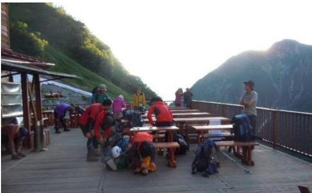
早朝の涸沢小屋前