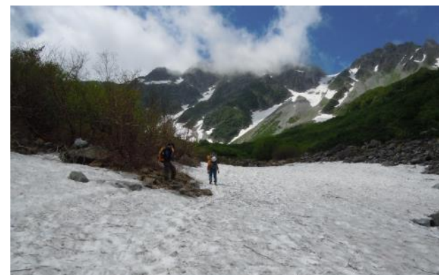
ヒュッテ下の雪渓に行く