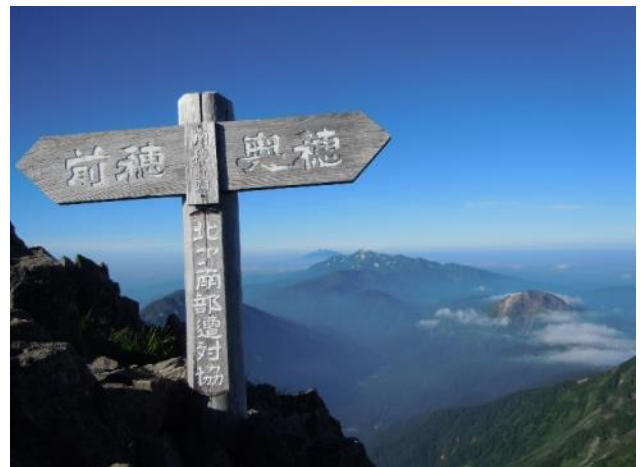
焼岳、乗鞍岳 / 吊尾根へ