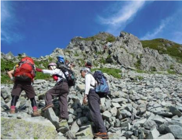
北穂南陵の急な登り