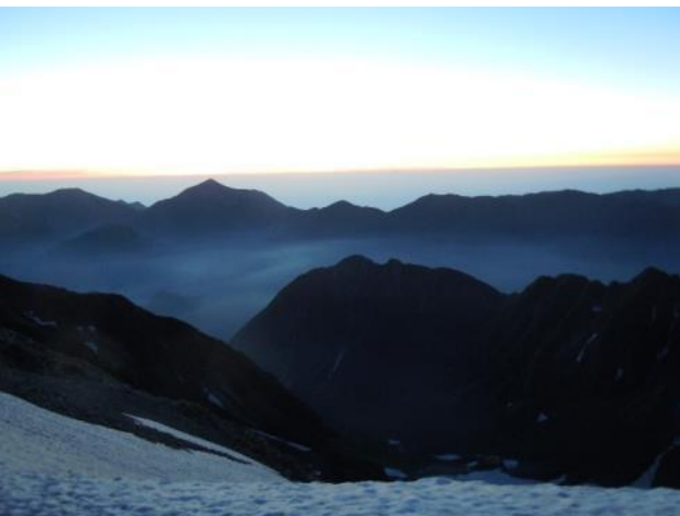
夜明けの屏風ノ頭 / 左奥は常念