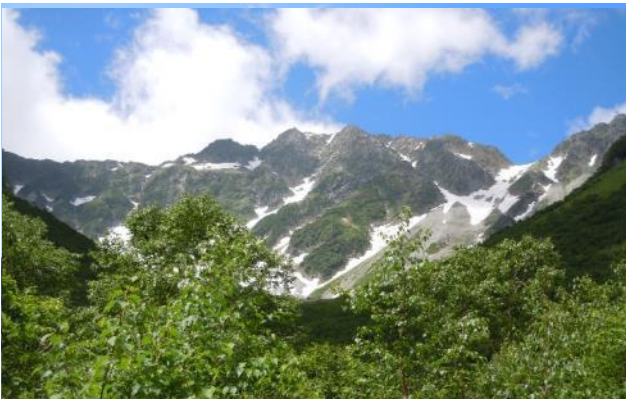
奥穂が見えてきた