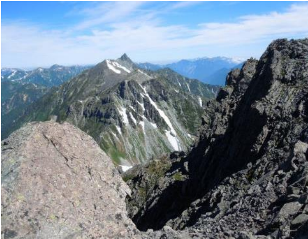
縦走路から槍 / 右は北穂