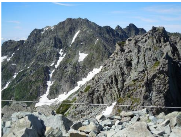
奥穂 / 右は北穂南峰