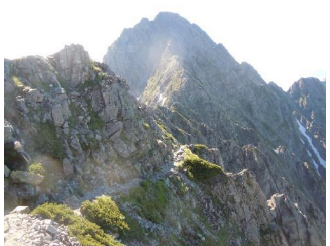
吊尾根を前穂に向かう