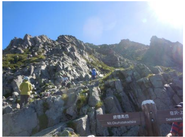
紀美子平から前穂山頂往復路（今回省略）