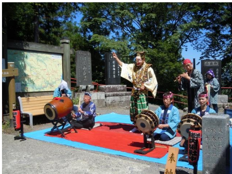
参道の土産店を通り抜け隨身門に入ると神楽舞が行われていた。