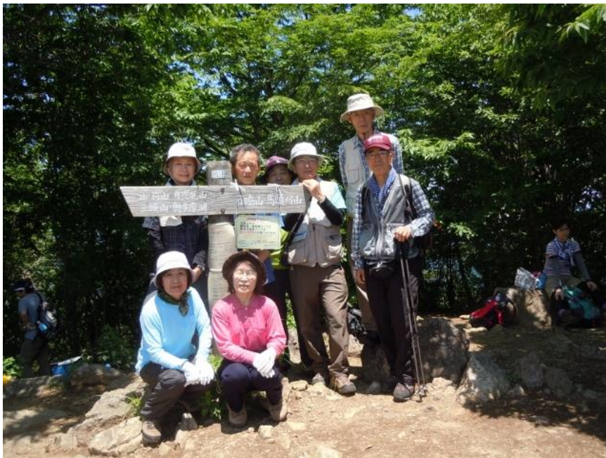
大岳山山頂集合写真

荒れ果てた大岳山荘と大岳神社の前で一休み。ここから約20分、鎖場のある岩尾根を慎重に登りきると大岳山山頂（1267m）