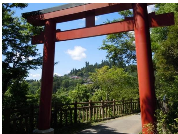
御岳平の大鳥居から歩き始める

日の出山から御前山まで3回に分けて縦走する2回目。御岳山山頂直下から大岳山を経て鋸山まで縦走し鋸尾根を下りた。前回は遊歩道的な縦走路であったが、今回は変化に富む山歩きだった。