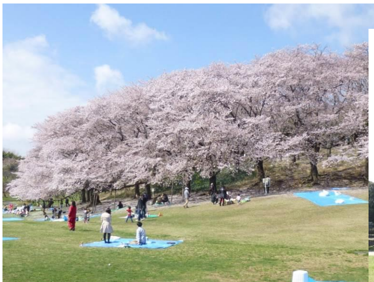
根岸森林公園（旧根岸競馬場跡）桜の下で家族連れの花見がもう始まっています