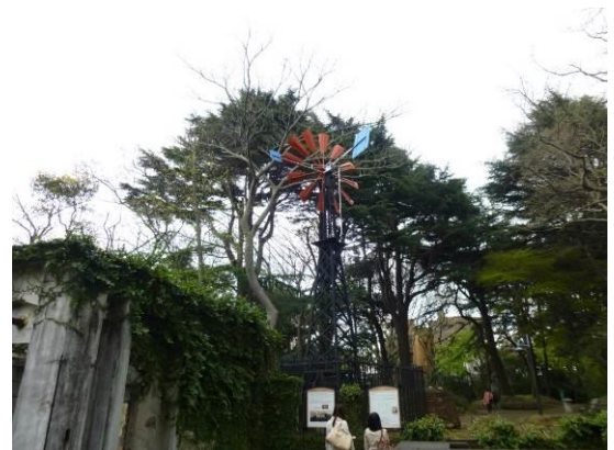
平和の母子像（緑区に米軍ジェット機が墜落して亡くなった母子を悼んだ碑）とフランス山の風車