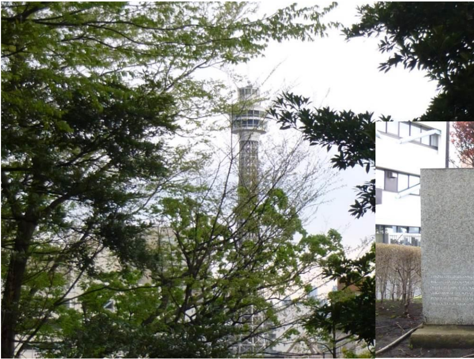
フランス山からマリナータワーを望む