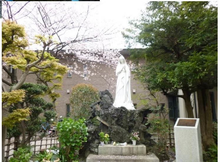
山手カトリック教会のマリア像