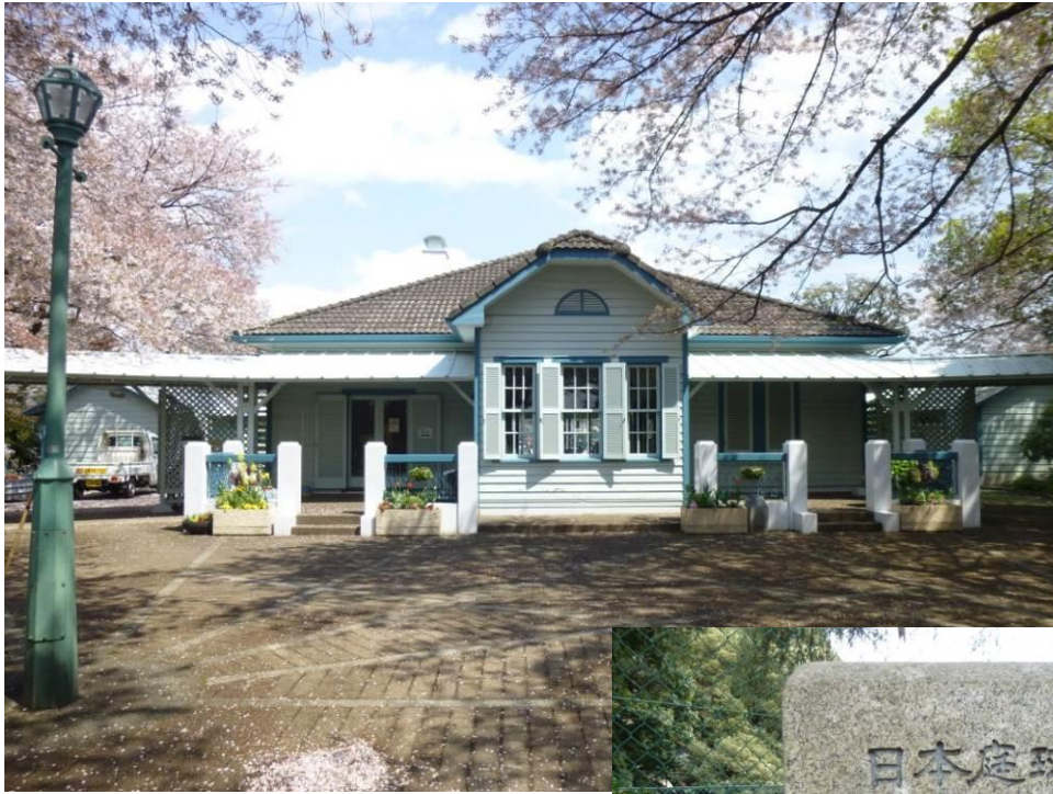
山手68番館(テニス発祥の地)