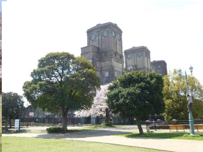
旧競馬場の一等観覧席の遺構、明治時代の見事な建造物ですが、崩れそうです