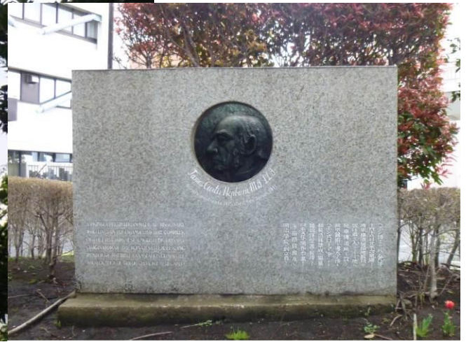
ヘボン式ローマ字を広めたヘボン博士の 記念碑