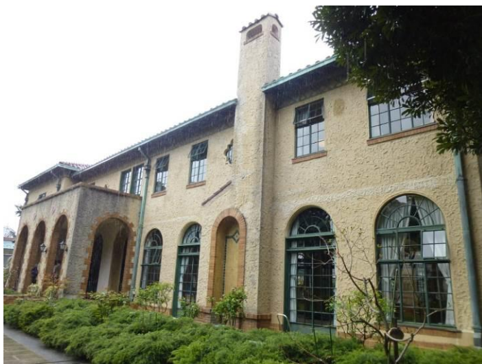
ベーリックホール