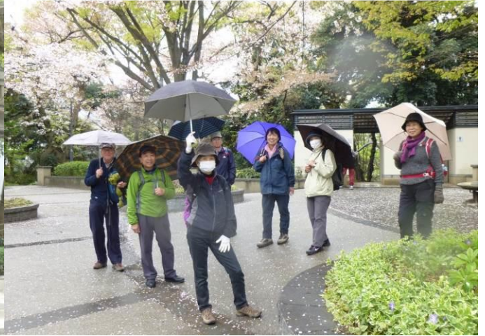
山手 234 番館