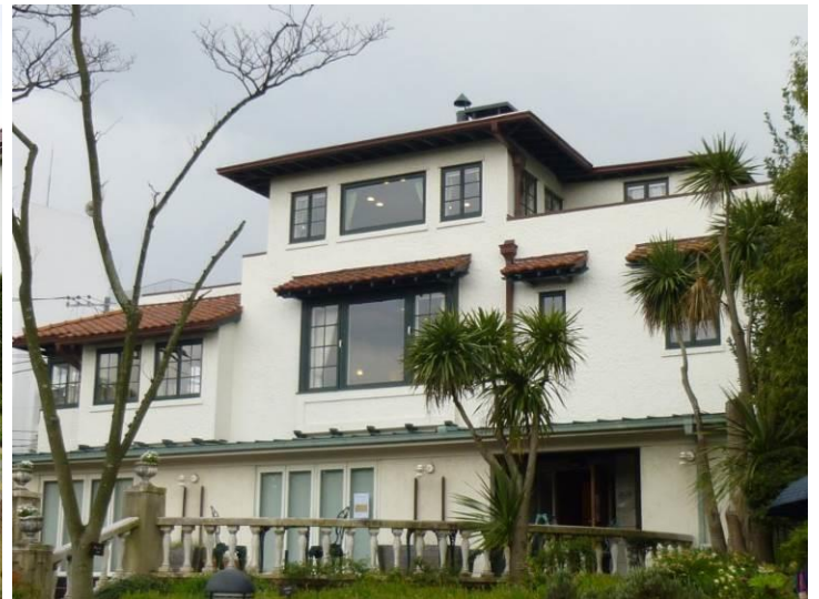
山手 111 番館