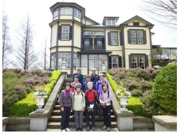
外交官の家の前で集合写真