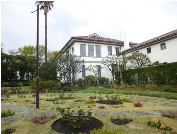
イギリス館 休館日で入れませんでした。