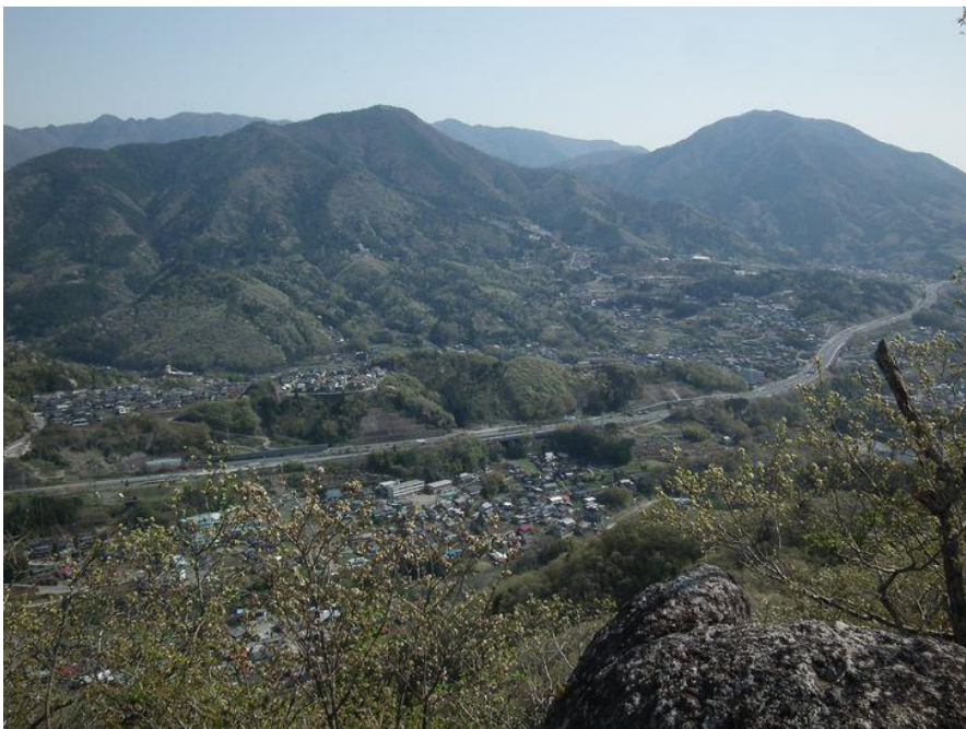
左：百蔵山（左）と扇山（右） 下に続く道は中央高速道