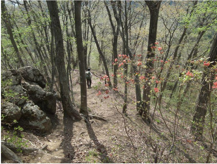
左：菊花山から吊尾根を沢井沢ノ頭へ まさに春の里山歩き！