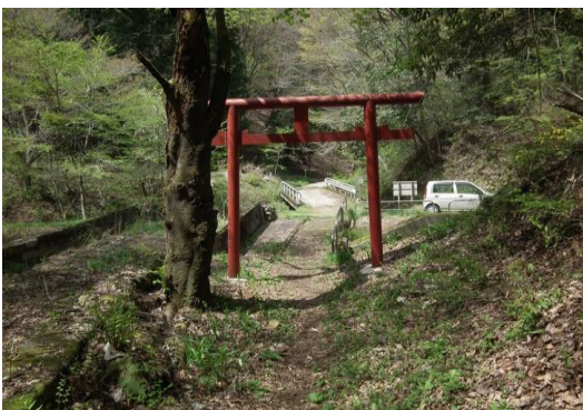
厄王権現への入口鳥居、ここから国道 20 号 へは 10 分ほど林道を歩く。