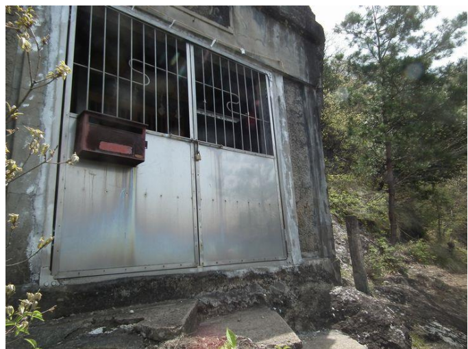
大きな岩かげにある厄王権現様

菊花山は大月駅南側にある山、三角形の尖った山です。上の尾根は急登ですが、眼下には大月の街や富士山が見え、箱庭の中の風景を見るようです。