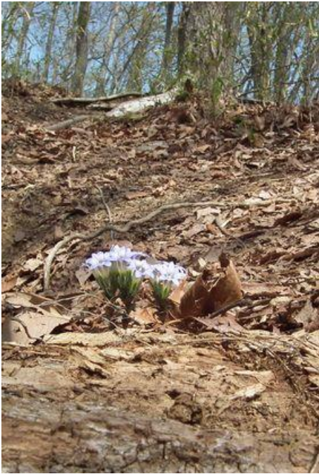
可愛らしいフデリンドウ