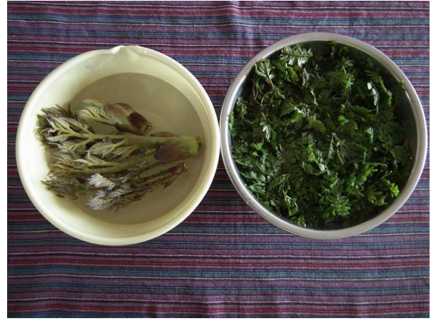
春の山歩きの楽しみ！ 左タラの芽、右山椒の新芽、摘み取るのに面倒 ですが、食べる楽しみのため！