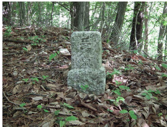
最初の目印 1005m 四等三角点