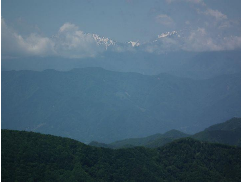
雲が湧きだし隠され始めた南アルプス