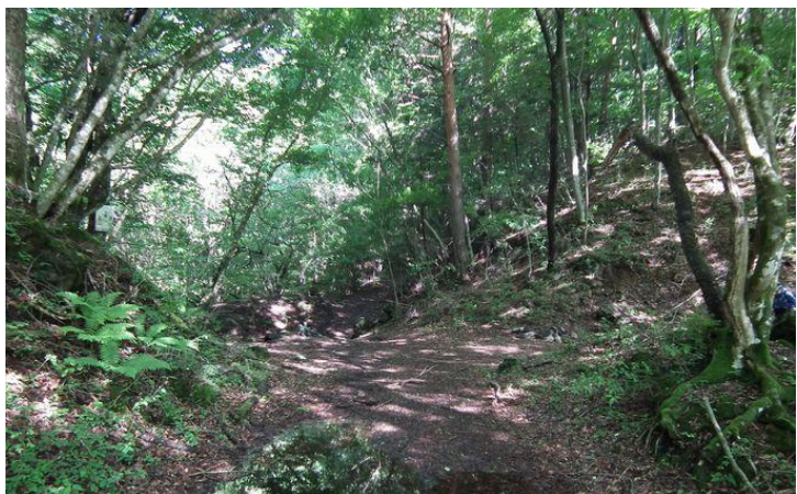
大和田林道王岳南尾根末端よりスタート 右手の斜面を上る。標高 960m

コース：自宅 4:50—大和田林道登山口（標高960m） 7:45/57…王岳南尾根取付地点 8:13…四等三角点 1005.2m 8:23…1142m 8:50/55…1428m 9:21/31…根場分岐 10:00…王岳 10:17/30…1420m 付近稜線（昼食） 11:15/40…図根点 12:12/15…五湖山 12:17/22…図根点 12:26…西精山 12:45/50…大和田林道登山口 14:07/30—自宅 16:45 参加者：イガ、他1名