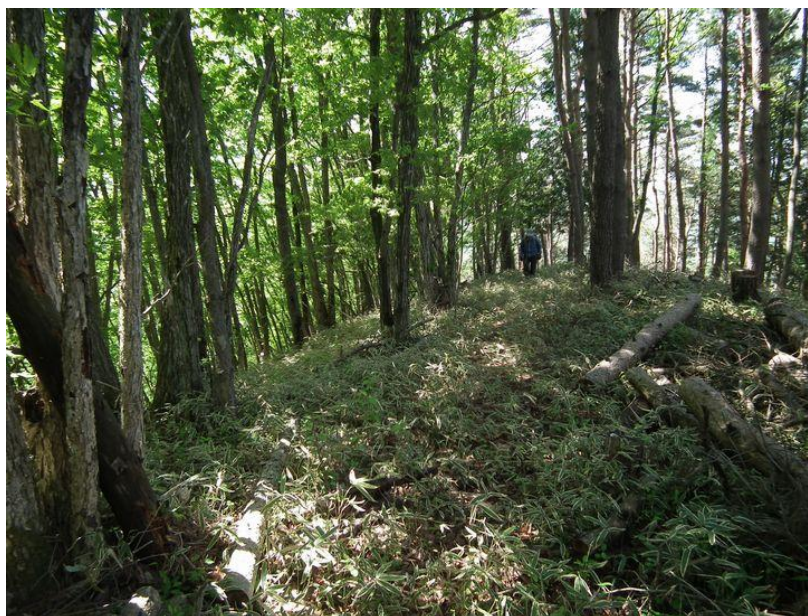
吉沢岩付近までこのような笹の下草が続く