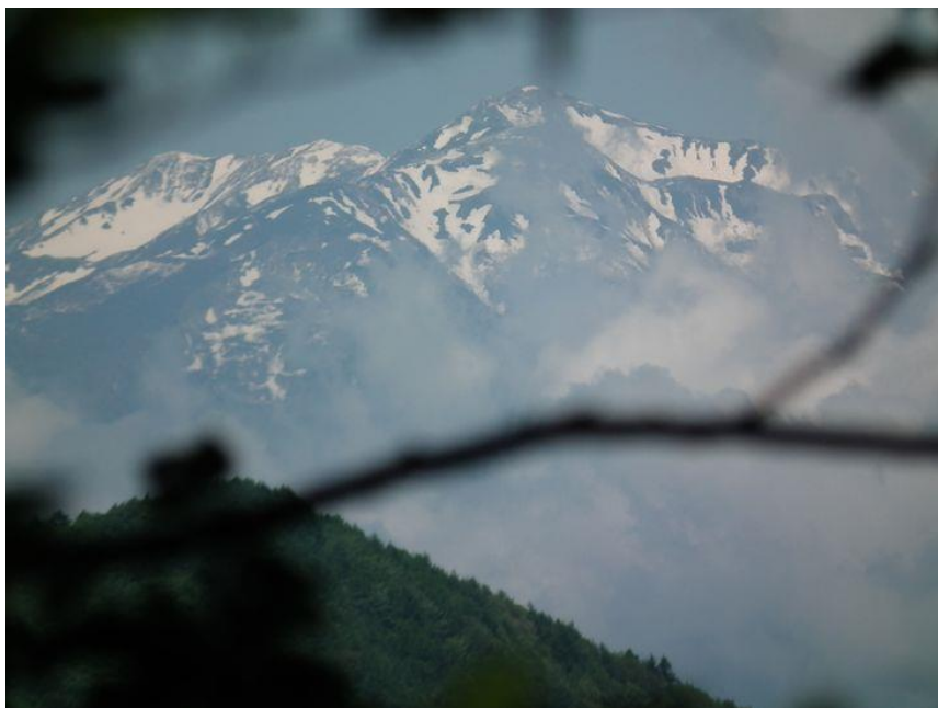
←南アルプス 赤石岳方面