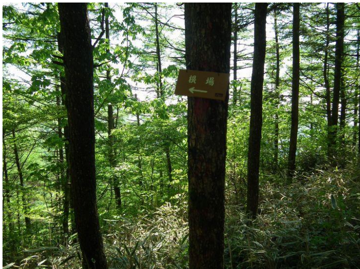
根場分岐 今はエアリアマップにルート記載あり