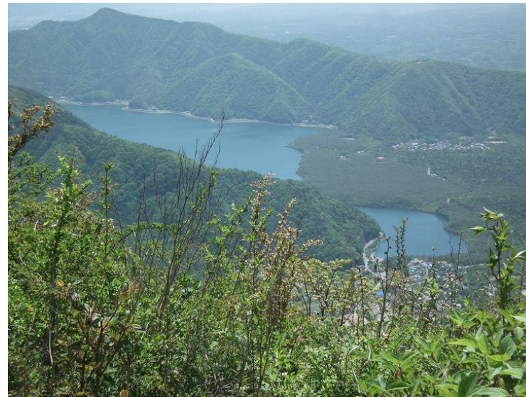
王岳より 河口湖と西湖、足和田山