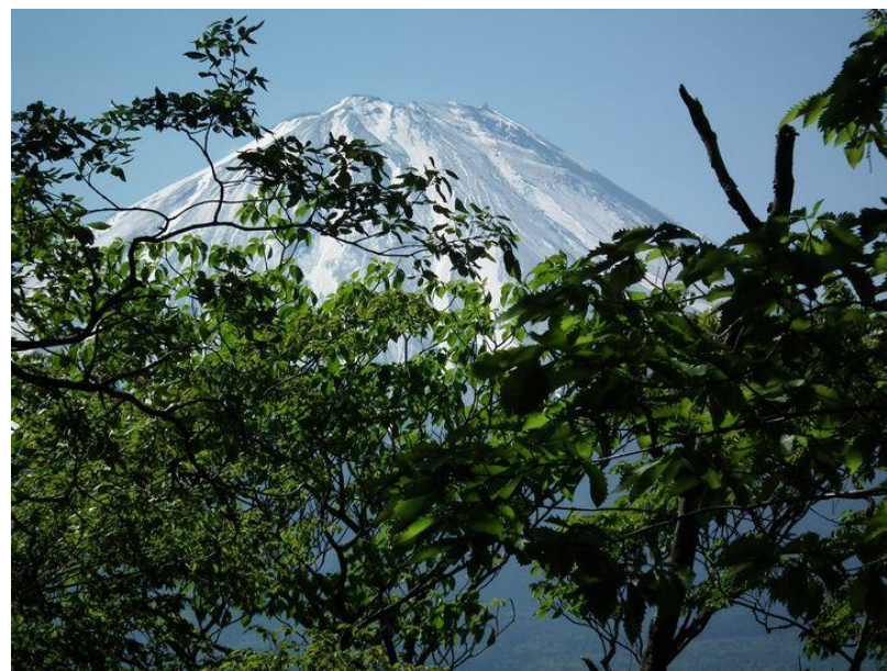
目の前にありながらなかなか顔を見せない富士の山→