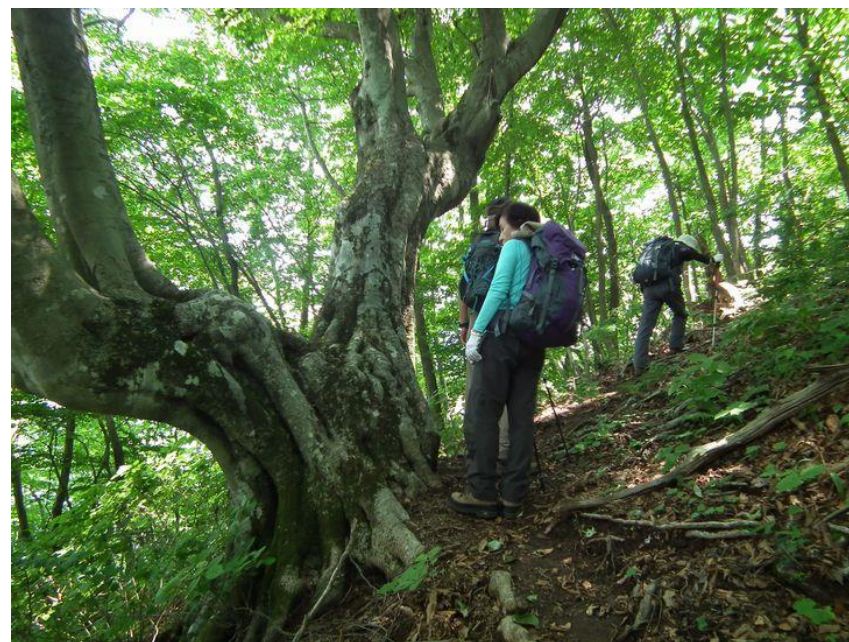
山頂直下ブナの巨木