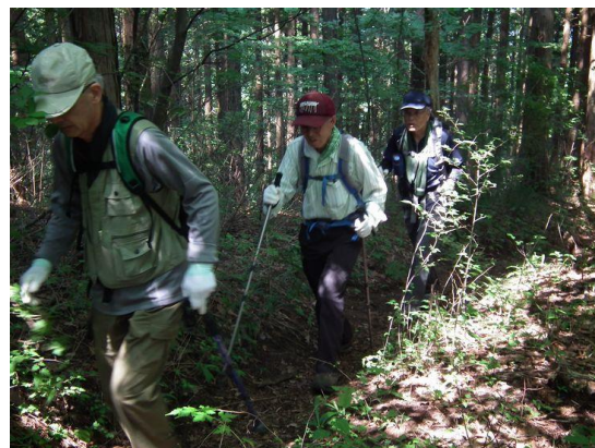
木々に覆われ何も見えない、黙々と！