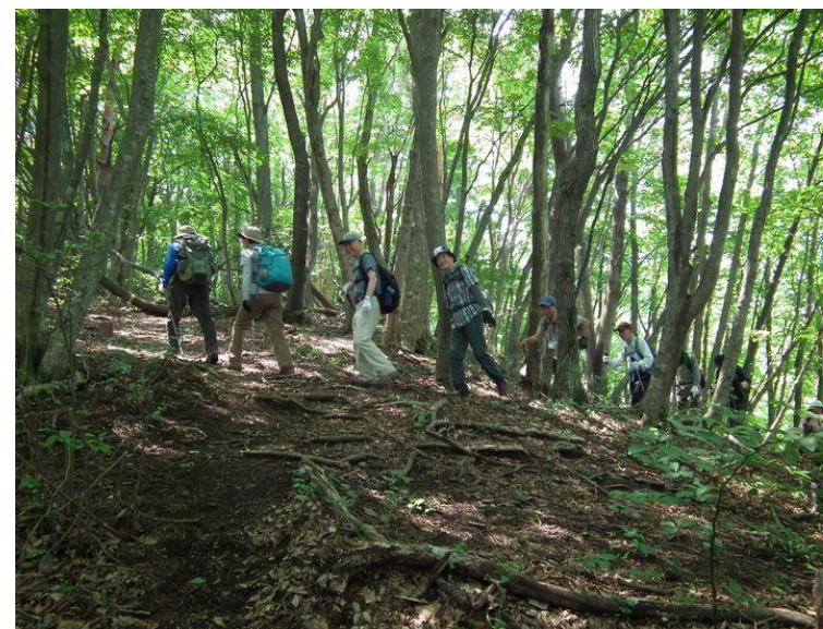
良い感じのブナ林、秋がお奨めです。