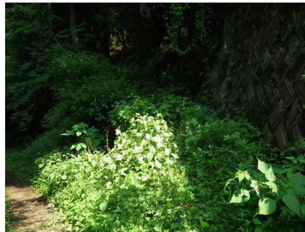
昭文社エリアマップにルート記載はあるが、民家手前の登山道は草に覆われている。梁川への木片がなければ判らないでしょう。