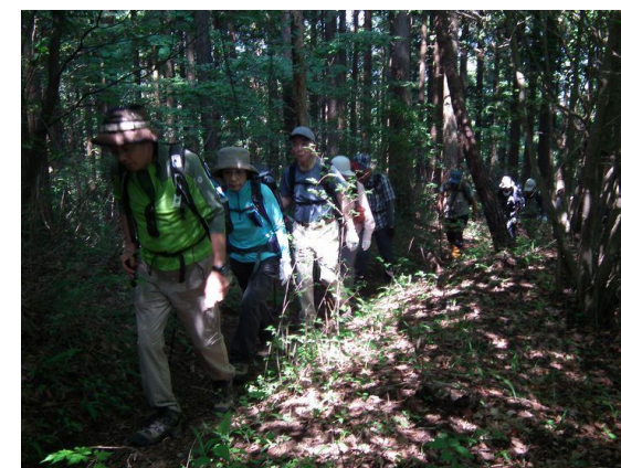
参加者のなかでの一番の若手！