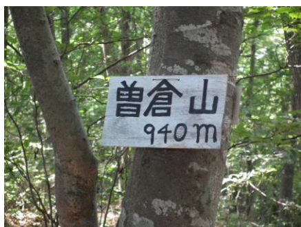
峠～扇山の間にある