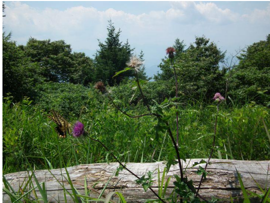
この方向に見えるはずの富士山、本日は休業です。アゲハが舞っています。