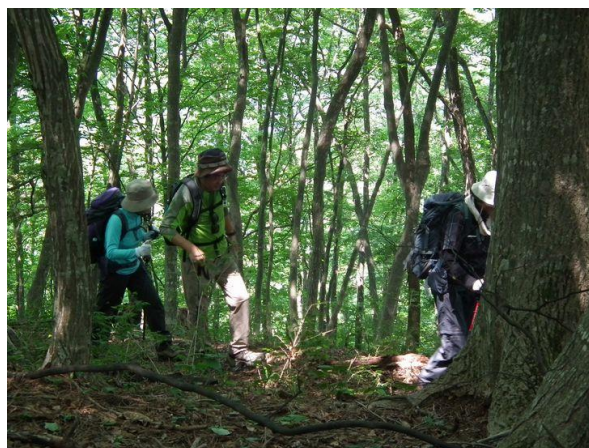
ガンバ！！ 山は気合いだ！