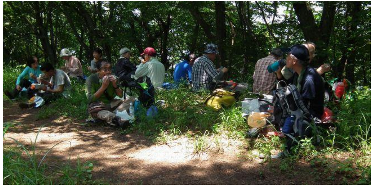
木陰のランチタイム