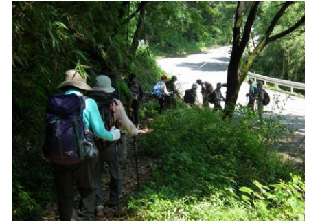
ようやく犬目宿・旧甲州街道に下り立つ。右へ行くと鳥沢宿です。