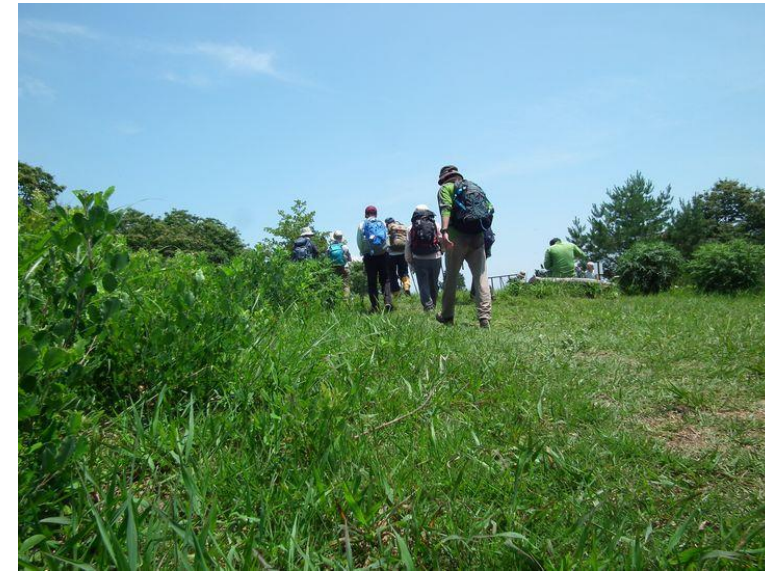
ランチタイム後山頂経由下山へ