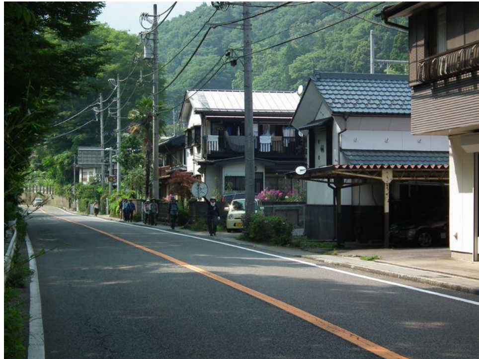
ようやく国道 20 号（甲州街道）に出ました。あとはビールを目指すのみ！