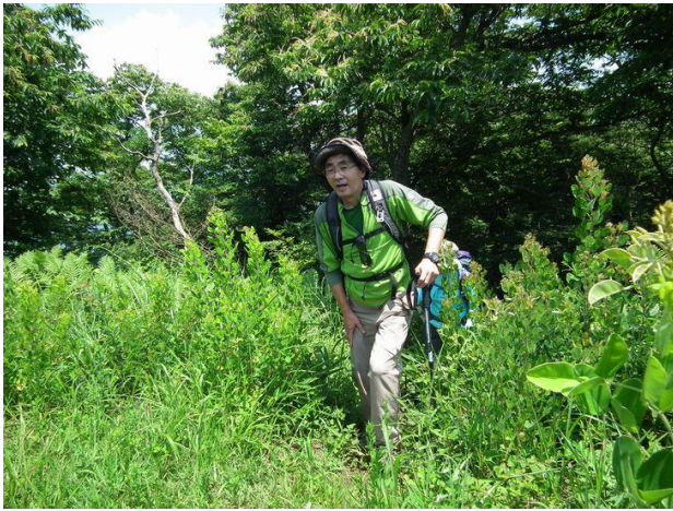
やっと扇山到着！ 少し休みましょう。