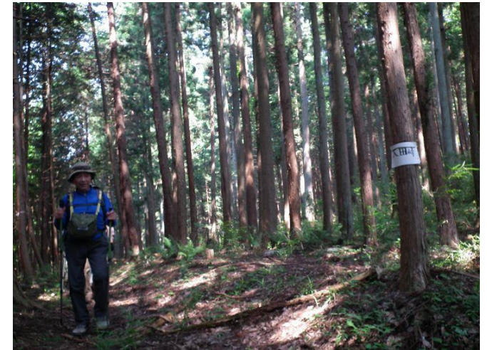
太田峠 道祖神が草に埋もれていた。