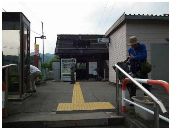
15:33 東京行が来ますよ！

総勢 13 名のにぎやかな山歩きでした。 長く感じたコースでしたが、CT4 時間ほどです。梁川で気温 30 度ほど、それ以上に暑く感じた一日でした。 季節を変えて歩きたいものです。 お疲れ様でした。イガ