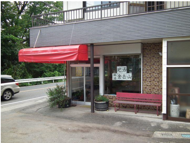
梁川駅前ビール販売店 本日の喉の渴きを潤す液体、これがなければ山なんかやっついていられないと！