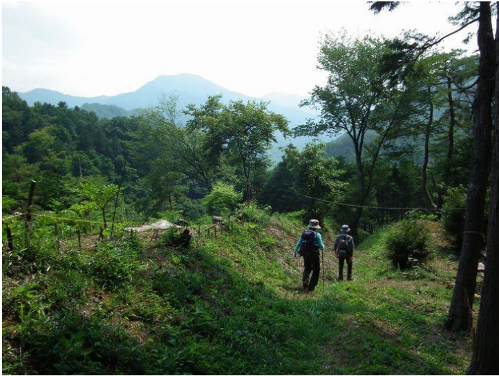
太田峠から斧窪へ、前方には倉岳山が見える。