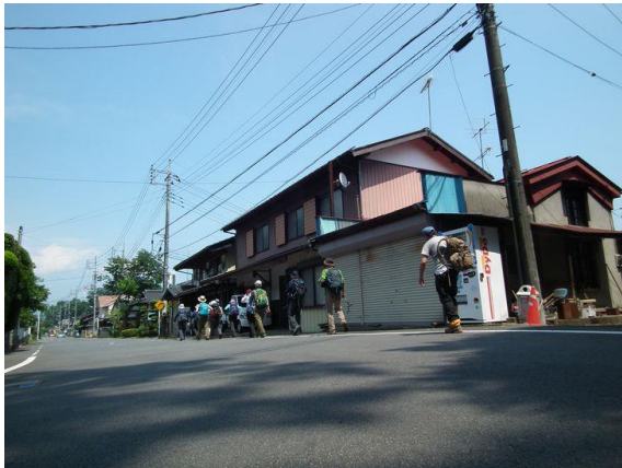
犬目からゴルフ場の脇を通り太田へ