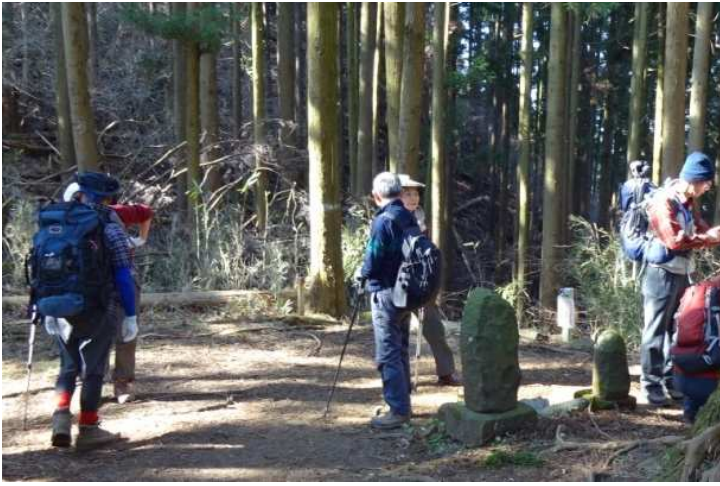
ゆっくりと2時間がかかりでビリ堂