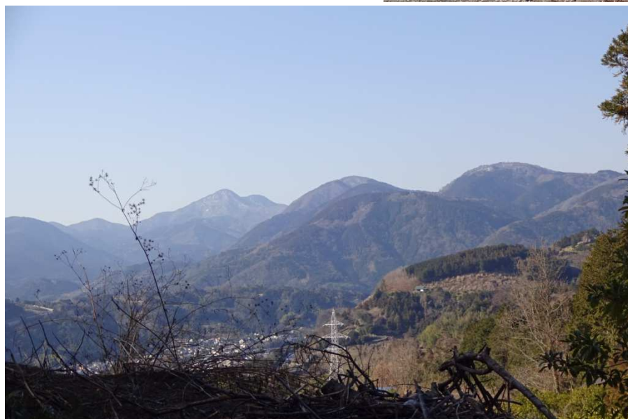
春が近くに来ている 霞がかかった 金時山—矢倉岳