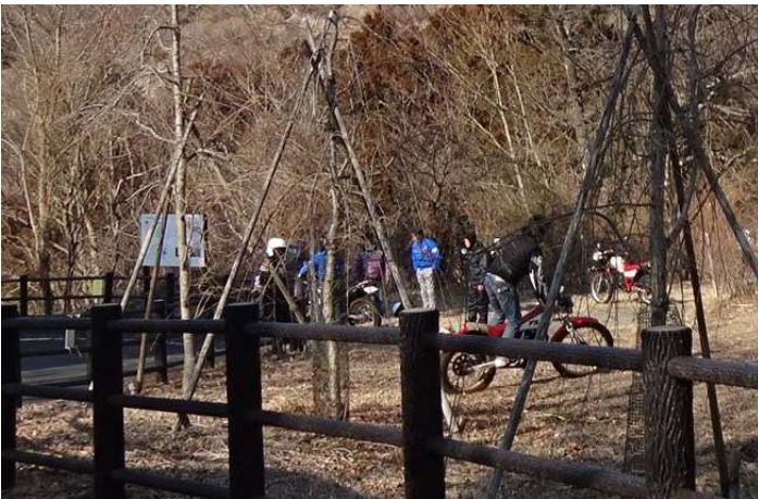
不心得者はいるもので 柵内の園地でモトクロスバイクを 乗り回して、芝生を台無しにしていた いい年をしたおっさん連中だった