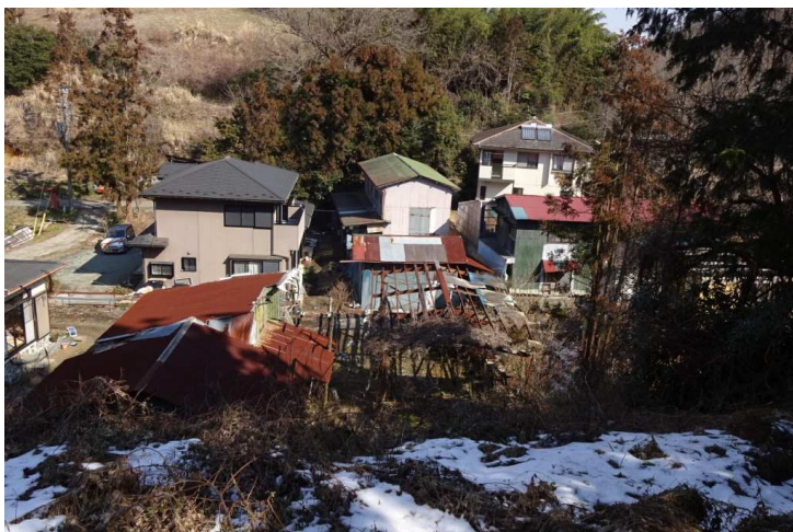
御多分にもれず 廃屋が目だっていた