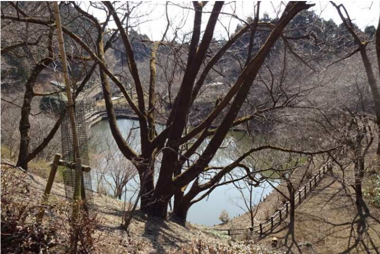
公園の全景（桜の季節が最適）