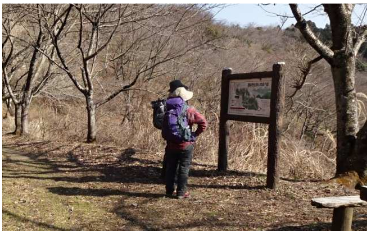
最明寺史跡公園入口