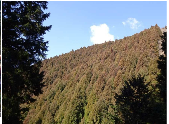
春もすぐそこ、スギ花粉も破裂寸前