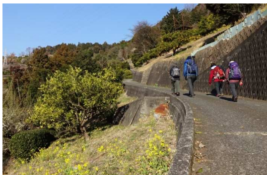
高松集落へ向かい 途中からミカン畑の農道を登る