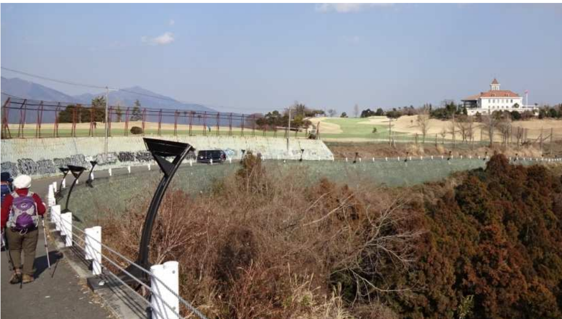
尾根上の ロケーション抜群な チェックメイトゴルフ場 タクシーで下山