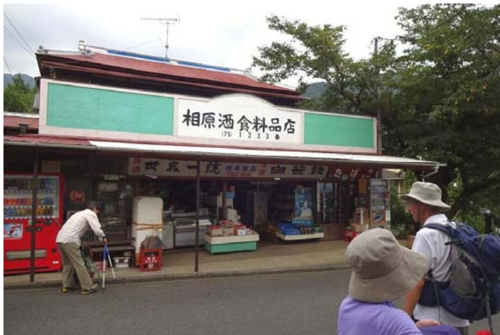
菩提原集落の酒屋でビール瓶の箱を 椅子代わりにして しばし反省会をする