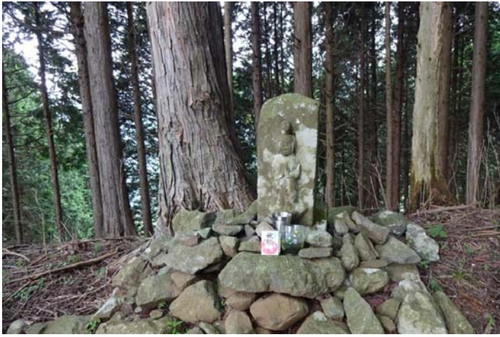
植林帯中腹に山の神があった 文化7年刻印（1810年）

ヘリの荷揚げを山頂で見られるのを 期待していたが 間もなく仕事は終了したようだ 山頂手前で静かになった 植生保護資材が荷揚げされていた