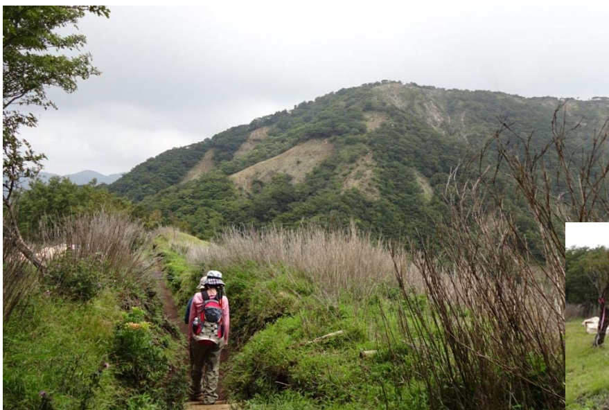
荷揚げ物があちこちに 置いてある