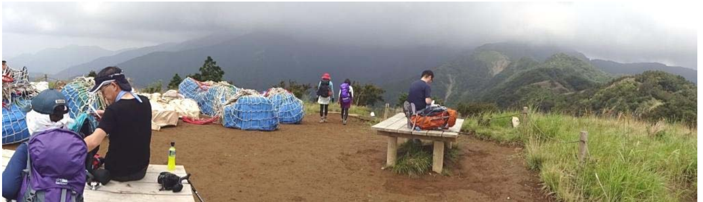
塔ノ岳方面の稜線はガスがかかってきた