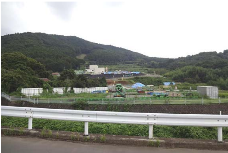
三角山（菜の花台）下に第二東名の トンネルを掘っている最中だった